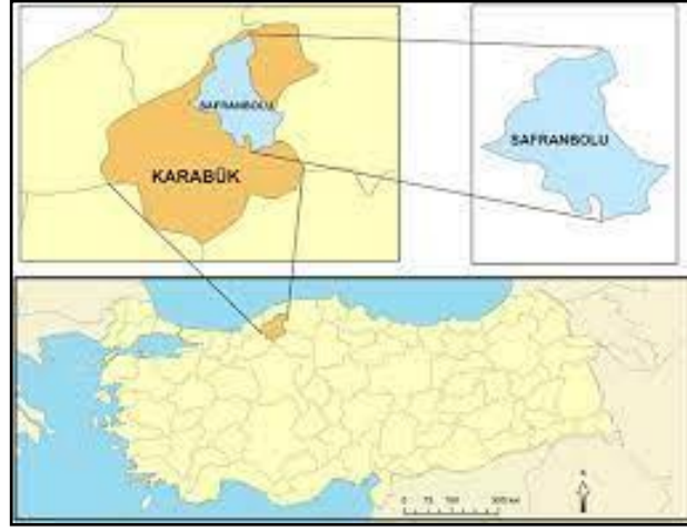
Şekil 1: Safranbolu'nun Konumu

Türkiye'nin Karadeniz Bölgesi'nin batı bölümünde bulunan Karabük ilinin 10 km uzaklığında yer alan ve ilin en büyük ilçesi olan Safranbolu (Şekil 1), Karadeniz'e 90 km, komşusu olan Kastamonu iline 105 km ve Bartın iline ise 89 km mesafede yer almaktadır. Türkiye'nin önemli şehirlerinden olan Ankara'ya 239 km ve İstanbul'a ise 450 km uzaklığındadır (Tunçözgür, 2012, s. 25).