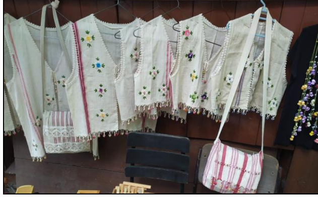
Resim 21: Safranbolu'da Dokuma Ürünlerinin Satıldığı Bir Dükkan