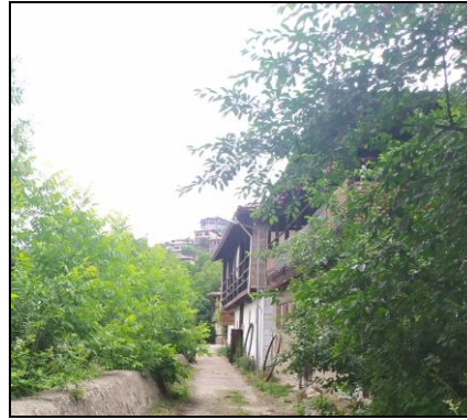
Resim 11: Safranbolu Tabakhane Atolyelerinin Bulunduğu Sokaktan Bir Görüntü

Safranbolu kentinin 19. Yüzyılda ekonomik olarak en parlak dönemini yaşadığı söylenmektedir. 1880-1892 yılı Kastamonu Salnamelerinde Safranbolu’da 84 adet tabakhanenin varlığından bahsedilmektedir (Tunçözgür, 2002, s. 26-27). 1901 yılı Yukarı Tabakhane loncası sicil defteri kaydına göre kentte 194 debbağ, 1923 yılı