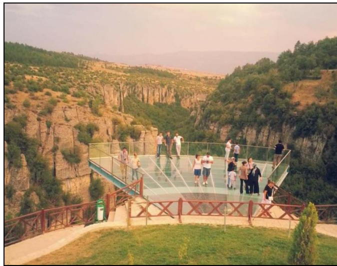
Resim 8: Safranbolu'ya 2013 yılında yapılarak Turizme Kazandırılan Kristal (Cam) Teras