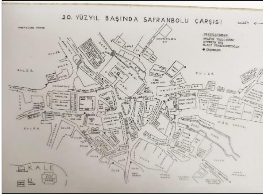
Şekil 2: 20. yy başlarında Safranbolu "Eski Çarşı" Bölgesi

yaşamıştır. Şekil 2’de bugün eski çarşı diye isimlendirilen bölgenin 20. Yüzyıl başlarında ki zanaat kollarının yer aldığı çarşı düzeni gösterilmektedir.