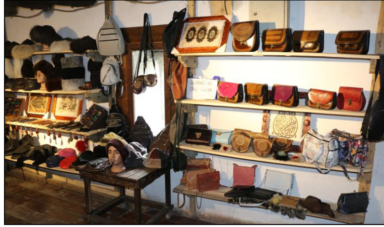
Resim 18: Gezi Evinde Deriden Yapılan ve Satışa Sunulan Ürünler