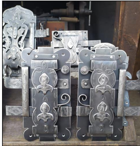
Resim 37: Safranbolu'da İmal Edilen Kapı Kilitleri