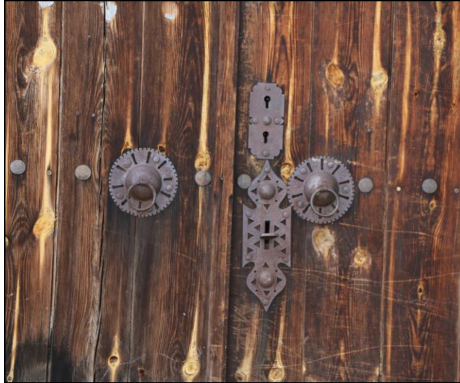
Resim 34: Tarihi Geleneksel Safranbolu Evlerinde Bulunan Kapı Kilit ve Tokmaklarına Bir Örnek