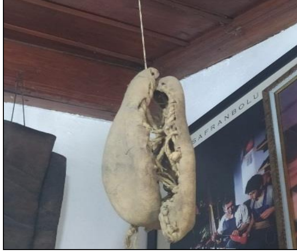
Resim 26: Eski Bir Yemeni