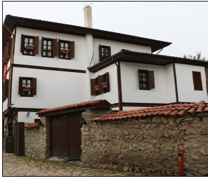
Resim 1: Geleneksel Safranbolu Evi

Safranbolu'da kapalı toplum yaşantısı olduğu görülmektedir. Safranbolu evlerinin yapısı ve şekli incelendiğinde haremlik-selamlık şeklinde bir geleneğin olduğu görülmektedir. Bahçe duvarlarının yüksek olması (Resm 1, Resim 2), kadınların ve erkeklerin eve girişlerinin ve çıkışlarının farklı kapılardan olması bahsi geçen geleneğe örnek olmaktadır (Günay, 1981, s. 21).