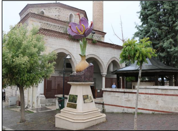
Resim 5: Safranbolu'dan Bir Grnt

Tablo 6 genel olarak incelendięinde; Safranbolu'nun turizm potansiyelinin olduka yksek olduęu, birok kiři tarafından keřfedilmek istendięi grlmektedir. Bu durum řehrin ekonomisine saęladığı katkı ve řehrin tanınması konusundaki etkisiyle olduka nem arz etmektedir.