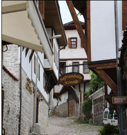
Resim 44: Safranbolu’da Konaklama Hizmeti Veren Bir İşletme