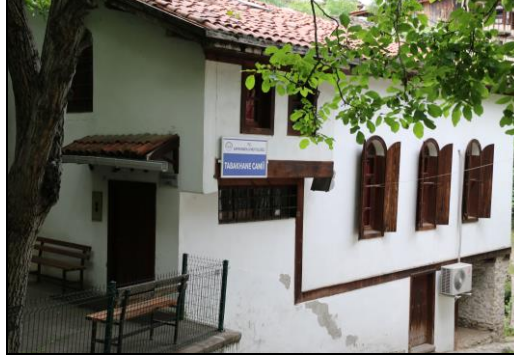
Resim 9: Tabakhane Bölgesinde Bulunan Cami

yöntemlerle işlenerek en iyi işlenmiş deri elde edilmektedir (Günay, 1981, s. 17). Tabakhaneler yerleşim yerlerinin dışında kalan bölgelere kurulmuş (Resim 11) hatta “Kabak bostandan dışarı, tabak esnaftan dışarı” deyimini de Safranbolu’da oldukça yaygın kullanılmaktadır. Bu deyim de debbağlığın şehirden uzak yapılmasını ifade etmektedir (Acar, 2011, s. 50).