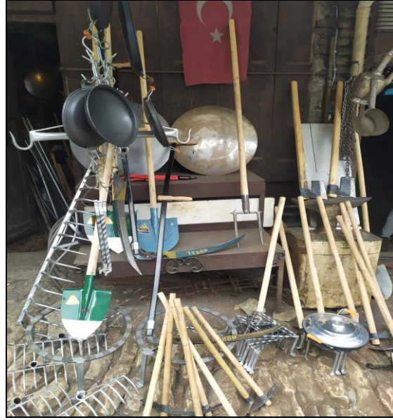
Resim 29: Demircilik Sanatında İmal Edilen Ürünler