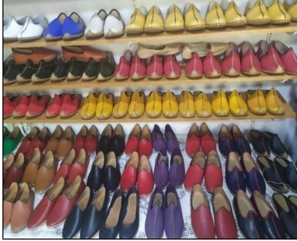
Resim 25: Günümüzde Üretilen Yemeni Modelleri