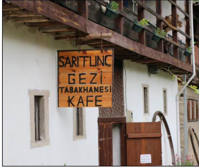
Resim 14: Tabakhane Gezi Evi ve Kafeterya