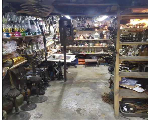
Resim 39: Safranbolu’da Satılan Bakır Ürünler