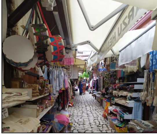
Resim 42: Safranbolu’da Hediyeelik Eşya Satan Dükkanlardan Bir Görüntü