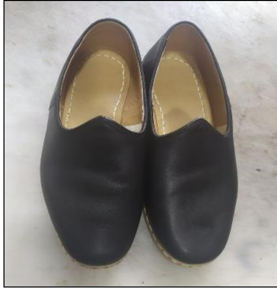
Resim 24: Günümüzde Yapılan Yemeni Örneği

Erhan Usta geçmiş dönemlerde yemeni yapımında oltan dikişinin (iri dikiş) kullanıldığını belirtmekte günümüzde ise bu dikişin yerine yemeni yüzü ile taban astarını birleştirip, bunun üstüne de köseleyi monte edip yapıştırdığını ve hepsini birleştirdikten sonra kenarlarını ise el dikişi yaptığını ifade etmiştir. Yemenicilik sanatında tezgah, iskemle, önlük, bıçak, muşta, yemeni bıçağı, tığ, iğne, iplik, örs, çekiç, balmumu, zımba, kenar bıçağı ağırlık, ökçe demiri, törpü, yemeni gibi araç gereçlerin kullanıldığını belirtmektedir.