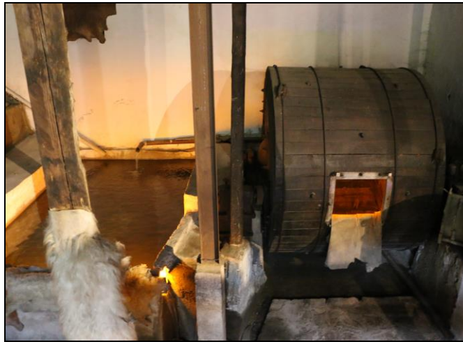
Resim 15: Tabakhane Gezi Evinde Sergilenen Derilerin Temizlendiği Havuz ile Kurutulduğu Fırın