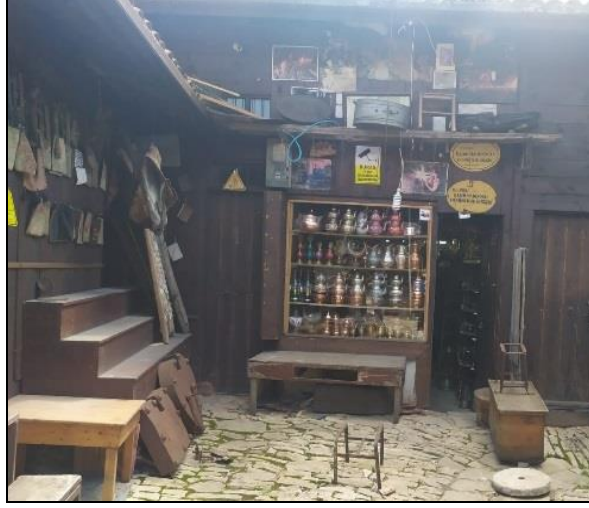
Resim 38: Safranbolu’da Bakır Ürünlerin Satıldığı Bir Dükkan