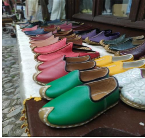
Resim 19: Yemeni

17. yüzyılın ikinci yarısında Köprülü Mehmet Paşa Camisine gelir sağlamak amacıyla yapıldığı söylenen ve 48 dükkandan oluşan, aynı tür malın üretildiği ve satıldığı bölümleri ifade eden “arasta” ların kurulduğu ve en ünlü arastanın ise “Yemeniciler Arastası” (Resim 20) olduğu söylenmektedir. Yemeniciler Arastası'na Safranbolu'da “arasna” denilmektedir (Ulukavak, 2017, s. 125).