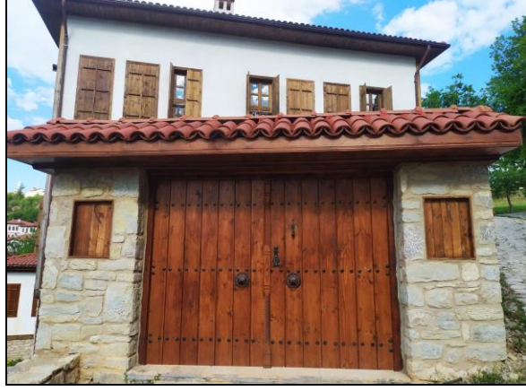
Resim 2: Geleneksel Safranbolu Evi

Safranbolu'nun ekonomik özellikleri incelendiğinde ise su kaynakları ve bitki örtüsünün zenginliği, geniş platoların varlığı tarım ve hayvancılığın gelişmesinde önemli rol oynamaktadır (Hacısalıhoğlu, 1995, s. 412). Önemli ticaret yolları üzerinde yer alan Safranbolu'dan tarih boyunca çok sayıda kervan geçmekte ve burada konaklamaktadırlar. Gelen tüccarların konaklama ihtiyacının sağlanması amacıyla "Cinci Hanı" yaptırılmış ve böylece Cinci Han ekonomik canlılığın artmasına katkı sağlamıştır (Tunçözgür, 2002, s. 25). Anadolu Selçukluları Dönemi'nde ortaya çıkan ahilik anlayışı Safranbolu'da da devam etmiş ve Osmanlı Dönemi'nde oluşan, lonca adı verilen ve temel amacı belli bir pazarı korumak olan anlayışın gelişmesi için ahi teşkilatı ile esnaf birlik olmuşlardır (Tunçözgür, 2012, s. 40). Safranbolu'da, han-hamam-cami ve çarşı bir arada bulunmaktadır. Kentin en merkezi yerinde bulunan cami çevresinde ise çeşitli zanaat kollarına ait üretim yapan dükkânlar sıralanmıştır (Bogenç ve Sabaz, 2019, s. 1531). Çeşitli meslek grupları farklı farklı sokaklarda kurulmuş ve buldukları sokakların adını taşımışlardır (Resim 3, Resim 4).