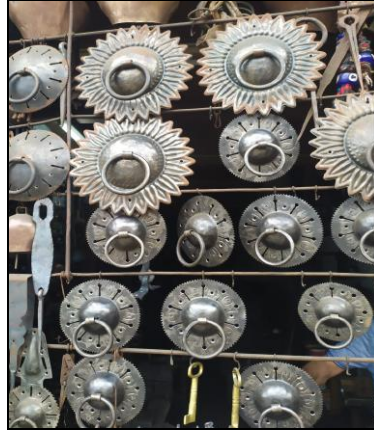
Resim 36: Safranbolu'da İmal Edilen Kapı Tokmakları