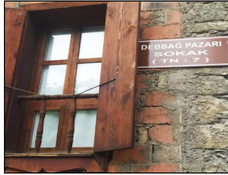
Resim 4: Debbaglık Sanatının Adının Verildiği Sokak

Safranbolu ekonomisinde tarım ve hayvancılıktan sonra özellikle Osmanlı Dönemi'nde el sanatları, dericilik ve ticaret önemli rol oynamıştır. Deri üretiminin temel alındığı görülmekte ve dericilik üretimine bağlı olarak; saraçlık, semercilik, kunduracılık, yemenicilik gibi çeşitli zanaat kollarının ortaya çıktığı söylenebilmektedir. Deri işleme atölyesi olan debbaghane veya tabakhaneler şehir merkezinin dışında yer almaktadırlar (Hacısalıhoğlu, 1995, s. 415). Safranbolu iş kollarına bakıldığında zaman çoğunlukla el işçiliğinin olduğu görülmektedir. Demircilik, yemenicilik, kalaycılık, bakırcılık, debbaglık vb. gibi el sanatları dönemin önemli zanaat kollarını oluşturmakta ve şehrin ekonomisinde önemli pay sahibi olmaktadır. Safranbolu'da ekonominin özellikle 19. Yüzyılda daha canlı olduğu bilinmektedir. Bölgede özel olarak yetiştirilen safran bitkisi ve Safranbolu lokumu da şehrin diğer ekonomik gelir kaynakları arasında yer almaktadır (Hacıbebekoğlu, vd., 2014, s. 51).