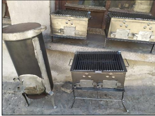
Resim 32: Günümüzde Yapılan Soba ve Mangal Örnekleri