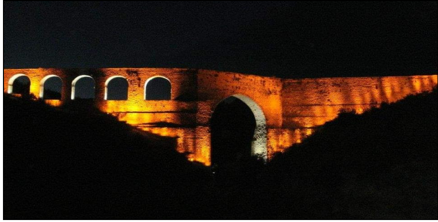
Resim 7: Safranbolu Tarihi İncekaya Su Kemerini