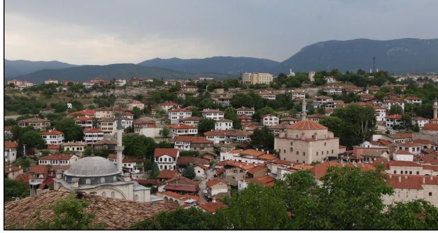
Resim 6: Safranbolu'dan Bir Görüntü