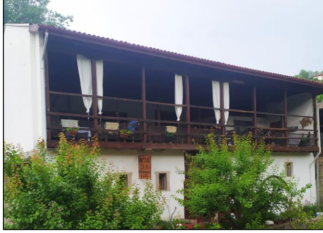
Resim 13: Tabakhane Gezi Evi ve Kafeteryası