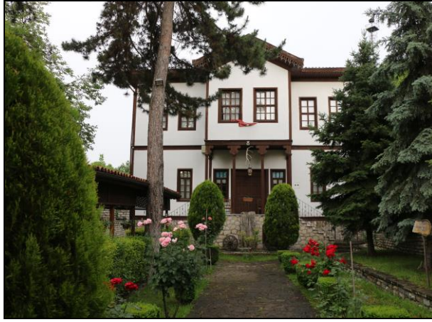
Resim 43: Safranbolu’da Konaklama Hizmeti Veren Bir İşletme