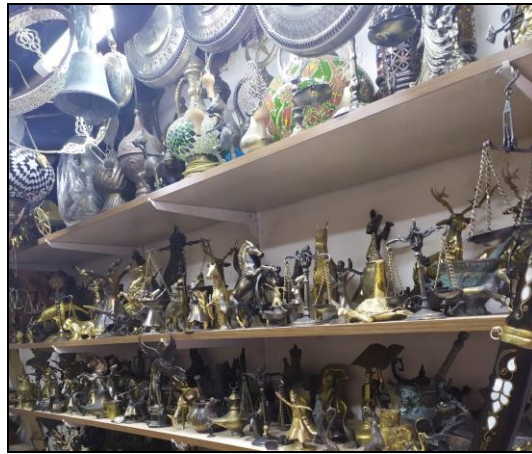
Resim 40: Safranbolu’da Satılan Bakır Ürünler