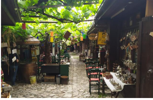
Resim 45: Günümüzde kafe olarak kullanılan Yemenciler Arastasi'nda bulunan loncanın toplandığı “Yemenciler Kahvesi”