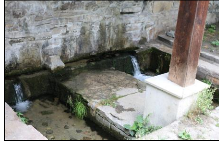
Resim 10: Tabakhane Bölgesinde Bulunan Caminin Altından Çıkan Su