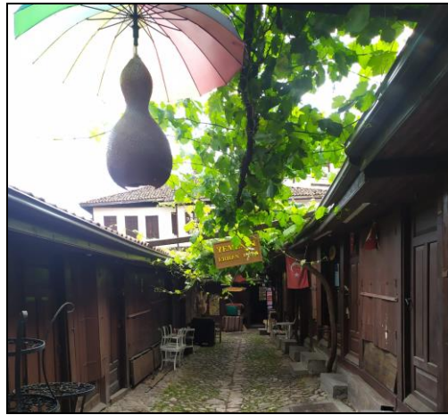
Resim 20: Yemeniciler Arasnası