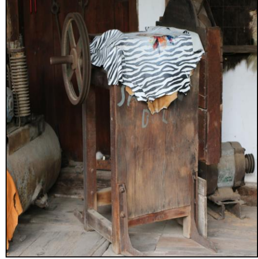
Resim 16 ve Resim 17: Tabaklıkta Kullanılan ve Gezi Evinde Sergilenen Bazı Makineler