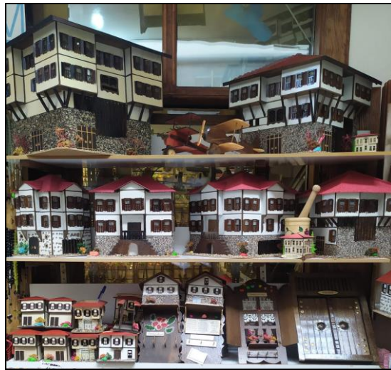
Resim 41: Hediyelik Safranbolu Maket Evleri

Safranbolu Osmanlı mimarisine sahip evleri, Arnavut kaldırımları, doğası ile dikkat çeken kültürel miras alanlarımızdandır. Bu özellikleri ile her yıl birçok turisti misafir etmektedir. Turizm potansiyeli bakımından zengin olan Safranbolu şehrinin ticari faaliyetlerinde turizm hizmetine yönelik bir değişim yaşadığı gözlemlenmiştir. Gezip-görmek, keşfetmek için gidilen bir yerin hatırasının kalması amacıyla o yere özgü temsili bir eşya satın alınmaktadır. Safranbolu'da ticari faaliyetlerde ilk sırayı alan hediyelik eşya dükkanları da bu düşüncüyü doğrulamaktadır. Bu dükkanlarda meşhur Safranbolu evlerinin maketleri, magnetleri, bibloları, meşhur safran kolonyası, ahşap işleri ile yapılan süsler gibi hediyelik ürünler satılmaktadır (Resim 41- Resim 42). Konaklama (Resim 43- Resim 44) ve yeme-içme (Resim 45) sektörünün de yine turizme bağlı olarak geliştiği düşünülmektedir. Safranbolu ilçesinin meşhur olan lokumun da yerli ve yabancı turistlerin ilgisini çektiği görülmektedir (21 dükkan mevcut).