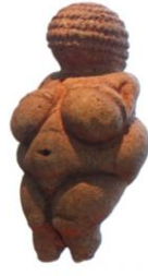
Resim 2. Willendorf Venüsü