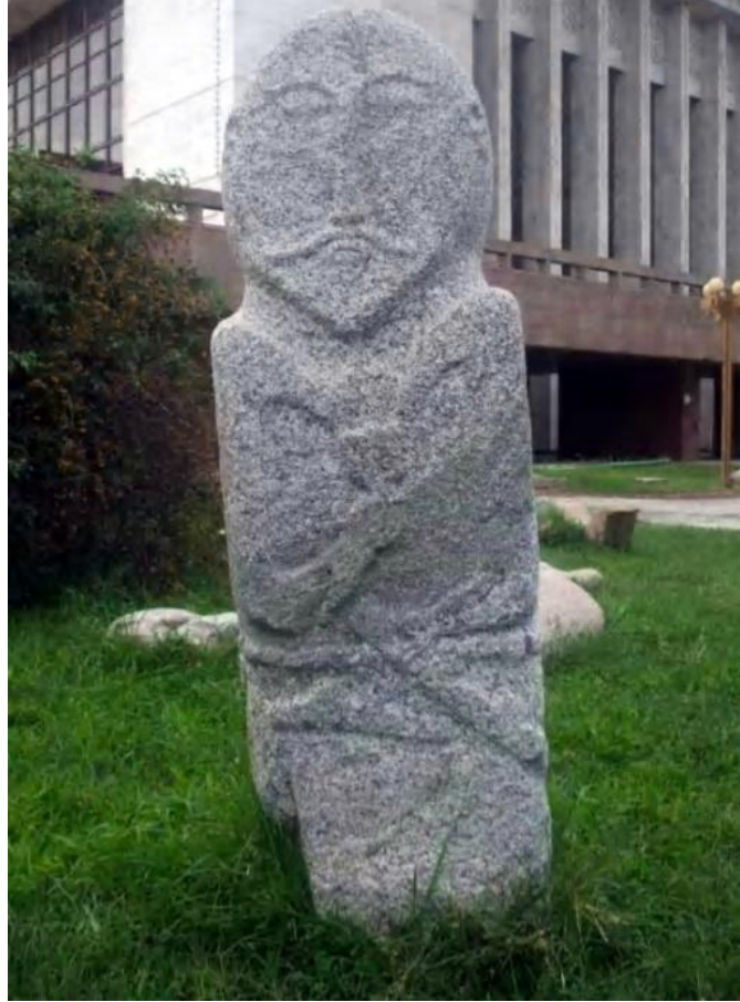
Resim 4. Balbal Örneği

Diğer taraftan çeşitli eşyalar üzerinde uyguladıkları sanatlar, mezar taşı olarak diktikleri balballar, kurganlar içine yerleştirilen çeşitli eşyalar ve daha pek çok sanatsal özellik zaman içinde Türk kültürünün bir parçası haline gelmiş ve kültürün şekillenmesinde ve aktarılmasında önemli bir işlev ortaya koymuştur. Orta Asya’da kurulmuş en eski Türk Devletleri olan Hun İmparatorluğu ve Göktürk Devletinde ortaya çıkan eserler kültür ve sanat arasındaki ilişkiye örnek olarak verilebilir (Resim 4).