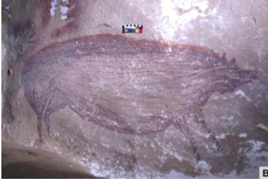
Resim 1. Sulawesi Mağara Resimleri