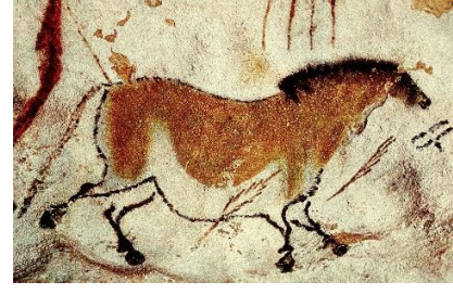
Resim 3. Lascaux Mağara Resimleri