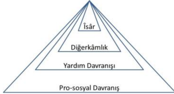
Şekil 1 Pro-sosyal Davranışlarda Diğerkamlığın Kavram Haritası 96

ile eş anlamlı kullanılsa da aralarındaki fark şöyle izah edilmektedir; diğerkamlık diğerini kendisine üstün tutma olarak ifade edilse de îsâr, kendisi ihtiyaç halinde iken dahi kişinin elindeki imkânı başkasına sunmasıdır. Diğerkamlıkta bedel ödeme sözü konusu değilken îsârda bedel ödeme pahasına karşındaki insanı tercih etme durumu mevcuttur. Bu bağlamda îsâr, kavramsal olarak diğerkâmlığın altında, ahlaki olarak ise diğerkamlıktan üst kategoride değerlendirilebilir. 95