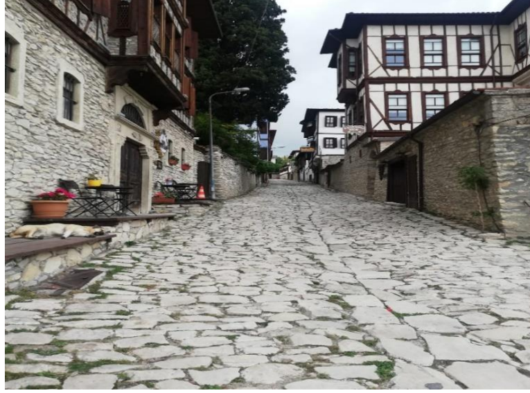
Resim 7: Safranbolu Sokak Aralarından Bir Görünüm