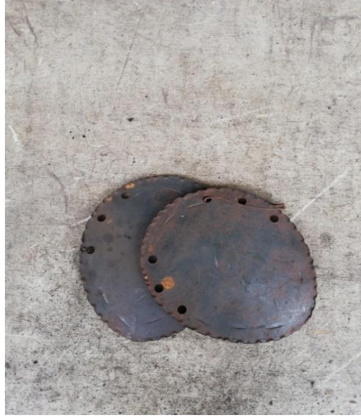
Resim 31: Safranbolu Kentinde Kullanılan Nal Örneği

uğraştığı bilinmektedir. Zanaatla uğraşan kişi sayısı göz önünde bulundurulduğunda geçmişte bu mesleğin oldukça geçerliği olduğu ortaya çıkmaktadır (Sağ, 2018, s. 18). Günümüzde Safranbolu kentinde nalbantlık mesleği yok olan meslekler içinde yer almaktadır. İlerleyen teknoloji ile beraber at ve binek hayvanlarının yerini motorlu taşıtların alması geçmişte bu kadar önemli olan geleneksel sanatın unutulmasına ya da yok olup gitmesine neden olmuştur.