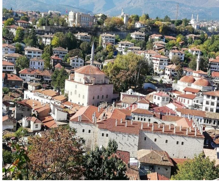
Resim 6: Safranbolu Kentinden Bir Görünüm

Safranbolu kentinde çarşı camii, han, hamamlar bir arada yer almaktadır. Sokaklar çarşı doğrultusunda açılır çarşımı orta noktasında değerli eşyaların satış alanı olan bedesten bulunur. Arazinin uygunluğu nispetinde çarşı çukur alanlara, evlerde birbirinin manzarasını kapatmayacak tarzda yamaçlara inşa edilmiştir (Resim 6). Kentin muhtelif yerlerinde camii bulunmakla birlikte, şehrin en önemli camii daima şehrin merkezinde bulunur, bu camii etrafında dükkânlar sıralanır (Tuncel,1980, s. 149).