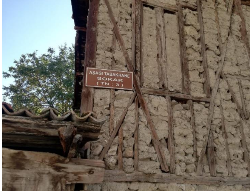
Resim 14: Tabakhane İsminin Verildiği Bir Sokak

Safranbolu kentinde geleneksel el sanatları usta çırak ya da babadan oğula aktarım yöntemiyle sürdürülmüştür. Tarihi kentte son dönemlerde geleneksel mesleklerin azaldığı ya da işlevini yitirdiği görülmektedir. Sebep olarak Karabük'te kurulan Demir Çelik fabrikalarına işçi toplamaları ve Birinci Dünya Savaşı'nda küçük yaştaki gençlerin askere gönderilmesi mesleklerde çırak eksikliği yaşanması olarak gösterilebilir. Yaşlı, hasta ve sakat nüfus dışında gelecek güvencesi, yüksek ücret ödenmesi, çalışma saatlerindeki kısalık gibi faktörlerden dolayı Safranbolu'dan Karabük demir çelik fabrikalarına iş gücü kayması yaşanmıştır. Buna paralel olarak geleneksel meslekler birer birer önemini yitirmiştir ve kaybolmuştur (Tunçözgür, 2012, s. 45).