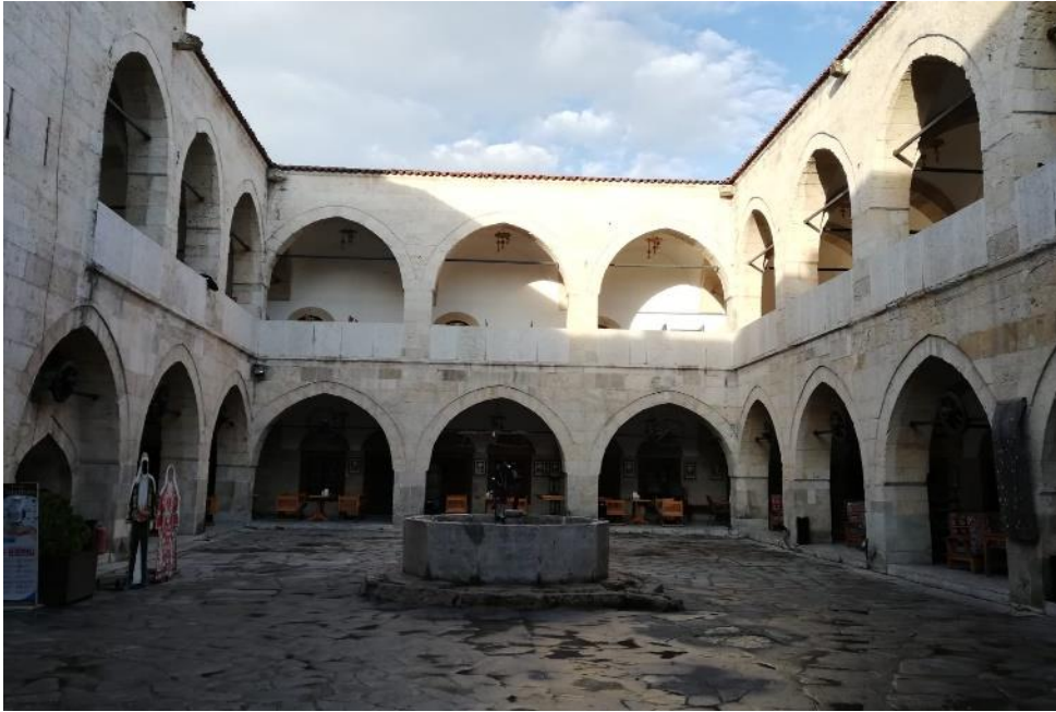
Resim 2: Tarihi Cinci Hanından Bir Görünüm

Kapalı bir ekonomiye sahip olan Safranbolu kentinin en belirgin özelliklerinden biride önemli bir kervan yolu üstünde olmasıdır. Bu özelliği ile kent önemli bir ticaret ve konaklama merkezlerinden biri konumundadır. Yörede 17. yy. beraber imar hareketleri hız kazanmış ve ekonomik yapıyı da etkilemiştir. Cinci Hanı’nın inşa edilmesiyle beraber ekonomik canlanma daha üst seviyelere ulaşmıştır (Tunçözgür, 2012, s. 38-39) (Resim 2). Başlangıçta Safranbolu güzergâhından geçen kervanların mallarını sundukları bir şehir hanı olan ve Osmanlı mimarisini yansıtan han, sonraları bölgesel düzeydeki fonksiyonları farklılaştıkça şehir esnafının mallarını koruduğu bir mekân olarak kullanılmaya başlanmıştır (Şendil, 2017, s. 58).