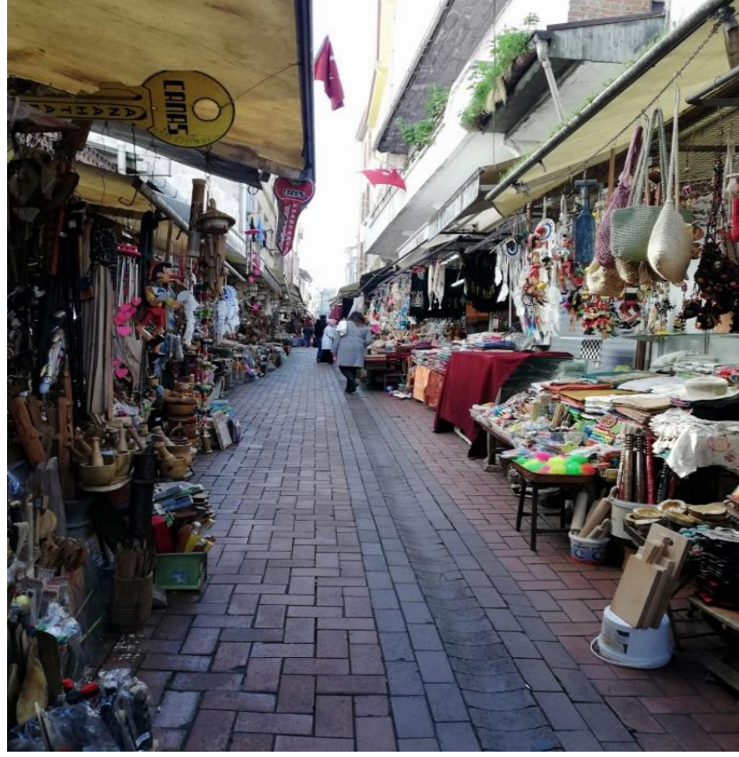
Resim 43: Tarihi Çekiciler Çarşısından Bir Görünüm

3000 yıllık tarihe sahip Amasra kentinde ziyaretçilerin dikkatini çeken arkeolojik sit alanları yer almaktadır. Günümüze kadar pek çok medeniyeti barındıran Amasra şehir merkezi, birinci, ikinci, üçüncü arkeolojik sit alanlarına bölünmüştür. Tavşan ve Boz tepe adası birinci, kentin Mezarlığı Nakrapel ve eski bir yerleşim alanı akropol ikinci derece, genellikle Osmanlı Türk sivil mimarisini yansıtan kum, Boztepe mahallesi, Kaleiçi mahallesi, bedesten mahallesi üçüncü derece sit bölgesi olarak belirlenmiştir (Özdemir, 2006, s. 42). Eşsiz manzaraları ve kültürel dokusuyla Amasra kentinde, başta deniz turizmi olmak üzere farklı alternatif turizm türlerine rastlanmaktadır. Bu turizm türlerine Tablo 6’da yer verilmiştir;