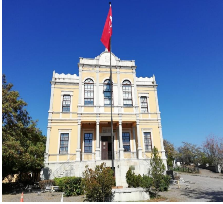
Resim 12: Safranbolu Eski Hükümete Konağı

Safranbolu kentinde her geçen gün turizm gelişmiş ve dünyanın benimsediği turistik cazibe merkezlerinden biri haline gelmiştir. Safranbolu’da turizmin bu denli gelişiminde bazı faktörlerin etkisi oldukça büyüktür. Safranbolu’da zaman belgeselinin 1976 tarihinde TRT’de yayımlanmasıyla kentin tanıtımı ve korunması yönünden hayli etkili olmuştur. Batı Karadeniz bölgesinin önemli bir turizm destinasyonu olan Amasra kentinin güzergâhında yer alması Safranbolu turizmine önemli katkı sağlamıştır. Yine İstanbul ve Ankara illerine olan yakınlığı ile ulaşım olanaklarının Safranbolu’da turizmin gelişimini desteklemiştir (Özdemir, 2011, s. 132).