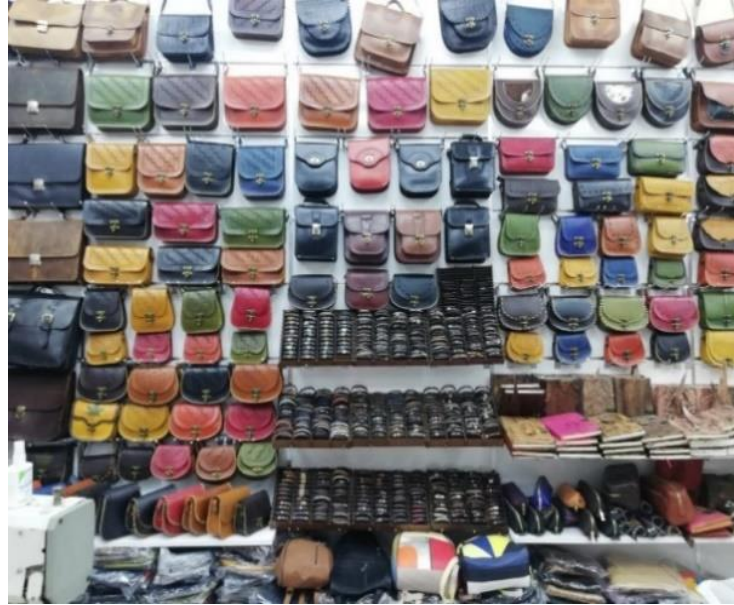
Resim 33: Deri Ürönlere Örnek