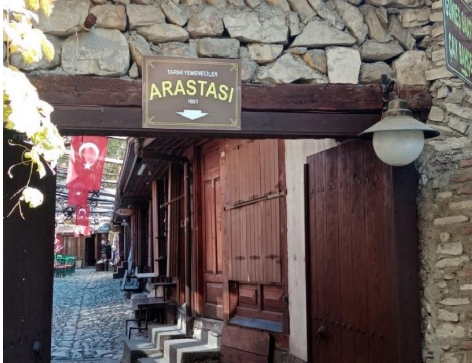
Resim 13: Tarihi Yemeniciler Arastası

Safranbolu kentinde iktisadi yaşamının işleyişi lonca sistemine göre de sürdürülmüştür. Her meslek kendi arasında örgütlenerek bir birlik oluşturmuştur. Daha çok eşya işleyici konumundaki zanaatkârların meydana getirdiği bu birlikler; demirciler, dericiler, semerciler, yemeniciler, bakırcılar gibi kendi meslek isimleriyle isimlendirilmektedir. Kentin yerleşme planında ayrı ayrı sokaklarda yer alarak kendi adlarını vermişler ve günümüzde de Safranbolu da aynı adlarla yer almaktadırlar. (Resim 13–14). Safranbolu'da imalat etkinlikleri arasında bulunan dokumacılık ise, genellikle evlerde yapılmakta ve bu nedenle Safranbolu evlerinin genelinde dokuma tezgâhı yer almaktadır. O devirlerde keçecilik ve mutahafılık (tuhafiyecilik ) hayli yaygın olarak yapılmıştır (Kalyoncu, 2010, s. 40-42).