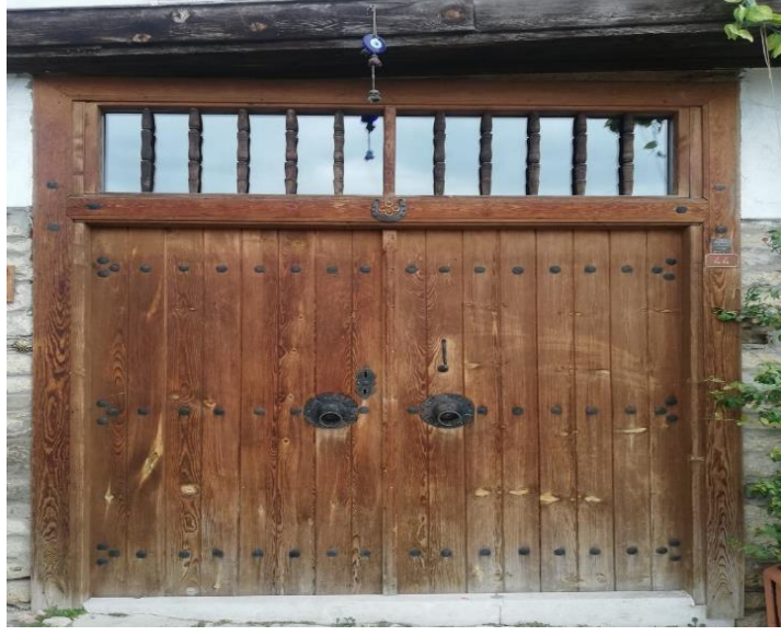
Resim 18: Safranbolu Evi Kapı Halka ve Tokmaklarından Bir Örnek

Safranbolu’da önemli meslek dallarından biride sobacılıktır. İlçede demircilikle uğraşanların tamamına yakını aynı zamanda sobacılık da yapmaktadır. Özellikle odun sobası üretmektedirler. Kömür kullanımının ilçede artmasıyla beraber kömür sobası da imal edilmeye başlanmıştır. Bu gün ise sobacılıkla uğraşanların sayısı farklı sanat dallarında olduğu gibi hayli azalmıştır. Doğalgazın hayatımıza girmesiyle beraber sobaya olan ihtiyaç azalmıştır. Sobacılık sanatını icra eden ustalar yalnızca soba imalatı ile geçimlerini sağlayamadıklarından dolayı mangal ve farklı ziraat ürünlerde yapmaktadır (Acar, 2011, s. 77).