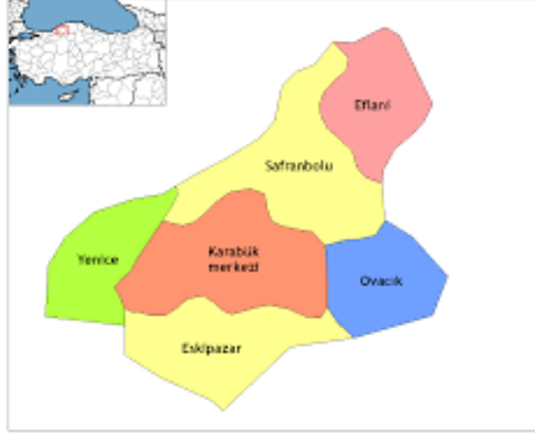
Şekil 1: Safranbolu'nun Konum Haritası (URL-3)

Safranbolu, Batı Karadeniz Bölgesinde yer alan ve korumanın başkenti olarak kabul edilen bir Osmanlı kentidir. Cumhuriyet kenti Karabük'ün 6 ilçesinden en büyüğüdür. Sahip olduğu tarihi evleri, eski çarşısı ve doğal güzellikleriyle gerek ülkemizin gerekse dünyanın önemli kentleri arasında yer almaktadır. Karadeniz bölgesinin batısında yer alan Safranbolu kenti, 10 km uzağındaki Karabük iline bağlı bir ilçedir. 110 km mesafede ki Kastamonu iline ve 80 km mesafede ki Bartın iline düzenli karayolu ile bağlıdır (Tunçözgür, 2002, s. 14).