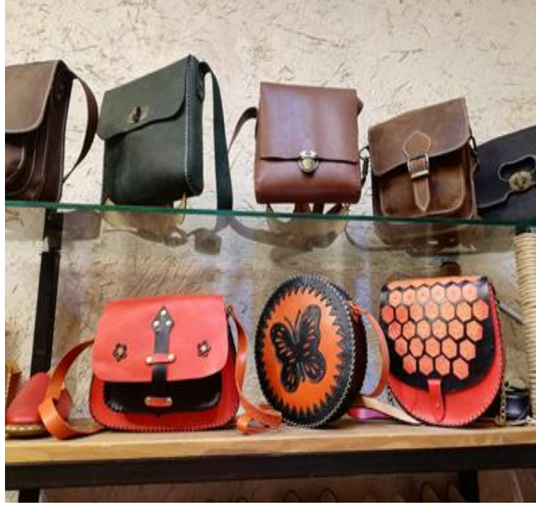
Resim 32: Deri Ürönlere Bir Örnek