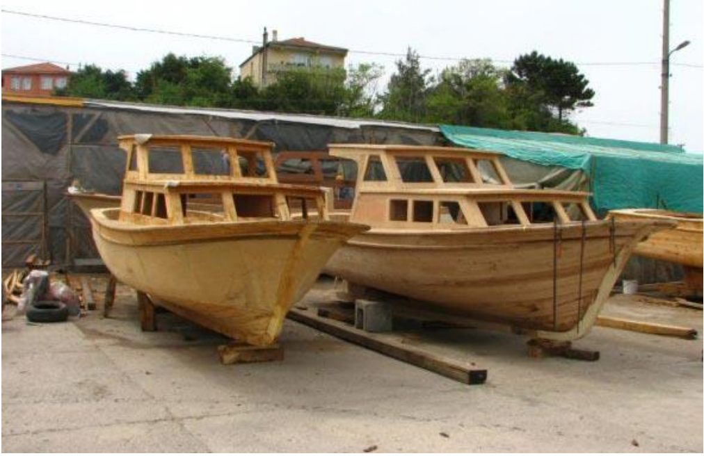
Resim 50: Bölgede Yapılan Ahşap Gemi Örnekleri (URL-15)

önemli parçalar eski araç gereçlerle yalnızca ustalık ve el emeği ile yapılmaktadır (URL-14). Araştırma alanımız olan Amasra kentinde ahşap gemi yapımı geçmişte yapılmış olsa bile günümüzde varlığını sürdürmemektedir.