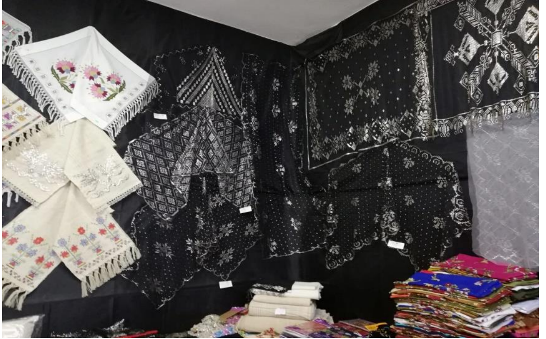
Resim 49: Tel Kırma Malzemelerinin Satıldığı Bir Dükkân

Tel kırma işlemesi Bartın da 1930, 1940 ve 1950 tarihlerde çok ilerlemiş ve ülkede kendini tanıtmıştır. İsmi yurt dışında dahi duyulmuştur. 1960 tarihlerin sonuna doğru tel kırma işlemesine rağbet azalmış ve yok olma tehlikesiyle karşı karşıya kalmıştır. 1980’li tarihlerin sonuna doğru tel kırma sanatı yeniden canlanmaya başlamıştır.1997-98 eğitim ve öğretim döneminde tel kırma sanatının eğitimine başlanmıştır.18.11.2004 tarihinde Bartın, İl kültür ve turizm müdürlüğü tarafından Türk patent enstitüsüne tel kırma” dalında patent başvurusunda bulunulmuştur. 2009 tarihinde yapılan başvuru kabul edilerek resmi gazetede ilan edilmiştir. Tel kırma işlemesi “Bartın işi tel kırma” ismiyle “coğrafi işaret tescil belgesini” elde etmiştir. Bu coğrafi işaret tel kırma sanatının gelecek kuşaklara bozulmadan iletilmesi gerektiğini de göstermektedir (Gören, 2020, s. 349-350). (Resim 49)