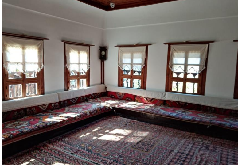
Resim 5: Tarihi Safranbolu Evinden Bir Bölüm

Safranbolu halkının eğitime büyük önem verdiği bilinmektedir. Dine verilen önem sebebiyle genel olarak her aile kız ve erkek çocuklarını küçük yaşlarda kuran öğrenmesi maksadıyla hocalara göndermişlerdir. Bu nedenden dolayı okuma yazma bilmeyen kız çocukları bile, muhakkak kuran okumayı bilmektedir. Safranbolu’da o dönemlerde hoca ve din adamlarının öğrettikleri öğrencilere sadece kuran öğretmekle kalmamışlar, dinin kuralları ve kuranın tefsirini ders olarak vermişlerdir. Kentte medrese eğitimi önemli bir yer kaplamaktadır (Kadem, 1998, s. 33). Safranbolu’ya ait eğitim yazıları incelendiğinde 1880 senesi başlarında, kent merkezinde erkek ve kız iptidai mekteplerinin yeterli sayıda olduğu görülmektedir. Eğitimin öneminin farkında olan halk kendi olanaklarıyla okul binaları inşa etmiş, kimilerini de onarmış; eşraf bu hususta önderlik etmiştir. Rüştüye ve iptidai mektepleriyle yetinmemiş 1915 tarihinde kendi imkânlarıyla liselerini (idadi) yapmışlardır (Eski, 2018, s. 3).