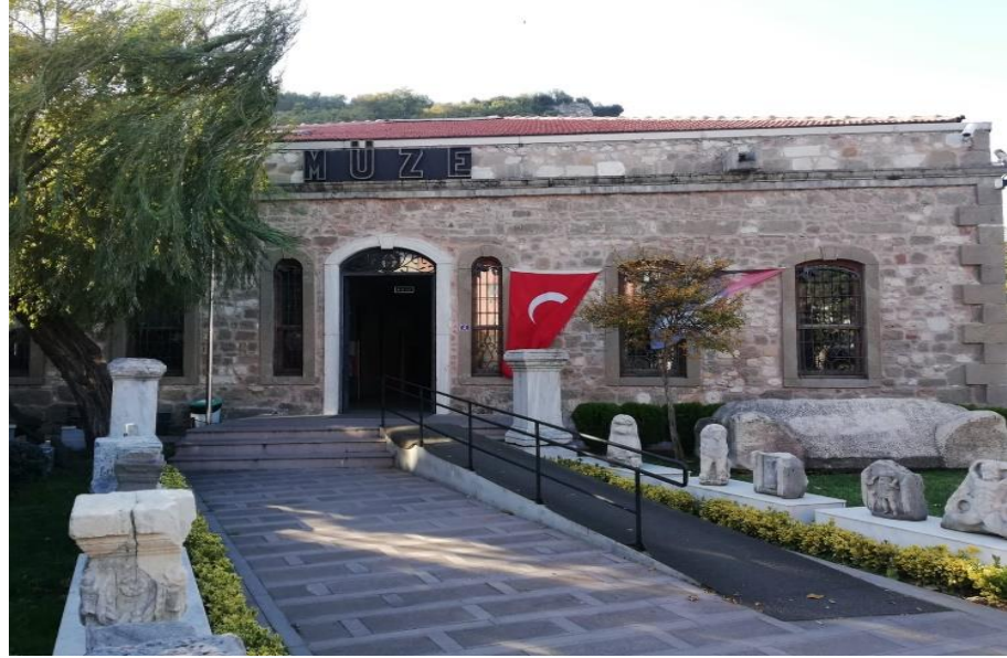
Resim 45: Amasra Kent MÜzesi