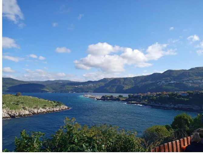
Resim 41: Amasra’nın Doğal Güzelliklerinden Bir Görünüm

Turistlerin, kullanımına ve faydalanmasına elverişli olan doğal kaynaklar en önemli turistik arz kaynakları içinde sayılmakta olup; bitki örtüsü, iklim, yaylalar, ırmak ve göller, mağaralar, plajlar, termal su kaynakları ve benzeri kaynaklar bu grubun kapsamına girmektedir (Kıyıcı, 2010, s. 63). Amasra, doğal yapısıyla (Resim 41) ve elverişli iklimsel şartlarıyla günümüzde rağbet edilen tatil beldelerindedir.