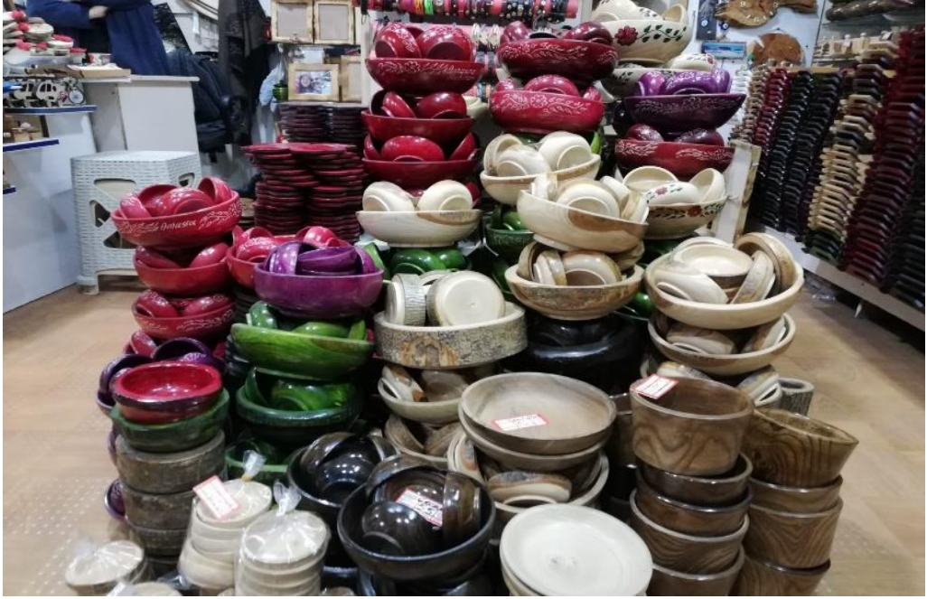
Resim 47: Çekicilik El Sanatına Örnekler