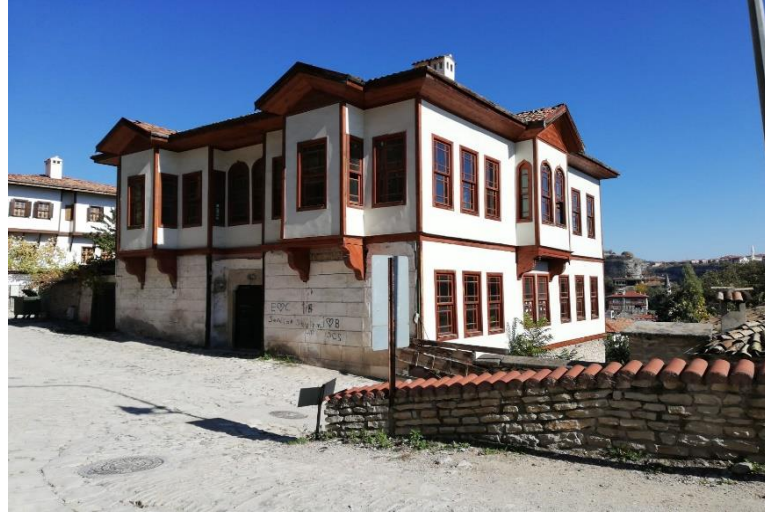
Resim 4: Tarihi Safranbolu Evi

olarak sosyal hayatı da olumlu yönde etkilemiş ve bu da mimariye de yansımıştır (Tunçözgür, 1997, s. 26). Ünü dünyaya yayılmış Safranbolu evleri mimari açıdan büyük ailelerin bir arada yaşam bulabileceği genelde iki katlı ve birden fazla odalı tarzda ve inancının bir gereği olarak kadın, erkeğin birbirlerini görmeleri önlenecek şekilde haremlik ve selamlık olarak bölmeli yapıda inşa edilmiştir (Resim 4). Safranbolu’da erkeklerin bulunduğu bölüme selamlık denilmektedir. Aynı zamanda burası iş görüşmelerinin yaşandığı ve özel konukların ağırlandığı mekândır. Hemen hemen her evde selamlık katı veya giriş kısmında bir selamlık bölümü vardır (Bayazıt, 2014, s. 2) (Resim 5).Eski dönemlerde kadının ev içinde bile olsa aile içinden olmayan erkeklere görünmeden, hizmet etmek amacıyla iki oda arasında bir dolap içine dönme dolap yapılmıştır (Günay, 1998, s. 105).