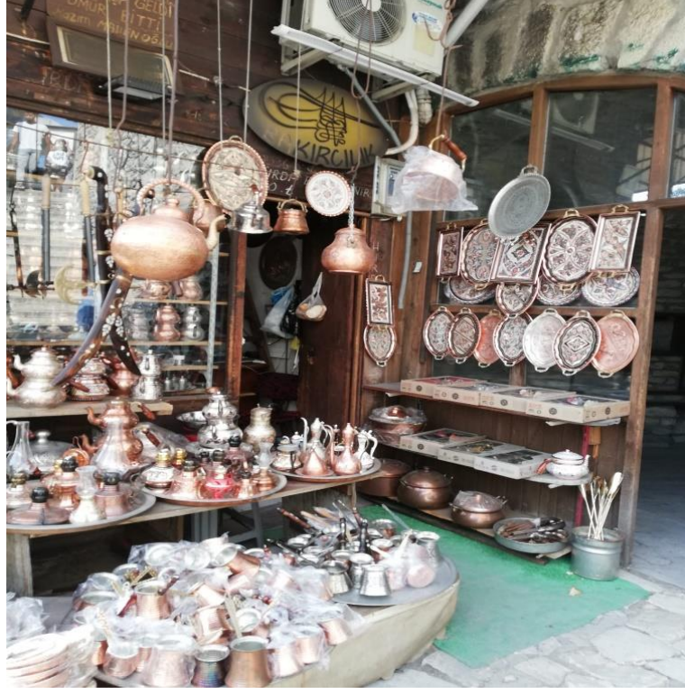
Resim 29: Safranbolu’da Bakır Ürünleri Satılan Dükkân