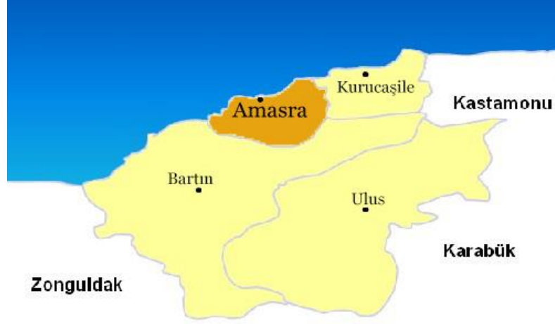
Şekil 2: Amasra'nın Konum Haritası (URL-7 )

Amasra şehri Karadeniz iklimi tesiri altındadır. Amasra'da Karadeniz kıyılarına has her mevsim yağış alan orta kuşak iklimi görülür. Yıllık sıcaklık farkları azdır. Kışları ılık, yazları serin geçer. En yağışlı mevsim sonbahardır. En sıcak ay Ağustos ve en soğuk ay Şubat'tır. Bir senenin 250 günü tamamen parçalı bulutlu veya açık, 115 günü yağışlı ve çok bulutlu geçmektedir. Ortalama bağıl nem oranı % 72,3 tür. Hâkim rüzgâr Poyraz olup, Yıldız, Karayel ve Lodos rüzgârlarına da açıktır. Yaz aylarında deniz suyu sıcaklığı ortalama 20,8 derecedir ( URL-8).