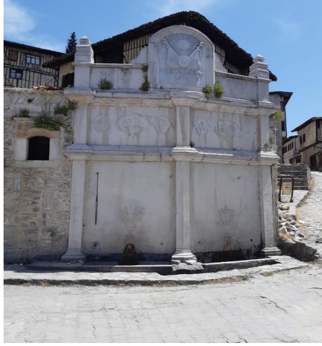
Resim 11: Safranbolu Tarihi eşmelere Bir Örnek

Gastronomik açıdan da yöreye özgü pek çok lezzet bulunmaktadır Safranbolu lokumları, keşkek, bükme, peruhi, su böređi, Safranbolu baklavası gibi yemek türleri de yöreye seyahat unsuru oluşturmaktadır. Kente adını veren ve ekonomik değeri oldukça yüksek olan safran bitkisi baharat, boya hammaddesi, kozmetik ve ilaç sanayinde katkı maddesi olarak kullanılmaktadır. Safranbolu’da genellikle yemeklerde, zerde, aşure tatlılarında ve son dönemlerde lokum imalatında kullanılan safran bitkisi de ziyaretçilerin ilgisini çeken başka bir faktördür (Alp, 2000, s. 6). Geçmişini günümüze taşıyan debbađlık, demircilik, cam üfleme, yemenicilik gibi geleneksel el sanatları da ilçenin önemli kültürel kaynakları arasında bulunmaktadır. Yapılan açıklamalardan yola çıkılarak turizm potansiyeli yüksek Safranbolu kentinde gerçekleştirilen alternatif turizm faaliyetlerine Tablo 3’de yer verilmiştir;