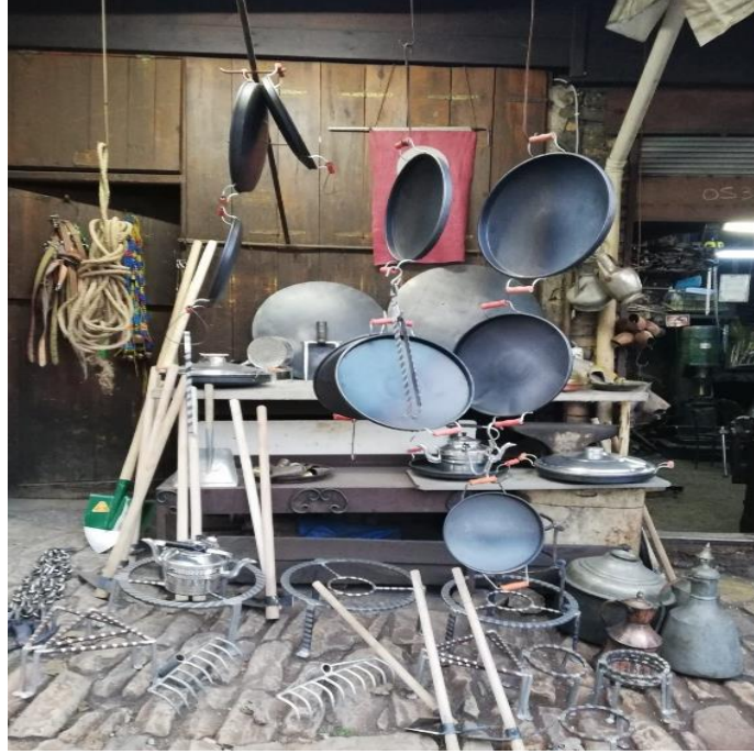
Resim 17: Safranbolu’da Demircilik Sanatıyla Üretilmiş Eşyalar

1924 tarihinde Safranbolu’da demircilik el sanatını icra ettiren kişi sayısı 105 olarak tespit edilmiştir. Bu demirci ustaları sıcak ve soğuk demir üstüne çalışmaktadırlar. Sıcak demirle uğraşan demirci ustalarının özellikle nalburculuk, güllap, saban, burgu, bıçak, pencere ve kapıların tüm demir parçalarını yapma konusunda maharetleri vardır. Bunların dışında çapa, tırmık, diğren, tırpan, kürek, bel gibi günlük yaşamdaki kullanılan pek çok alet yapılarak ve tamir edildiği söylenmektedir. Kendi mesleklerinde kullandıkları eğe dışındaki tüm demir araç gereçleri kendileri yaptıkları bilinmektedir (Acar, 2011, s. 35) (Resim 17). Safranbolu yöresinde demircilikle bağlantılı başka bir geleneksel el sanatı da çilingirciliktir. 1923 tarihinde Safranbolu Ticaret ve Sanayi Odası risalesine göre bu sanatın Sobacılarla beraber 9 kişi tarafından yapıldığı bilinmektedir (Tunçözgür, 2002, s. 30). Mimarisi ile meşhur Safranbolu evlerinin ihtişamlı kapı halka ve tokmakları bu sanat ustaları tarafından yapılmaktadır (Resim 18).