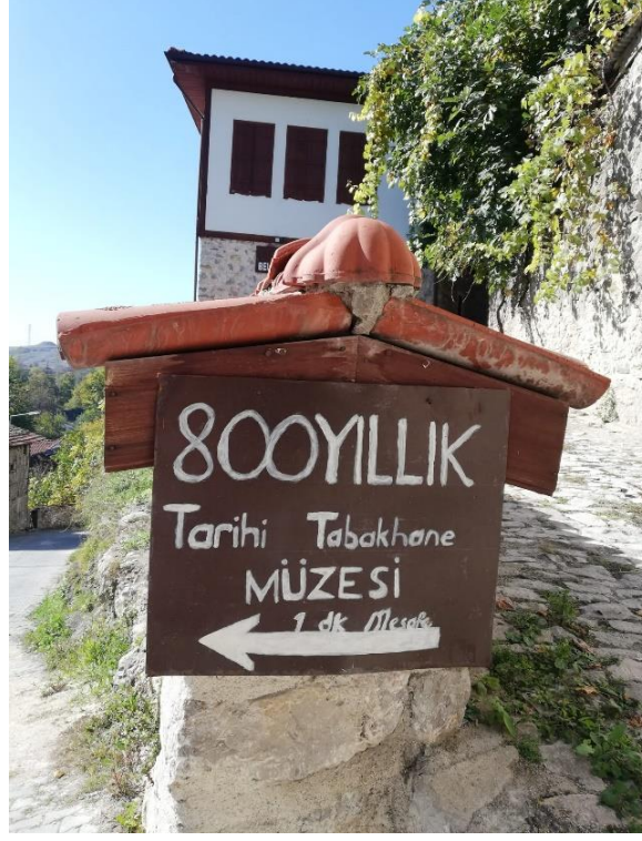
Resim 25: Safranbolu Tabakhane Müzesini Gösteren Tabela

Osmanlı imparatorluğunun son dönemlerinde Anadolu'nun dericilik merkezi olan Safranbolu kenti ile Avrupa devletlerinden özellikle Avusturya ve Fransa deri ticaretinde bulunmuşlardır. Bartın yolu üzerinden bu deriler Avrupa'ya gönderilmiştir. Ancak daha sonraları Avusturya ve Fransa'nın Safranbolu'ya gönderdiği elamanlarla dericilik mesleğinin püf noktalarını öğrenerek kendi ülkelerinde kaliteli deri üretimine başlamışlardır. Bu da Safranbolu'nun deri ticaretinden elde ettiği kazancı düşmesine neden olmuştur (Barlas, 2004, s. 10).