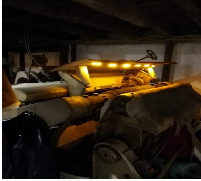
Resim 22: Deri Tabaklamada Kullanılan Makine