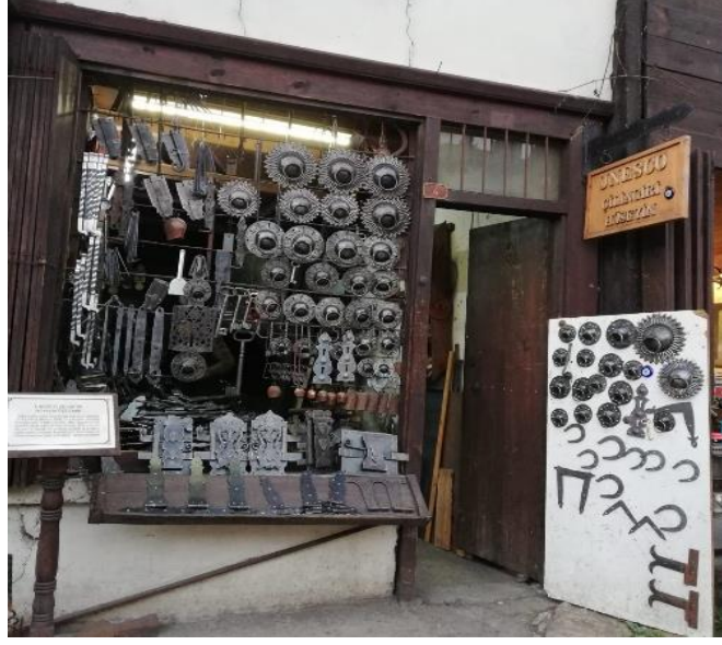
Resim 19: Safranbolu'da Çilingirci Dükkânından Bir Görünüm