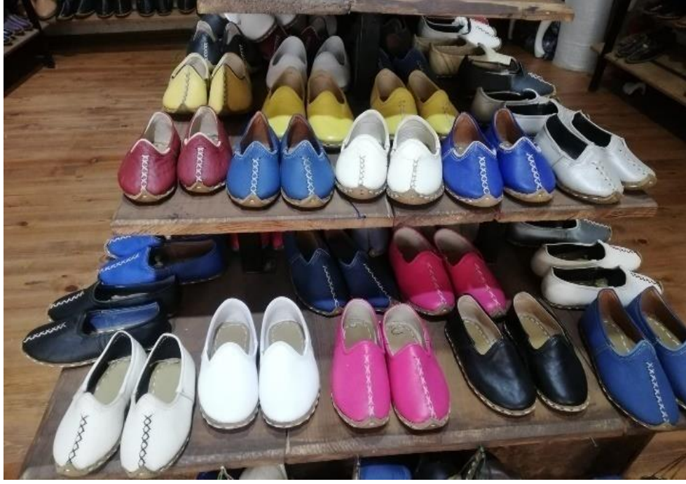
Resim 26: Safranbolu’da Üretilen Yemene Modelleri

yapılırdı. Erkeklerle ait yemenilere sadece tulumbacı şeklinde tek parça kösele ökçe olarak çakılırdı (Barlas, 2004, s. 21).