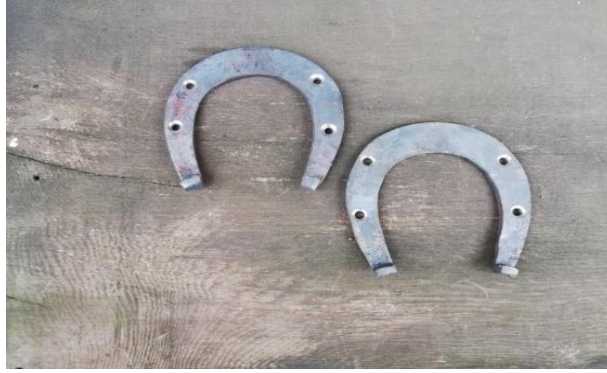
Resim 30: Binek ve Yük Hayvanlarına Takılan Nala Bir Örnek

Nalbant sözcüğü, Arapça “nal” ve Farsça bağlama manasına gelen “bend” kelimelerinin birleşmesiyle ortaya çıkmıştır. Sözcük manası olarak da ata ve ata benzer hayvanlara nal çakan zanaatkâr anlamına gelmektedir (Arslan vd., 2017, s. 232). Geleneksel bir el sanatı olan nalbantlık ise; katır, eşek, at öküz gibi hizmet ve binek hayvanların toynaklarına korumak maksatıyla nal (Resim 30) takma işlemine denilmektedir (Yolcu, 2014, s. 51).