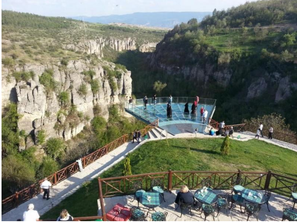
Resim 9: Safranbolu Cam Teras (URL- 5 )