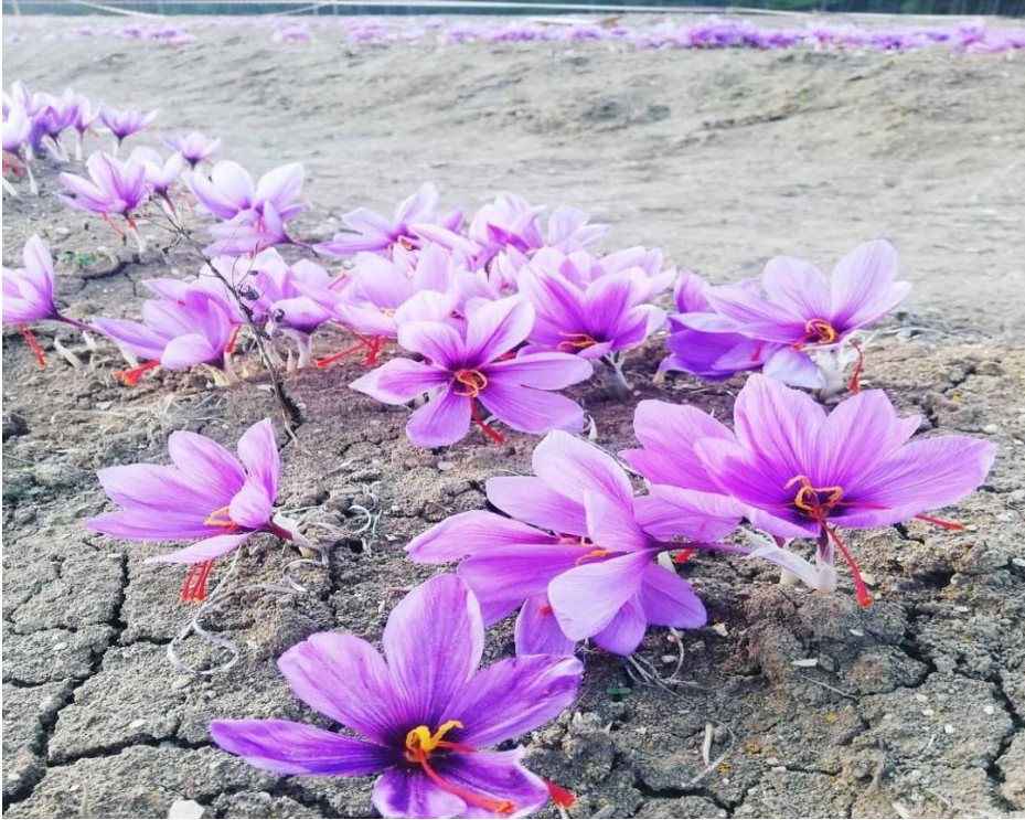
Resim 1: Kente Adını Veren Safran Bitkisi

Geçmişı çok eski devirlere uzanan Safranbolu kentinde ekonomik yaşam tarihi gelişimine paralel olarak iniş çıkış göstermektedir (Çetinkaya, 1998, s. 21). İlçenin ekonomik yapısı diğerkentlerden pek farklı değildir. Yörede insanlar ticaretle ve çeşitli el sanatlarıyla uğraşırken kırsal alanda yerleşenler hayvancılık ve tarımla geçimlerini sürdürmektedirler (Eski, 2018, s. 2). Bölge doğal kaynaklar bakımından hayvancılığa uygun meralarla ve mobilya, inşaat alanında kullanılmaya uygun kereste temin edilebilen ormanlarla örtülüdür. Bölgeyi sulayan Araç Çay'ının; meyve, sebze ve tahıl üretimine etkisiyle Safranbolu önemli tarımsal alanın toplayıcı merkezi olduğu görülmektedir (Tunçözgür, 2012, s. 38-39). Ayrıca boya ve ilaç sanayinin ana maddesi olan safran, kentin ekonomik faaliyetleri arasında yer almaktadır. Endemik bir bitki türü olan safran yetiştiriciliği Safranbolu ve civarında yaygın olarak yapılmaktadır (Resim 1).