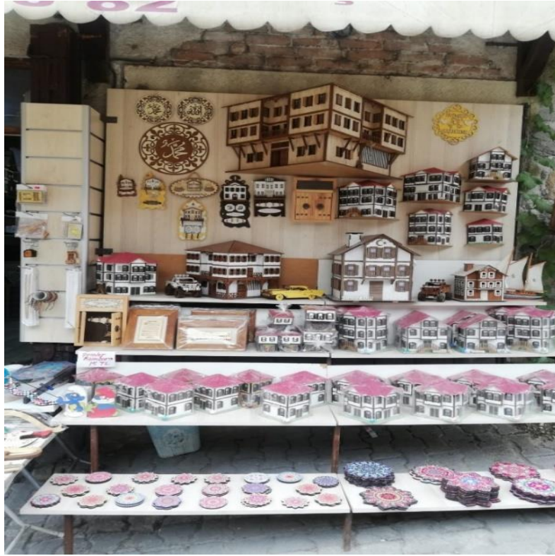
Resim 16: Safranbolu'da Hediyeelik Eşyaların Satıldığı Dükkân