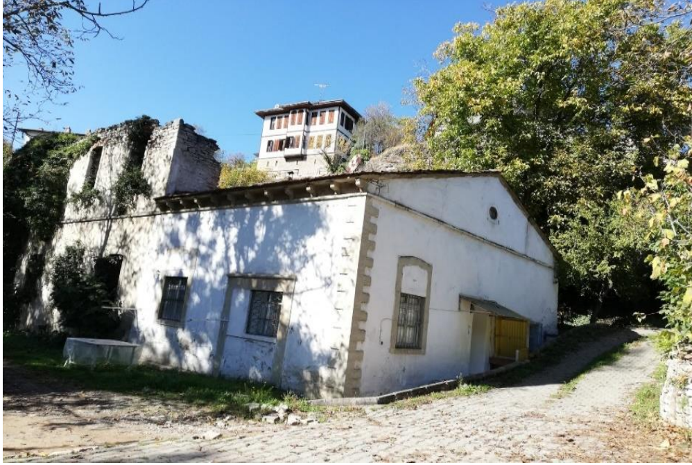
Resim 24: Deri Fabrikasının Şu an ki Görünümü

tabaklama işleminde kullanılan su kaynağı, atık suyun rahat atılabilmesi, görünüm ve pis kokunun kenti etkilememesi bakımından tabaklama için ayrılmıştır (Günay, 1998, s. 100). Bölge kendi arasında aşağı ve yukarı tabakhane olarak iki alana ayrılmaktadır. Tabakhane mescidinin bulunduğu kesim yukarı tabakhane, deri fabrikası (Resim 24) odak kabul edilerek etrafı aşağı tabakhane olarak bilinmektedir (Acar, 2011, s. 49). Safranbolu ve çevresinde 19. asır sonlarında sığır, keçi ve koyun hayvancılığının devam ettiği belirtilmekte ve şehirde bulunan tabakhanelerin sayısı 84 olarak bilinmektedir. Tabakhanelerin ( Resim 25) sayısı yörede dericiliğin önemli bir ticari faaliyet alanı olduğunun kanıtıdır. Safranbolu’da 19. yy. özellikle dericilikle alakalı tabaklama, ayakkabıcılık, dikicilik gibi faaliyetlerin şehir ekonomisine büyük etkisi olduğu, dericilikle alakalı ticari faaliyetlerde kimi ailelerin hayli zenginleştiği söylenmektedir (Tunçözgür, 2012, s. 42).