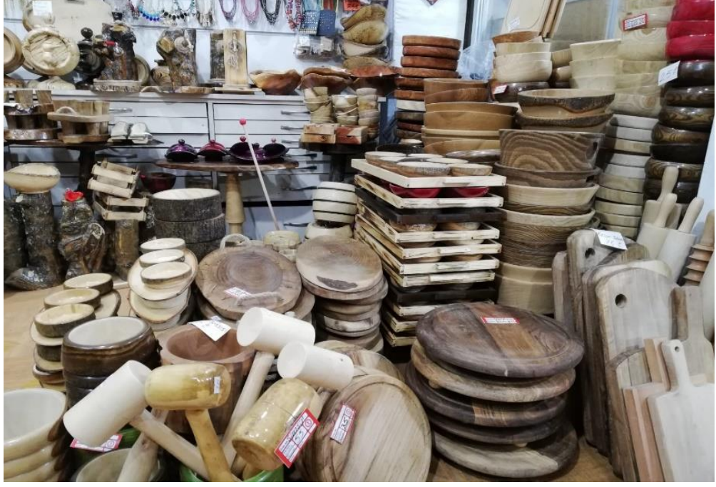
Resim 46: Çekicilik El Sanatına Örnekler