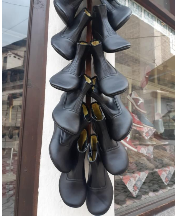
Resim 34: Mest Örnekleri

Mest, üstüne ayakkabı giyilen, kısa konçlu, yumşak ve hafif bir tür deriden üretilen ayakkabı şeklinde tanımlanmaktadır. Mest, ayakkabıcılık terimleri sözlüğünde de “tabanı ve sayası yumuşak keçi derisinden üretilen, kısa konçlu, astarsız, ayakkabı içine giyilen, ayak giysisi” (Resim 34) olarak ifade edilmektedir. Mest isminin ‘mesh’ den geldiği, abdest alırken çıkarmadan üstüne mesh edildiği için halk arasında bu isim verildiği belirtilmektedir. Mest Anadolu’nun farklı bölgelerinde edik, goksak, çeltik gibi değişik isimler de kullanıldığı da söylenmektedir (Özdemir ve Çelik, 2013, s. 136). Mest ayağa, çorap gibi hem erkek hem de kadın tarafından giyilen bir iç ayakkabısıdır. Mestler dış mekânlarda üzerine lastik yemeni, pabuç vb. giyilerek kullanılmaktadır. İç mekânlarda ise üstüne bir şey giyilmeden tek kullanılan bir ayakkabı türüdür. Mestler; özellikle havalar soğduğunda abdest almada kolaylık sağladığı için özellikle ileri yaştaki insanlar tarafından tercih edilmektedir (Akçakale, 2013, s. 3-4).