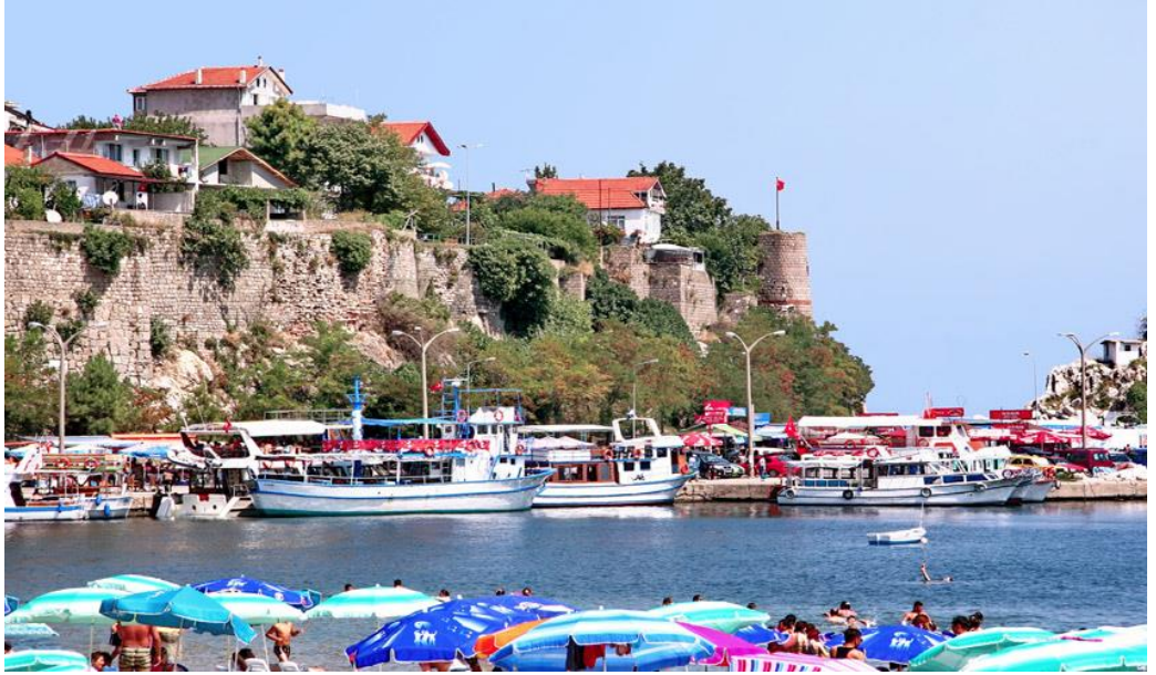
Resim 38: Amasra’da Teknelerin Bulunduğu Alan (URL- 10)