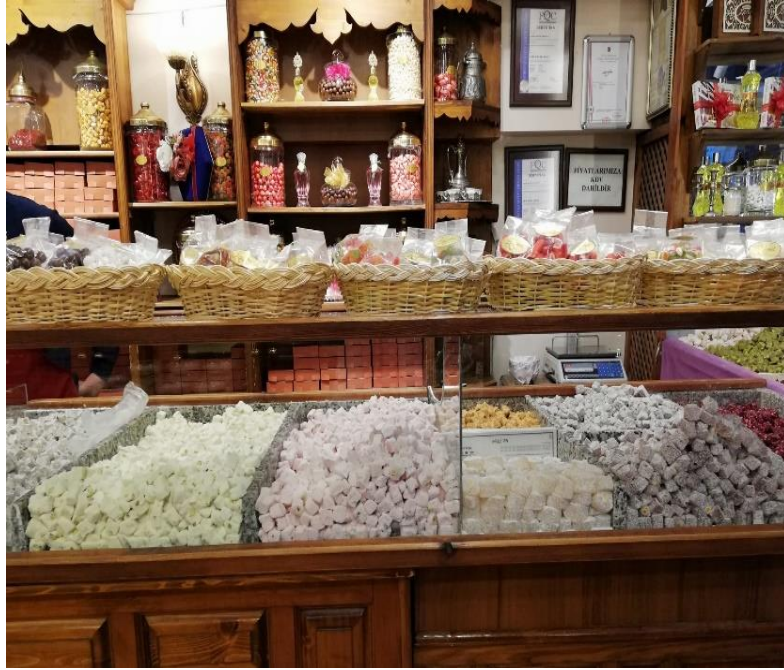
Resim 3: Safranbolu Lokumu

Kentte turizme paralel olarak birçok ekonomik faaliyet gelişme göstermiştir. Bu ekonomik etkinliklerden biride yöreyle özdeşleşen Safranbolu lokumlarıdır. İlk kez ticari anlamada 1920’li, tarihlerde Safranbolu helva ustalarınca üretilmeye başlanmıştır.1939 tarihinde de Karabük Demir Çelik Fabrikalarının kuruluş aşamasında ticari hayat ve ziyaretçi sayısının yükselişiyile yaygınlaşmış, 1940’lı tarihlerde de daha iyi tanınan bir tat haline gelmiştir (Sağ, 2018, s. 20). Her geçen gün çeşitliliği ve tercih edilirligi artan Safranbolu lokumları kentin ekonomisine önemli katkıda bulunan ticari faaliyet alanlarından birini oluşturmaktadır (Resim 3).