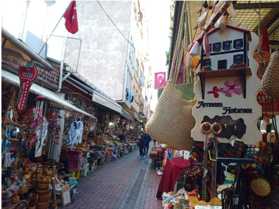
Resim 39: Amasra Çekiciler Sokağından Bir Görünüm

Geçmişten günümüze kadar ulaşan tel kırma, dokuma, giyim kuşam eşyası süsleme gibi geleneksel el sanatları da ilçe ekonomisini canlanmasında büyük rol oynamaktadır. İlçenin farklı bir gelir kaynağı da Amasra halkının yaratıcılığını ortaya koyduğu yöresel el sanatlarından biri olan ahşap el oymacılığıdır. Şehirde eski tarihlerinden bu yana şimşir dallarından sepetler, hasır işleri ahşap oymacılığında da, dışbudak ıhlamur ceviz gibi ağaçlardan hediyelik eşya ve figürler, gemi maketleri yapılarak şehrin merkezinde yer alan çekiciler sokağında yöre esnafını hediyelik eşya bölümlerinde (Resim 39) satışa sunulmaktadır ( Sarı, 2001, s. 67).