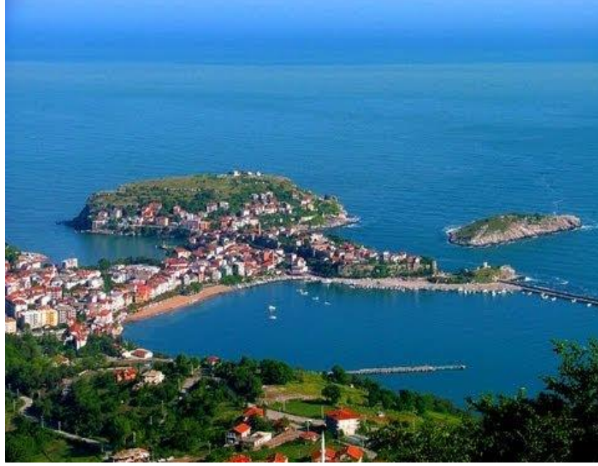
Resim 40: Amasra Kentinden Bir Görünüm (URL-11)

Amasra kenti ve dolayları orman ve orman ürünleri bakımından oldukça zengindir. Kent orman ürünlerinin işlendiği ve ticaretinin yapıldığı bir merkez konumundadır. Kültürel ve sosyal yaşam bakımından deniz, yoğun orman örtüsü, denizcilik, balık, ticaret bölge halkının yaşamında ve folklorunda önemli bir yer oluşturmaktadır (Davulcu, 2015, s. 96). Tarih boyunca Amasra halkının yaşam tarzı bu faktörler etrafında gelişmiştir. Denizcilik, bölge de turizmi geliştirmiş ve buna bağlı olarak halkın sosyal ve kültürel hayatında değişiklikler yaşanmıştır. Kentte turizmle beraber pek çok sektör ortaya çıkmıştır. Ev pansiyonculuğu, aile işletmeciliği, restoran ve kafeler, hediyelik eşya, eğlence gibi birçok sektörü hareketlendirmiş ve halkın refah düzeyini artırmıştır. Buna paralel olarak eğitim seviyesi yükselmiştir. Bartın üniversitesinin açılması ve turizmle beraber iş olanaklarının artmasıyla Amasra'da var olan göç olayı azalmıştır. Kentte düzenlenen çeşitli festival eğlence ve konser gibi etkinliklerle kentin tüm yıl boyunca turist yoğunluğu artırılmaya çalışılmıştır.