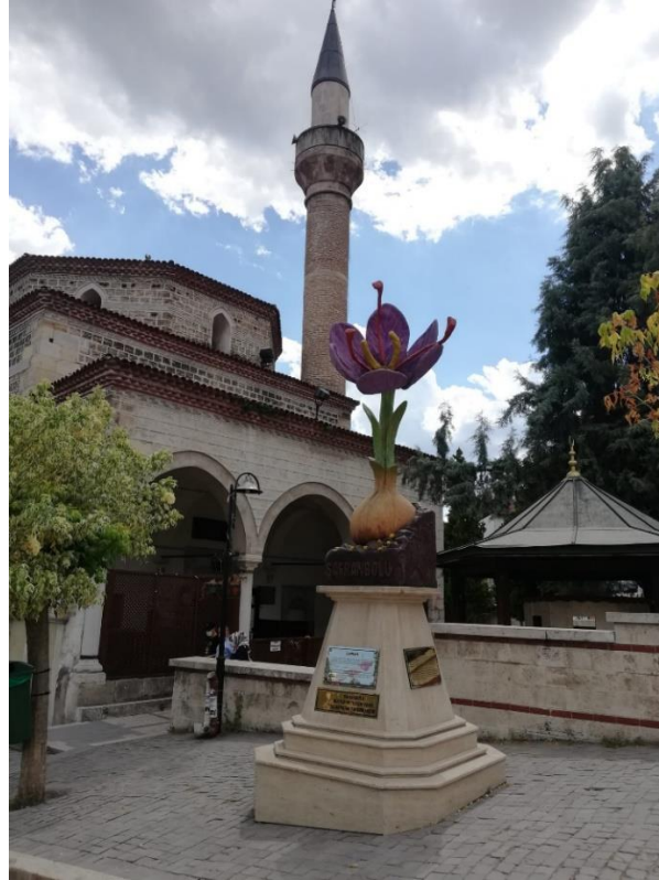
Resim 10: Kazdağlı Cami