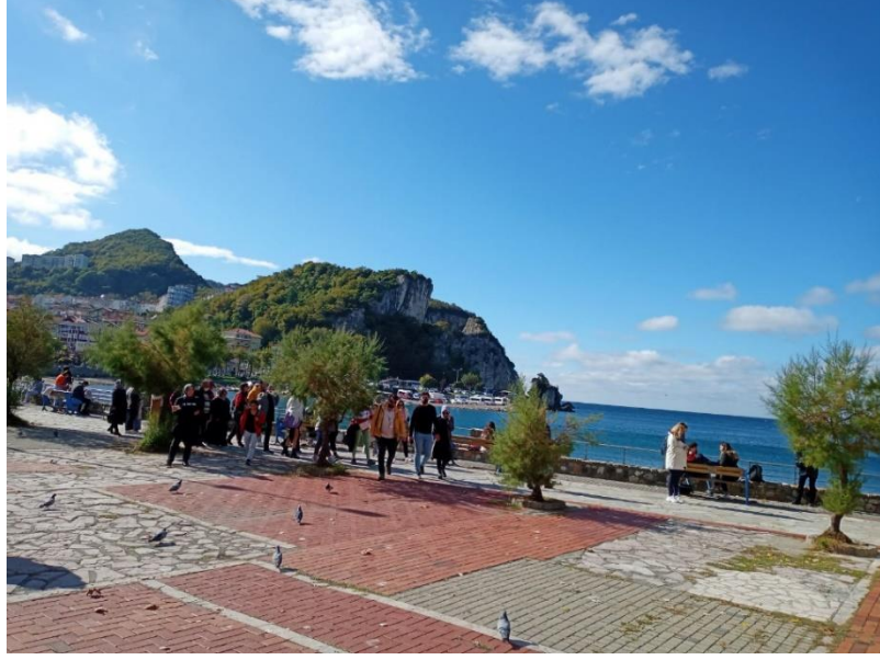
Resim 42: Amasra Turist Noktalarından Bir Görünüm

uzaklaşarak doğa ile iç içe zaman geçirebildikleri özel yerleşim yerlerinden biridir (Resim 42)