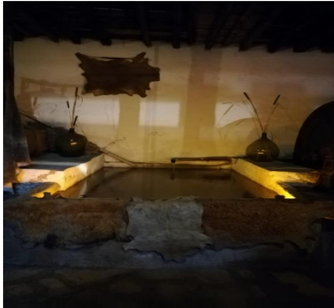
Resim 23: Deri Tabaklamada Kullanılan Havuz

Anadolu'da, dericiliğin merkezi olan Safranbolu'da, deri işlemeciliğinin odağı tabakhanedir ve dere boyunca vadi içerisinde bulunur. Safranbolu çarşısından geçen Gümüş deresi ve Akçasu Deresi'nin birleştiği dere yatağının genişlediği alana denilmektedir (Acar, 2011, s. 49). Tabakhane deresi hem doğal yapısı, hem de