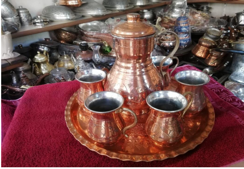
Resim 28: Bakırdan Yapılmış Günlük Kullanım Eşyası

ile meşgul ustalar “kalaycı” olarak isimlendirilmiştir (Subaşı ve Kalay, 2016, s. 261-262). Bakırdan üretilen ürünler kalaylama gerektirdiği için yaygın olarak bakırcı esnafının yanında kalaycılar yer alırdı.