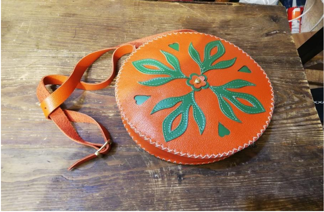
Resim 21: Deri Malzemedен Üretilmiş Bir Örnek

da; Mezopotamya ve Mısır medeniyetlerine karşıt deri işlemeciliği ilk çağa kadar uzanan bir tarihe sahiptir. Anadolu da yaşayan farklı uygarlıklar tarih boyu öldürülmüş hayvanların derisini yüzmüşler, üst ve ayak giyiminde, aksesuar (Resim 21), müzik aleti, hayvan koşu takımı, ev aletleri vb. pek çok alanda kullanmışlardır. 1071 tarihinde Anadolu'yu vatan olarak kabul eden Türkler de orta Asya'dan bu yana deri işleme sanatını bilmektedirler (Acar, 2011, s. 49).