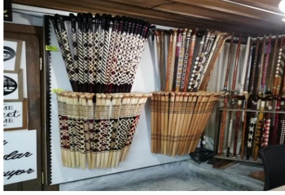
Resim 36: Safranbolu' da İmal Edilen Baston Örnekleri