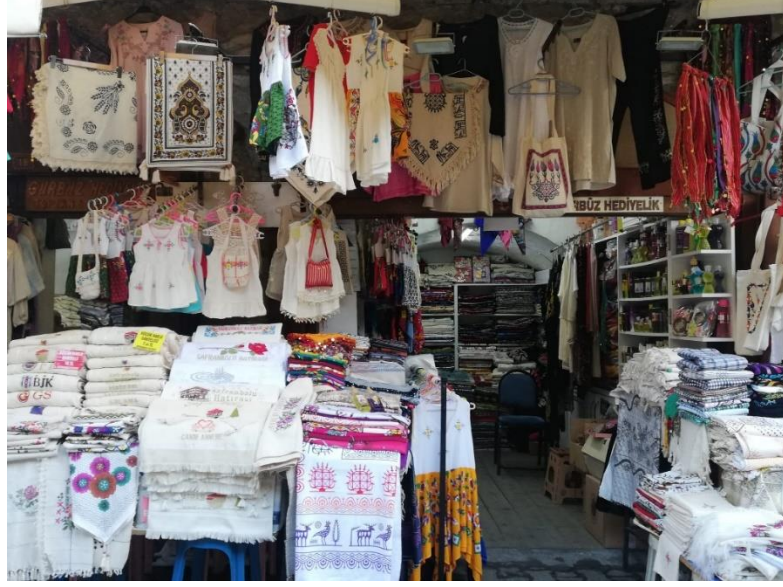
Resim 15: Safranbolu El İşlemelerinin Satıldığı Dükkân