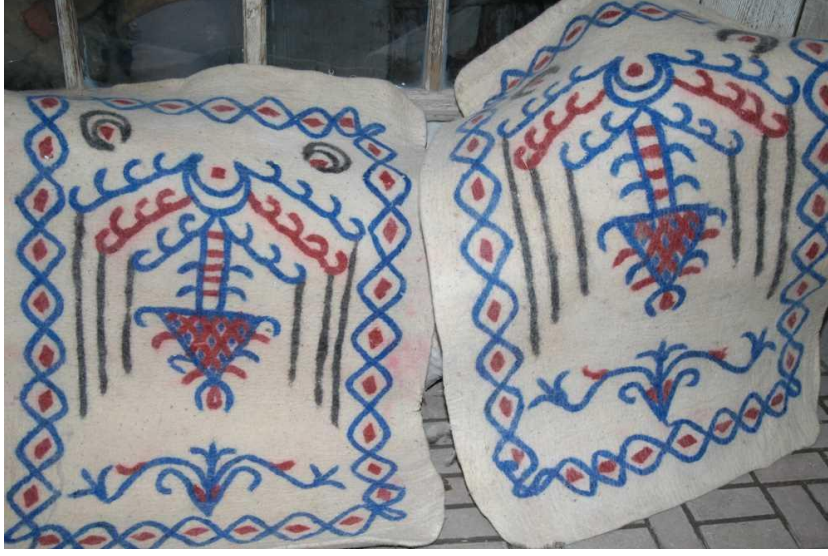
Resim 35: Keçecilik Sanatına Bir Örnek