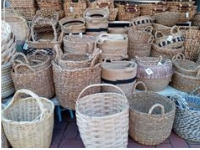
Resim 51: Sepet Örucülüğüne Örnekler