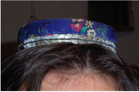
: Pullu Őapka