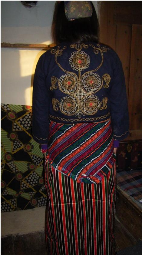
: Üç etek (şapkası ve bel kuşağı ile)