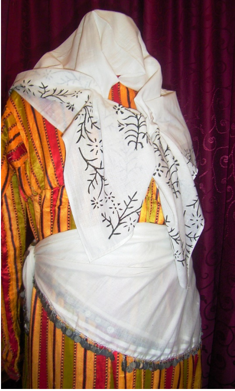
: Gündelik kıyafet (yazması ve bel kuşağı ile)