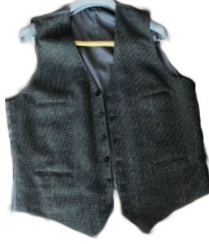
: Erkek yeleđi