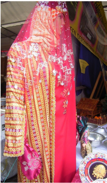
: Kına elbisesi