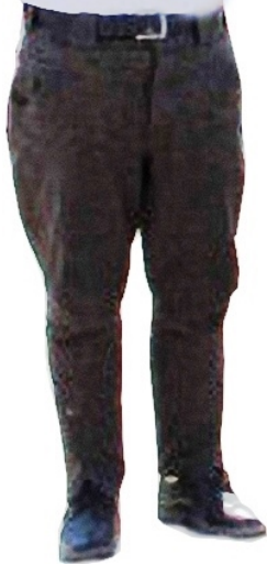
: Erkek pantolonu