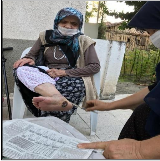
Fotoğraf 29. Ocaklı bıçağı yaranın üzerine sürmesi ve çizikler atıyor gibi yapması