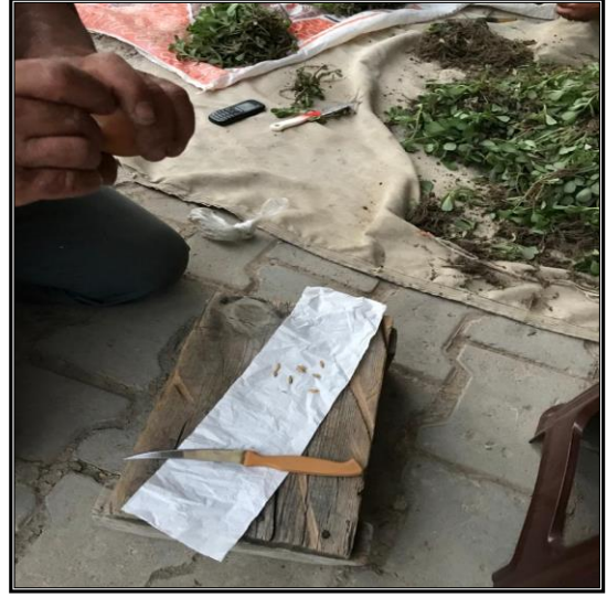
Fotoğraf 12. Ocaklı Nazar Duası okunan arpaları yumurtanın içine atması