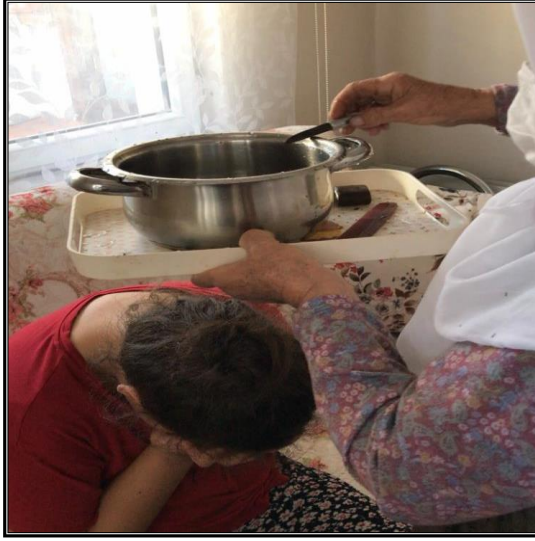
Fotoğraf 41. Ocaklı bıçağı üçgen oluşturacak şekilde üç kez tepsiye vurur ve suyu keser