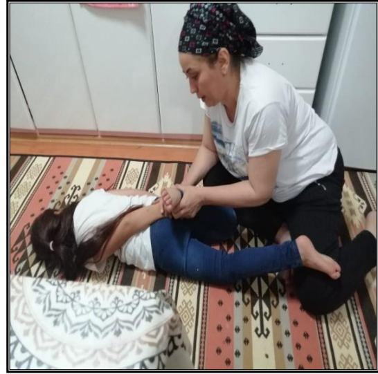
Fotoğraf 7. Sol kol ve sağ bacak batma olup olmadığının tespit edilmesi