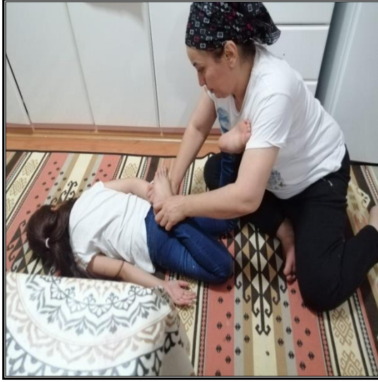
Fotoğraf 8. Sağ kol ve sol bacak batma olup olmadığının tespit edilmesi