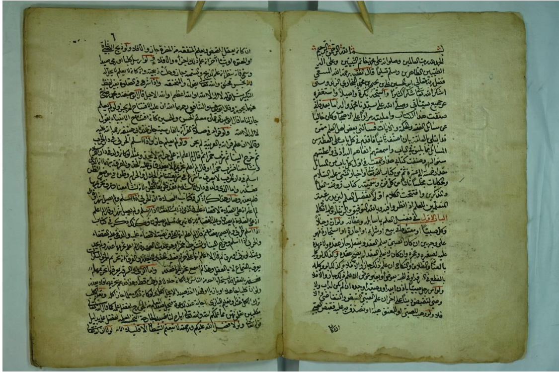
Ek-1. Uyûn es-Sûd bi'ş-Şam Kütüphanesinde bulunan nüshanın bir varacağı 44