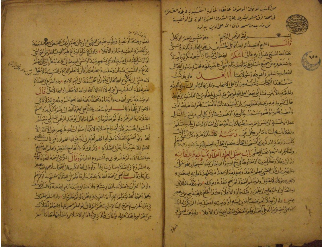
Ek-3. Kastamonu İl Halk Kütüphanesi 'nde bulunan nüshanın bir varacağı 46

Ek-3.te geçen nüsha Zendevestî'nin, Ravzatü'l-'Ulemâ' ve Nüzhetü'l-Fudalâ' eserinin Kastamonu İl Halk Kütüphanesi'nde bulunan nüshasıdır. Bu nüsha yüz atmış beş varaktan oluşmaktadır. Toplamda kırk baktan oluşan Kastamonu İl Halk Kütüphanesi'nde bulunan nüsha Erzurum İl Halk Kütüphanesinde bulunan nüshanın ilk kırk babı ile karşılaştırıldığında, Kastamonu İl Halk Kütüphanesi'nde bulunan nüshanın on üç ve on dördüncü babı ile yirmi ikinci babından otuz birinci babına kadar olan kısım eksiktir. Kastamonu İl Halk Kütüphanesi'nde bulunan nüsha, Erzurum İl Halk Kütüphanesinde bulunan nüshanın ilk üç babı ile aynı olup dördüncü bab olarak Erzurum nüshasında bulunmayan Âlimin kullanması gereken şeyler ve sonra onu başkasına öğretme babı vardır. Kastamonu İl Halk Kütüphanesinde bulunan nüshanın otuz iki ve otuz üçüncü bablarında bulunan Namazda Tilavet Secdesinin Fazileti Babı Erzurum İl Halk Kütüphanesinde bulunan nüshada bulunmamaktadır. Erzurum İl Halk Kütüphanesinde bulunan nüshanın yirmi birinci babı cehennemden kurtuluş babı ile otuz