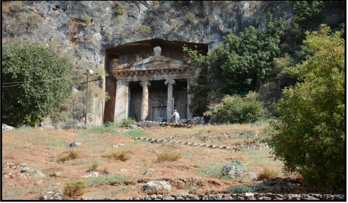
Şekil 13: Amintas Kaya Mezarlarına Ait Bir Görsel