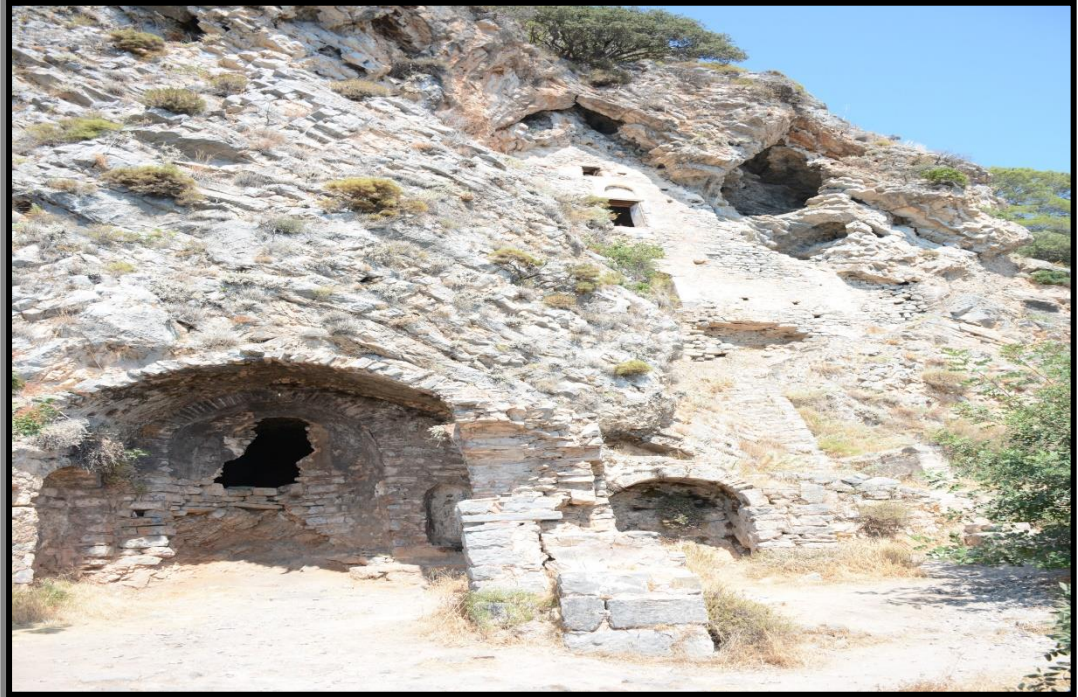
Şekil 12: Afkule Manastırına Ait Bir Görsel

Afkule Manastırı sahip olduđu rivayet ve geçmiş dönem ritüelleri hakkındaki bilgiler ışığında kısmen din turizmi ve kültür turizmi açısından değerlendirile bilecek alanlardan biridir. Ayrıca manastırın konumu ve yapım şekli itibarı ile doğa yürüyüşleri, tırmanış, dađcılık gibi doğa sporlarına uygun olması ve tabiatın içinde bulunmasından dolayı farklı turist tiplerine uygundur.