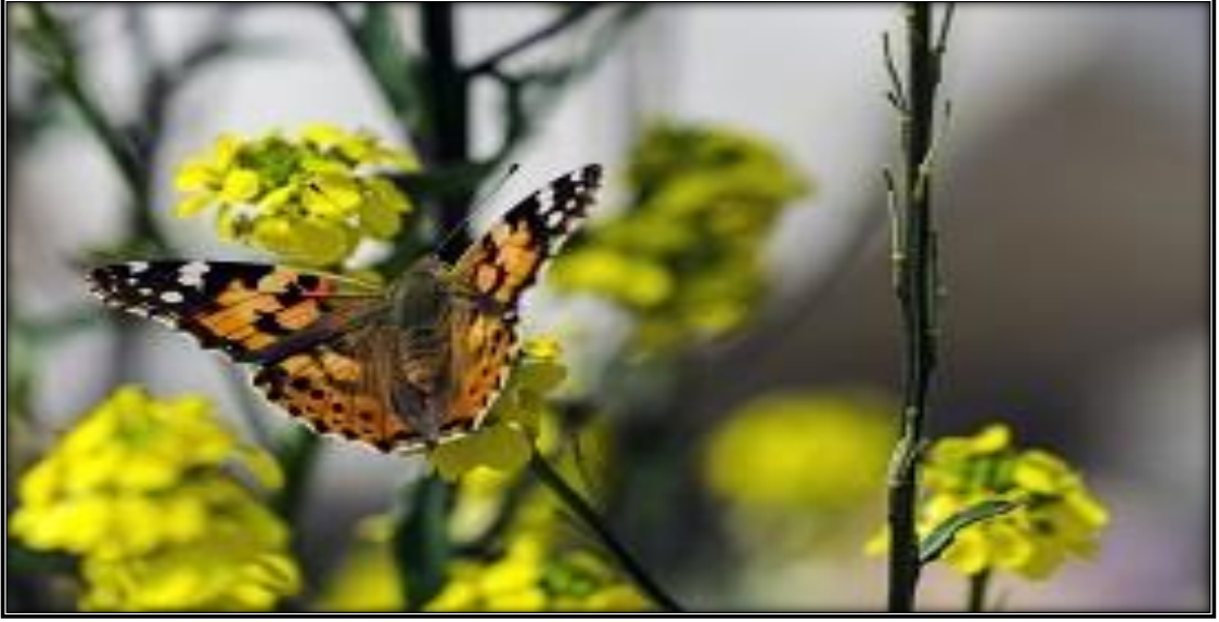
Şekil 10: Kaplan Kelebeğine Ait Bir Görsel

Kaynak: (Muğla İl Kültür ve Turizm Müdürlüğü, 2021a)