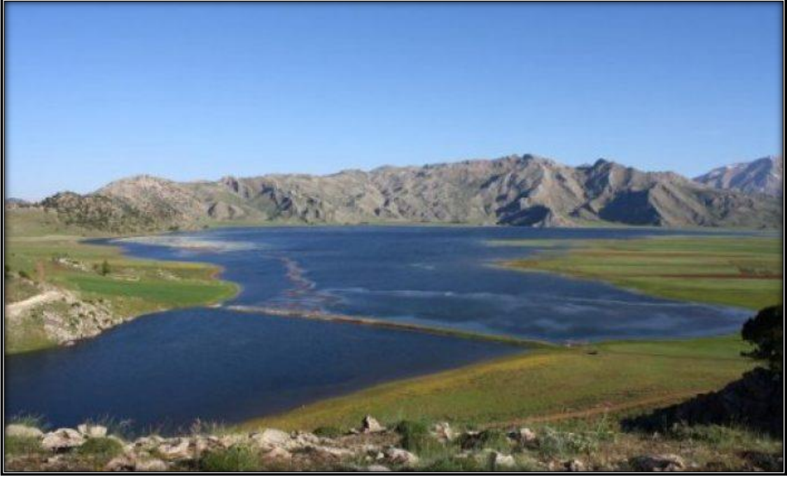
Şekil 8: Girdev Gölü ve Yaylası'na Ait Bir Görsel