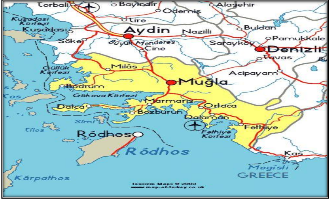
Şekil 2: Fethiye ve Çevre İller Göstergesi

Fethiye ilçesi kendi gibi Türkiye'nin önemli turizm merkezlerinden olan, Marmaris'e 136 km, Muğla'ya 137 km, Bodrum'a 241 km, Antalya'ya 210 km ve İzmir'e 376 km uzaklıktadır (Güner, 2002, s. 2). Doğusunda Seydikemer ilçesi, kuzeybatı bölgesinde dalaman ilçesi, kuzeyinde Denizli ili ve güneyinde tüm güzelliği ile Akdeniz bulunmaktadır (Muğla Kültür ve Turizm Müdürlüğü, 2021a).