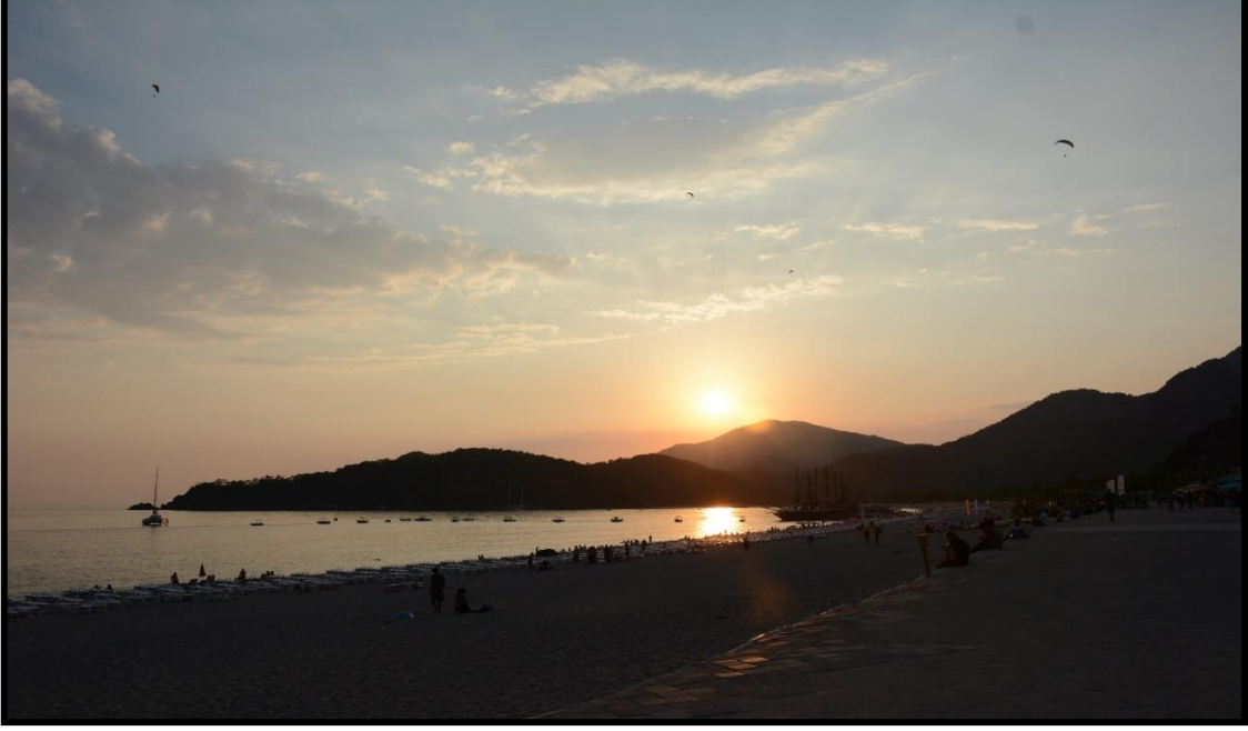
Şekil 5: Belcekız’a Ait Bir Görsel

Aşağıdaki görselde Belcekız’ait görsel yer almaktadır.