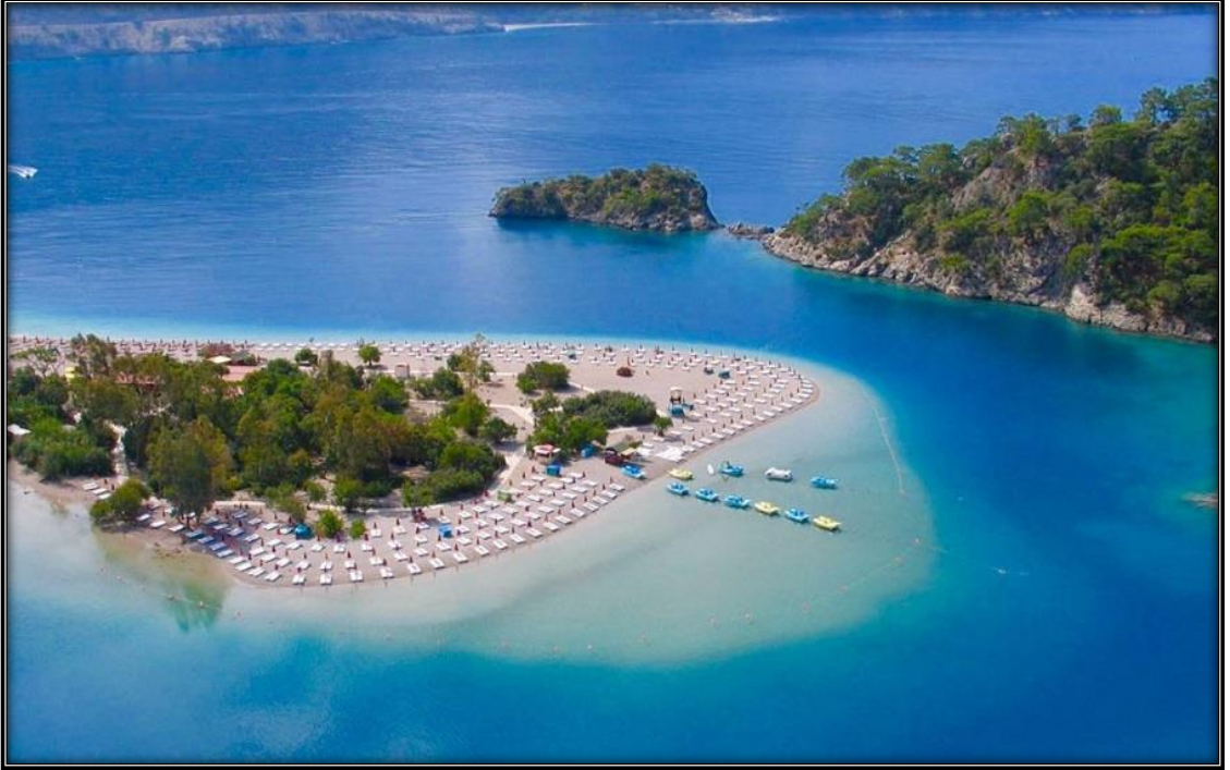
Şekil 11: Ölüdeniz'e Ait Bir Görsel

yanında en çok yamaç paraşütü için tercih edilmektedir. Babadağ eteklerinden atlayarak başlanan ve Ölüdeniz üstünde devam eden yamaç paraşütü turistlere heyecan yanında muazzam bir manzara sunmaktadır. Ölüdenizde yapılan ve oldukça ilgi gören bir diğer aktivite ise Dalaman Çayı kollarında yapılan raftingdir. Heyecan verici olan ve ekstrem sporlara girerek spor turizmine katkı sağlayan bu aktivitelerin yanında Dünyanın en iyi yürüyüş parkuru sayılan Likya Yolu'da Ölüdenizden başlamaktadır. Bu yolda her yıl yapılan trekking faaliyetleride spor turizmi açısından değerlendirilmektedir. Ayrıca Kelebekler Vadisi, Kabak Koyu, Faralya ve Belcekız'da Ölüdeniz çevresinde olduğundan doğa ve kültür turizmi açısından oldukça önemlidir (Gezimanya, 2021). Aşağıdaki görselde Ölüdeniz'e ait bir görsel yer almaktadır.