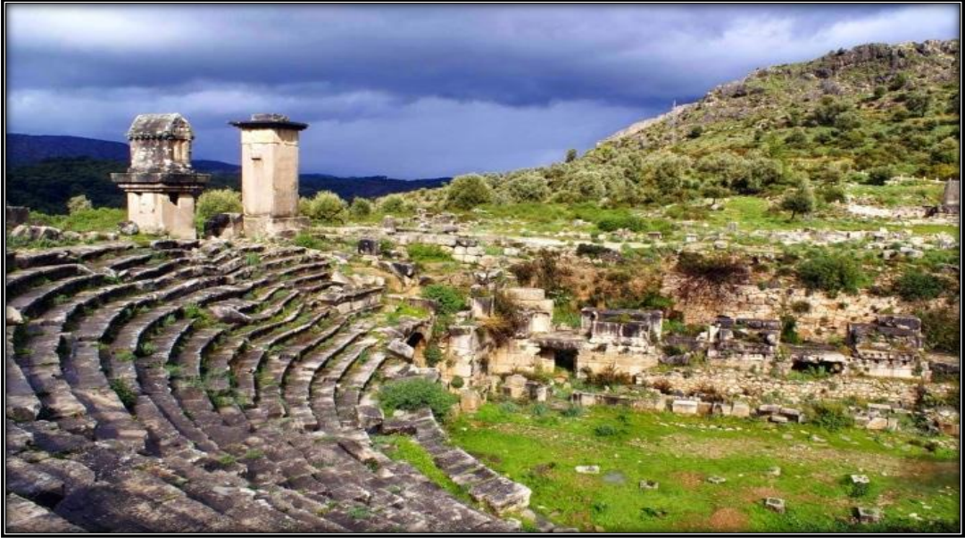
Şekil 15: Letoon Antik Kentine Ait Bir Görsel

Aşağıda Letoon Antik Kentine ait bir görsel bulunmaktadır.