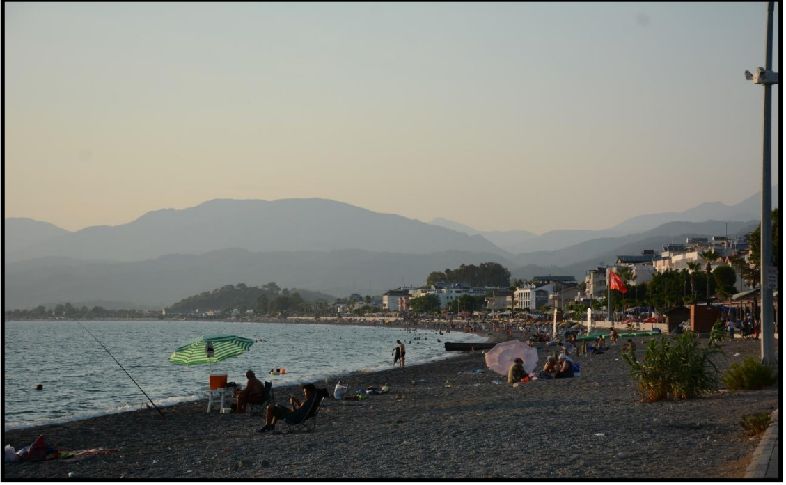
Şekil 6: Çalış Plajına Ait Bir Görsel

plajın birden fazla turizm çeşidini içinde barındırmasını sağlamaktadır. Aşağıda Çalış Plajına ait görsel yer almaktadır.