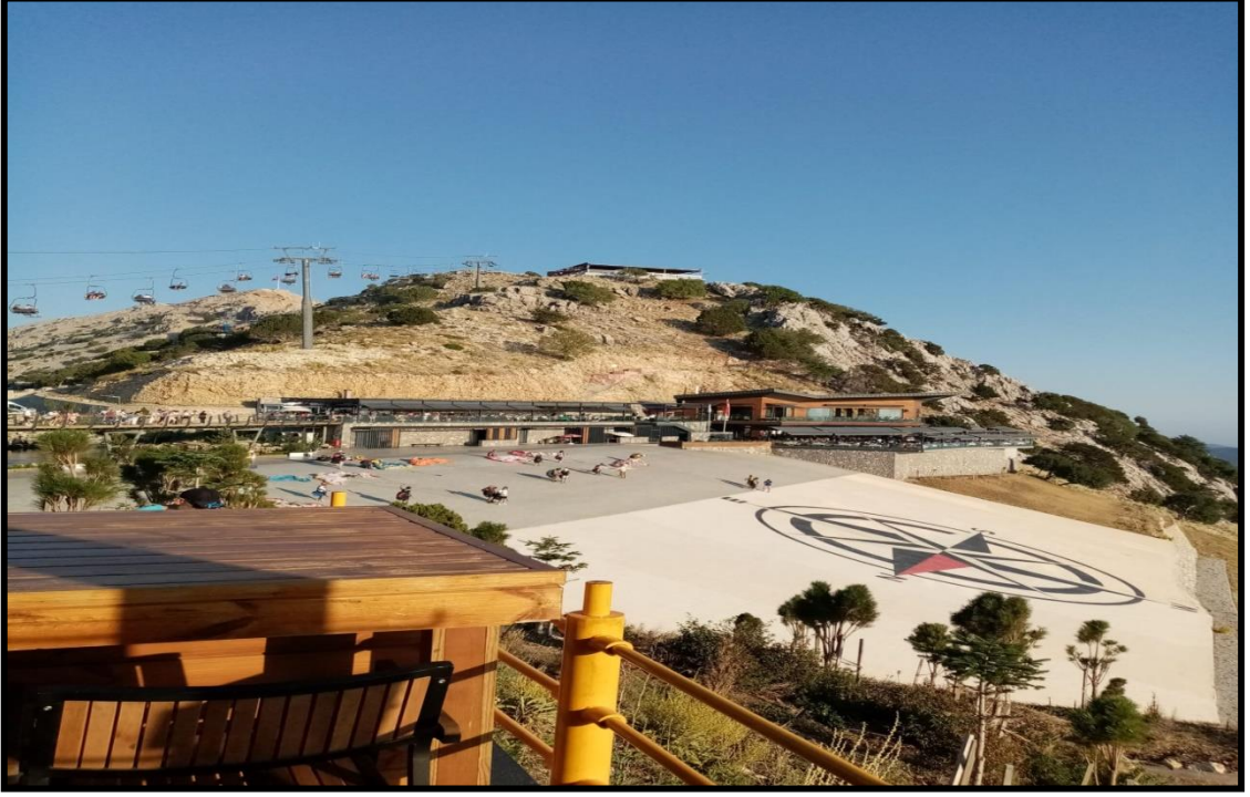
Şekil 4: Babadağ'a Ait Bir Görsel

hayvan çeşitliliği ile eko turizm açısından önemlidir. Tarihi Likya medeniyetine ev sahipliği yapması ile son yıllarda düzenlenen tarihi Likya yürüyüş yolları ile popüleritesi artmıştır. Babadağ eteklerinde kurulan Hisarönü ve Ovacık beldeleri yapısı ile turizm açısından turistik belde özelliği taşımaktadırlar (Davras ve Uslu, 2019, s. 698). Aşağıda Babadağ'a ait olan görselde yamaç paraşütü yapan turistlere ve yamaç paraşütü etkinlikleri için hazırlanmış olan alan gösterilmektedir.