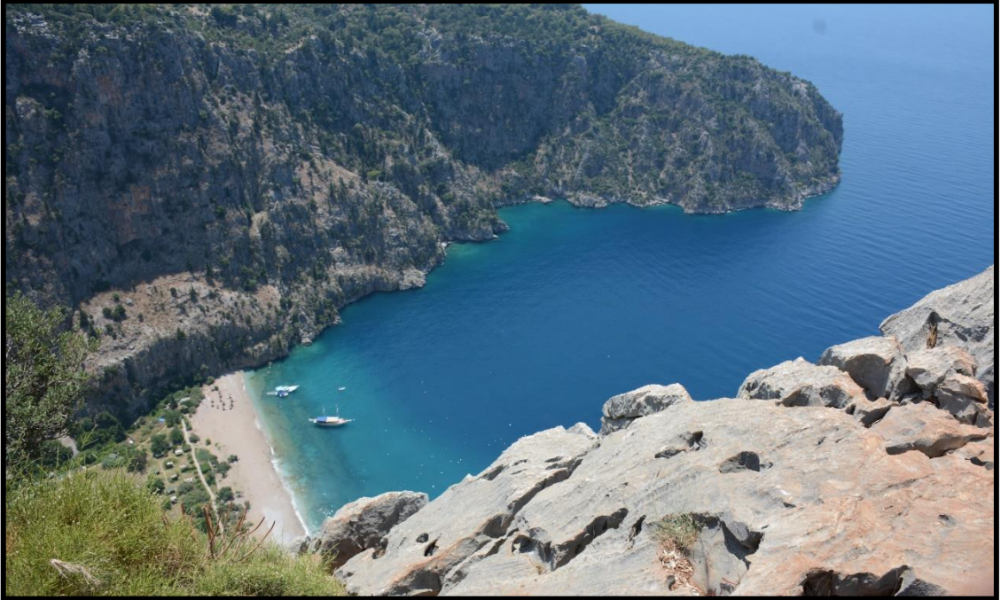
Şekil 9: Kelebekler Vadisine Ait Bir Görsel

Aşağıda Kelebekler Vadisine ait iki adet görsel bulunmaktadır Birinci görselde sahip olduğu manzara yer alırken ikinci görselde ise sahip olduğu kelebek çeşitlerinden olan ve alana özgü olan Kaplan Kelebeği yer almaktadır.