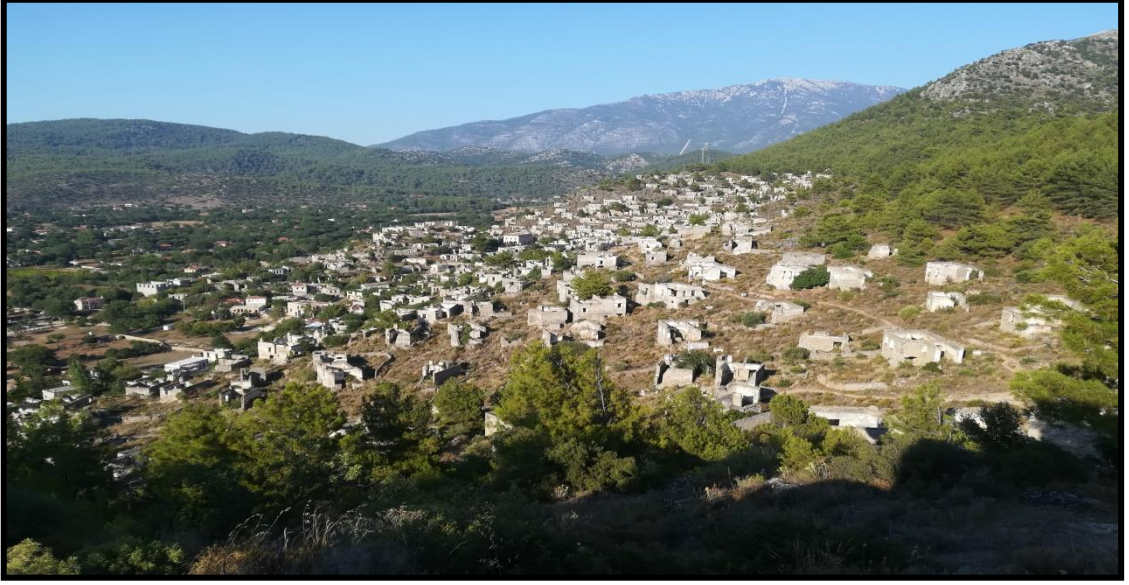
Şekil 14: Kayaköy'e Ait Bir Görsel

Kayaköy’de bulunan anıtlar, lahitler ve kaya mezarlar bölgenin geçmişine ışık tutmaktadır. Köyün mimari açıdan önemi oldukça fazladır. Eski olan bu yapılar yapılırken ışık ve manzara açısından birbirini kapatmayacak ve engellemeyecek şekilde yapılan 350-400 civarında ev bulunmaktadır. Ayrıca köyde şapeller, iki adet kilise, okul binası ve bir adet gümrük binası bulunmaktadır (Muğla İl Kültür ve Turizm Müdürlüğü, 2021c). Aşağıda Kayaköy’ün geniş açılı olarak çekilmiş bir görseli bulunmaktadır.