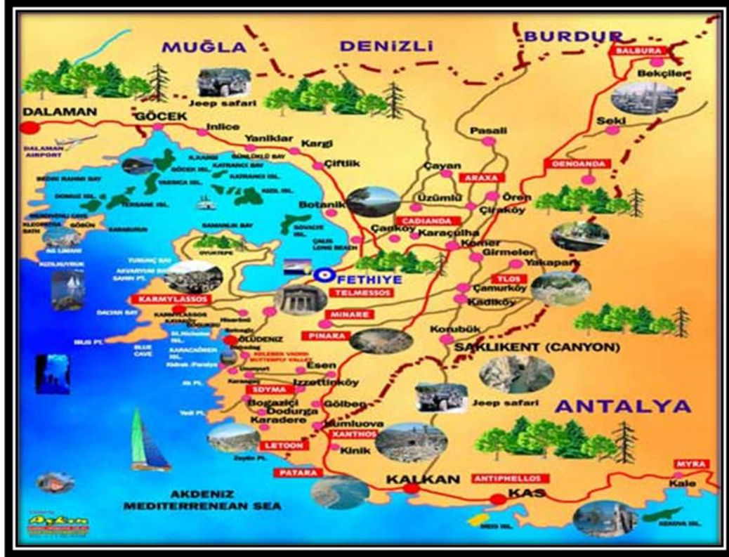
Şekil 3: Fethiye İli Turistik Alanlara Ait Görsel