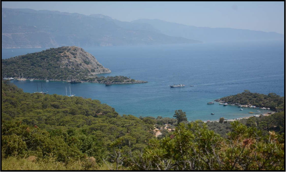
Şekil 7: Gemiler Adasına Ait Bir Görsel

Gemiler Adası bünyesinde birçok farklı turizm çeşidini bir arada bulundurabilme özelliğine sahiptir. Bu özelliği ile birlikte var olan önemi artmaktadır ve turizm sektörü açısından oldukça değerli bir hale gelmektedir. Tarihi özelliği ile özellikler Hristiyanlık açısından dini turizmin uygulanabileceği bu ada dünyanın önemli dini turizm merkezlerinden biri olma potansiyeli taşımaktadır. Bir ada olmasından dolayı ve yakınlarında koylarında bulunmasından dolayı yat turizmi açısından önemli bir merkez olabilme özelliği bulunmaktadır. Adanın doğal özellikleri adaya eko turizm kapsamında turizm seyahatlerin yapılmasına olanak sağlarken aynı zamanda tüm insanlık için kültür turizminin önemli merkezlerinden biri olma özelliği vardır. Ayrıca ada çevresinde her türlü su altı ve su üstü faaliyetlerin yapılabilmesine uygun bir deniz yapısının olmasından dolayı spor turizmine ve su altı turizmine uygundur.