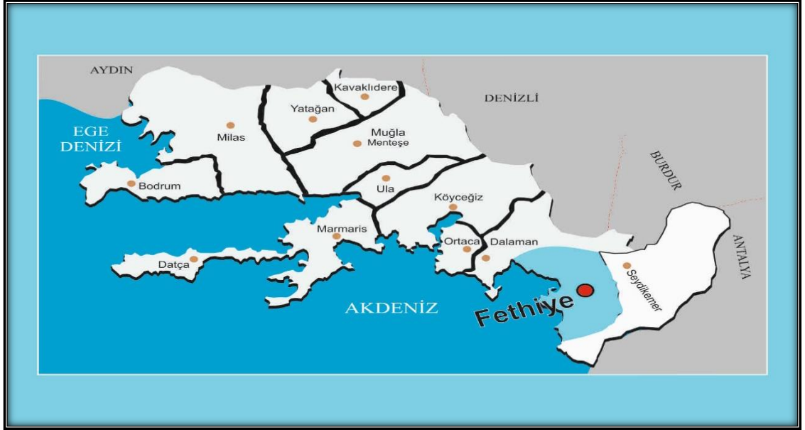
Şekil 1: Fethiye İlçesi Lokasyonu

Fethiye Türkiye'nin güneybatısında bulunan Muğla ilçesinin en büyük ve kalabalık ilçesidir (bkz. Şekil 1). İlçenin ilk kuruluş tarihi net olarak bilinmemekle beraber milattan önce 5. yüzyıla kadar uzandığı tahmin edilmektedir. Fethiye konum u ve doğal güzellikleri ile bir turizm cenneti olmasının yanında tarih boyunca önemli medeniyetlere ev sahipliği yapmasından dolayı bir aç hava kültür merkezi konumundadır.