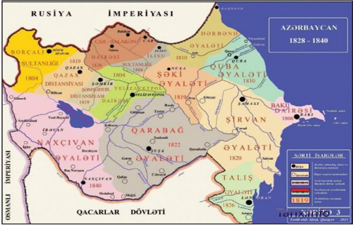
Görsel 2: 1828-1840 Arasında Kuzey Azerbaycan Topraklarında Hanlıklar Dönemi

( http://tarix.info/kitabxana/prezentasiyalar/1755-hazirladigim-teqdimat.html )