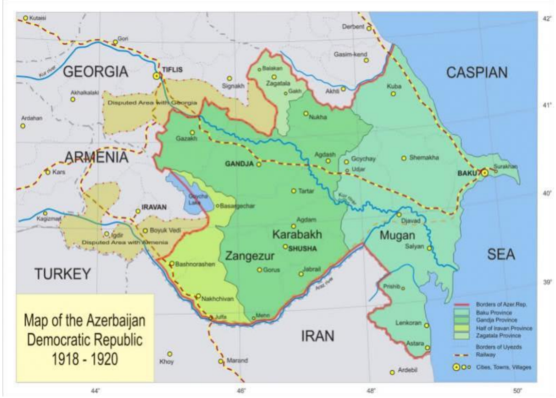
Görsel 7: Azerbaycan Halk Cumhuriyeti (1918-1920)

( https://www.virtualkarabakh.az/tr/post-item/22/35/karabag-azerbaycan-halk-cumhuriyeti-doneminde.html )