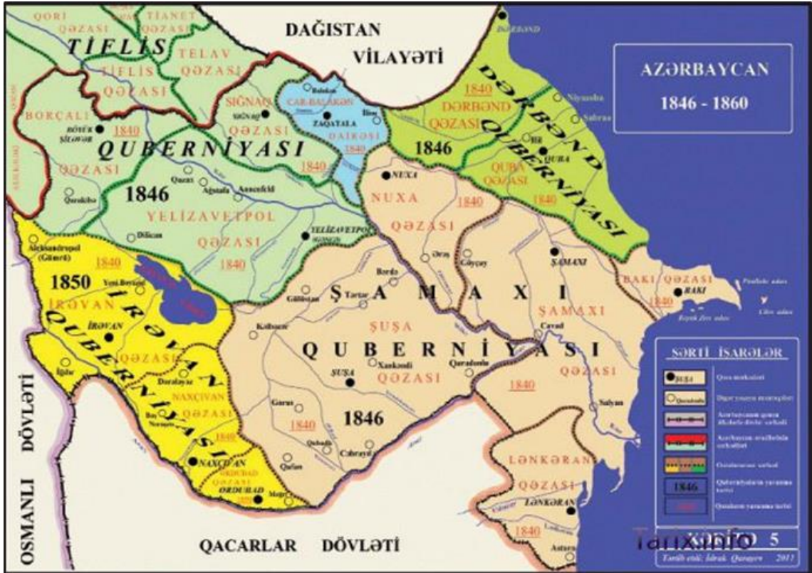
Görsel 4: 1846-1860 Yılları Arasında Kuzey Azerbaycan Toprakları

İrevan Guberniyası şeklinde ikiye ayrılmıştır (Görsel 4). Bu zamandan başlayarak Azerbaycan topraklarında devamlı olarak yönetim değişiklikleri yaşanmıştır. Bundaki gaye ise bölgede yaşayan Türk nüfusu dağıtmak ve İslamiyet'in yayılmasının önüne geçmektir. Bu yüzden Türkler durmadan göçe zorlanmış ve Türkler göç ettikten sonra yaşadıkları topraklara Ermeniler ve Gürcüler yerleştirilmiştir. Çarlık Rusya izlediği nüfus politikasıyla Türkleri, Ermeniler ve Gürcüler karşısında aciz bir konuma düşürmeyi amaçlamıştır. Bu durum bilhassa Azerbaycan Türkleri arasında karşılık bulmuştur. 20