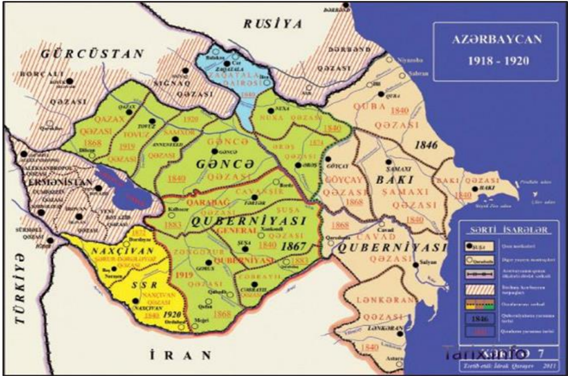
Görsel 6: 1918-1920 Yılları Arasında Kuzey Azerbaycan Toprakları

Çarlık Rusya'nın 1860 yılında yaptığı idari değişiklik 1918 senesine değin mevcudiyetini korumuştur. Çarlık Rusya, I. Dünya Savaşı'nın ardından sancılı bir döneme girmiş ve bölge topraklarını tekrar düzenlemiştir. Yelizavetpol Guberniyası'nın adı Gence Guberniyası olarak değiştirilmiş, Tiflis ve İrevan Guberniyaları ortadan kaldırılarak toprakları üzerinde Gürcistan, Ermenistan ve Nahcivan Sovyet Sosyalist Cumhuriyeti kurulmuştur. 1929'a kadar gerçekleştirilen son değişiklik konumunu korumuştur. 25 Sovyet Rusya süreç içerisinde Kafkasya topraklarını kademeli olarak kendine bağlayarak etnik, askerî, siyasî, uluslararası ve pek çok başka sebeple türlü idarî düzenlemeler yapmıştır 26 (Görsel 6).