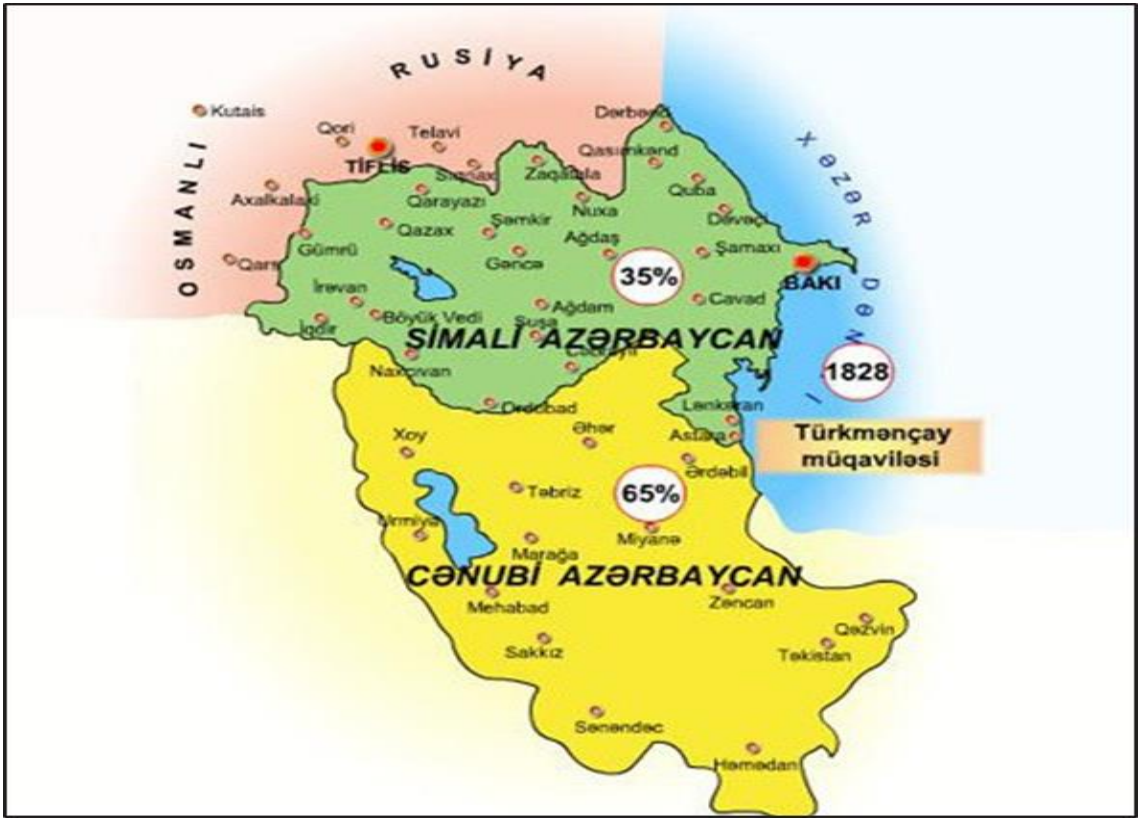
Görsel 1: 1828 Türkmençay Anlaşması ile Azerbaycan Topraklarının Bölünmesi

yönelik Ermeni iskânı hız kazanmıştır 4 (Görsel 1). Türkmençay Antlaşması'nın 15. maddesinde; Güney Azerbaycan'da yaşayan halkın arzu ettikleri takdirde Çarlık Rusya'ya göçebilecekleri ve bunun için uygun koşulların sağlanacağı belirtilmiştir. Açık bir şekilde yer verilirse de bu maddeyle Güney Azerbaycan'dan, bilhassa da Marağa ve Urmiye'den getirilen Ermenilerin Kuzey Azerbaycan bölgesine yerleştirilmesine zemin hazırlanmıştır. 5 Sonuç itibari ile Çarlık Rusya, 19. yüzyılın ilk yarısında dayanışmadan uzak olan Azerbaycan Hanlıklarının içinde bulunduğu durumdan ve bölgenin demografik yapısının uğradığı değişiklikten yararlanarak, Kafkasya'yı işgale başlamıştır. 6