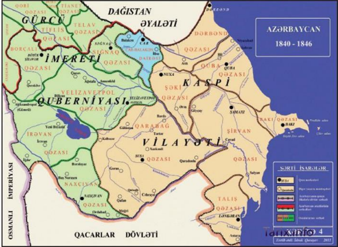
Görsel 3: 1840-1846 Yılları Arasında Kuzey Azerbaycan Toprakları

gelmekteydi. Bu 18 uyezd ise 72 uçastoka ayrılmış ve Ermeni Oblastı kaldırılmıştı (Görsel 3). Güney Kafkasya’da yapılan bu düzenlemelerle Çarlık Rusya için bürokratik merkezietçi idare sağlanmıştı. 18