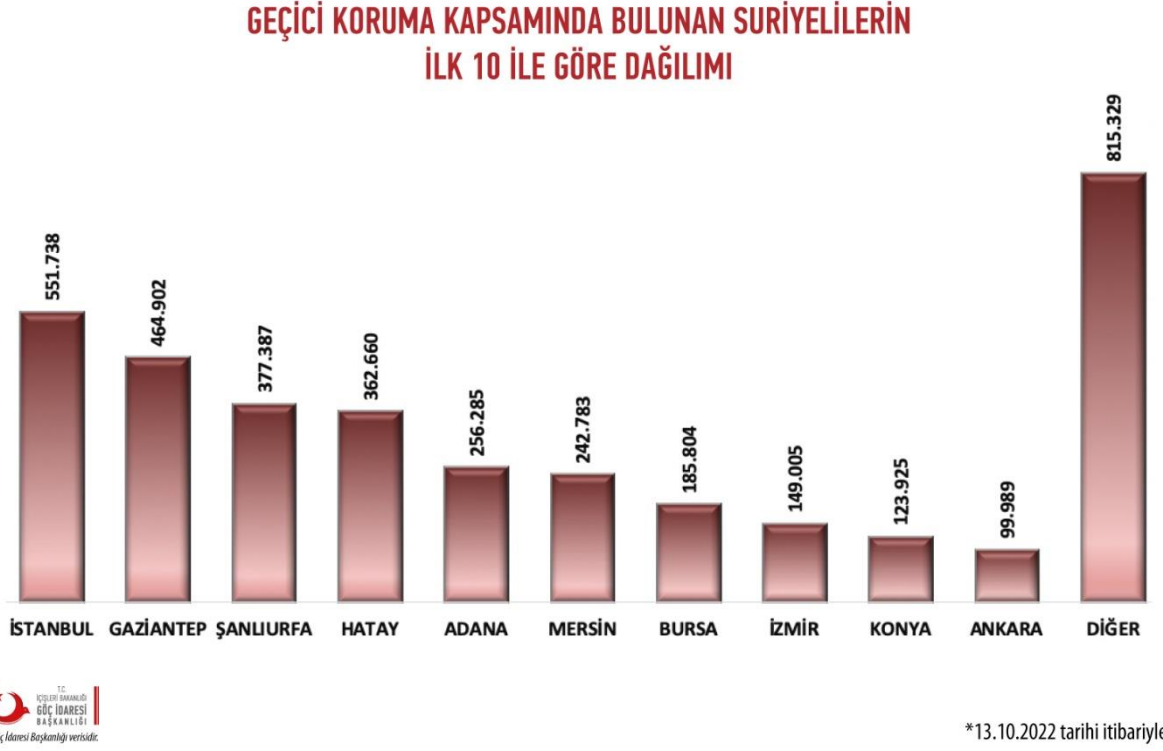
Şekil 2. Geçici Koruma Kapsamında Bulunan Suriyelilerin İlk 10 İle Göre Dağılımı

Şehirlerde yaşayan Suriyeli mültecilere bakıldığında, Suriyeli mülteciler 551 bin 738 kişi ile en fazla İstanbul’da karşımıza çıkmaktadır. Onu 464 bin 902 kişi ile Gaziantep ve 377 bin 387 kişi ile Şanlıurfa takip etmektedir. Sonra sırasıyla 362 bin 660 kişi ile Hatay, 256 bin 285 kişi ile Adana, 242 bin 783 kişi ile Mersin, 183 bin 804 kişi ile Bursa, 149 bin 5 kişi ile İzmir, 123 bin 925 kişi ile konya ve 99 bin 989 kişi ile ankara gelmektedir. Geriye kalan 815 bin 329 kişi ise Türkiye’nin diğer illerinde yaşamaktadırlar. Bu rakamlara içerisinde İstanbul’da yaşayan Suriyeli mültecilerin oranı %15,4 ile en büyük paya sahiptir.