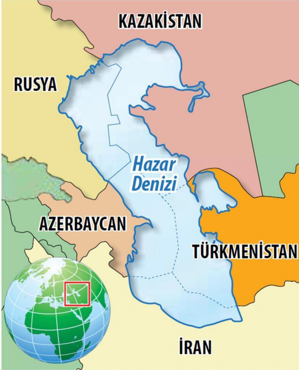
Şekil 4: Hazar'ın Paylaşımı

uyuşmazlıkların çözümlü, kaynakların paylaşımı ve askeri denge korunmasına yönelik hükümlerin açıklanması ile mümkündür. 101