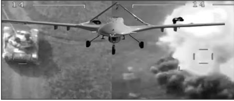
Şekil 3: Savaşta Kullanılan SİHA'lardan

Kasım ve Laçın bölgesi 1 Aralık'a kadar Azerbaycan Cumhuriyeti'ne iade edilecektir. Antlaşmada Karabağ'ın statüsü hakkında hiçbir şey söylememesi Azerbaycan Ordusunun askeri zaferi olarak görülmüştür. Ayrıca Nahçıvan Özerk Cumhuriyeti ile Azerbaycan'ın batı bölgelerini tarafların mutabakatı ile birbirine bağlayan yeni ulaşım hatlarının inşası, Nahçıvan Özerk Cumhuriyeti'ni Azerbaycan'ın ana anakarasına bağlama yolunda önemli bir adım olmuştur. 69 İki ülke arasında yaşanan İkinci Karabağ Savaşı sırasında Ermenistan tarafından yapılan açıklamaya göre 2 bin 425 askeri ölmüştür. Azerbaycan tarafından yapılan açıklamaya göre ise 2 bin 783 asker hayatını kaybetmiştir. 70 Bu rakamın ilerleyen günlerde yapılan açıklamalarla daha arttığı gözlemlenmiştir.