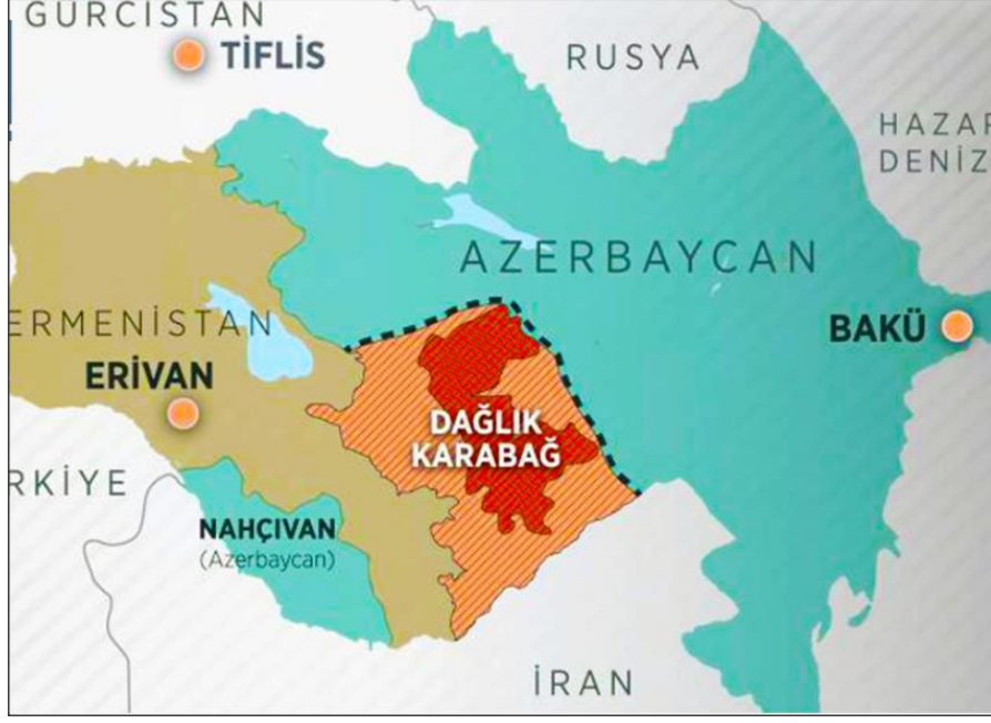
Şekil 2: Karabağ Haritası

Açıklama: Haritada kırmızı olarak görülen alan Karabağ bölgesidir. Turuncu taralı bölge ise önceden Ermeni işgali altında olan ve Azerbaycan tarafından işgalden kurtarılan bölgedir. Siyah kısa çizgiler ise Ermenistan-Azerbaycan ihtilaflı sınırlarını göstermektedir.