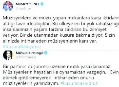
Şekil 70: Son 4 ayda 434 intihar vakası / 29 Mayıs 2021 / Sözcü gazetesi sayfa 5

liralık kredi borcunun bulunduğunu belirten Dervişoğlu "Vatandaş geri ödeyemediği borçlarla karşı karşıya bırakılmaktadır. Ödenemeyen borçlar yüzünden intiharlar artmaktadır. Son 4 ayda 434 intihar vakası yaşanmıştır. Hükümet zaman kaybetmeden yeni tedbirler almak mecburiyetindedir" dedi. (Sözcü)