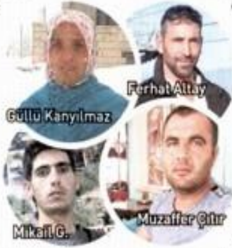
Şekil 76. 3 yasak aşk 4 ölüm / 28 Ocak 2021 / Sabah gazetesi sayfa 3

vurdu. Mikail G. aynı silahla intihar etti. Hediye D. hayati tehlikeyi atlattı. Fatih SENDİL/ SABAH