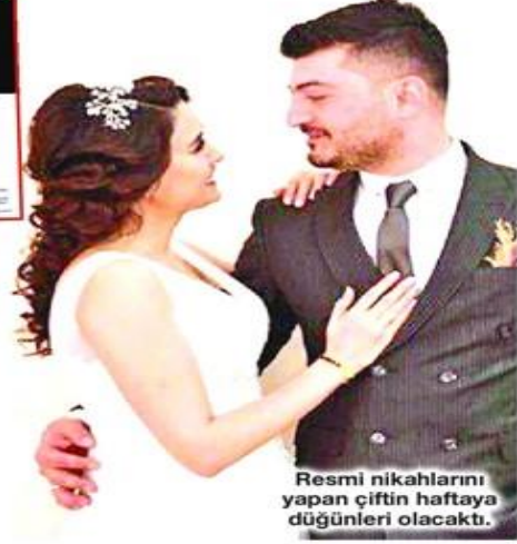
Şekil 29: Uzman çavuş öğretmen eşini silahla öldürdü / 19 Temmuz 2021 / Sözcü gazetesi sayfa 3