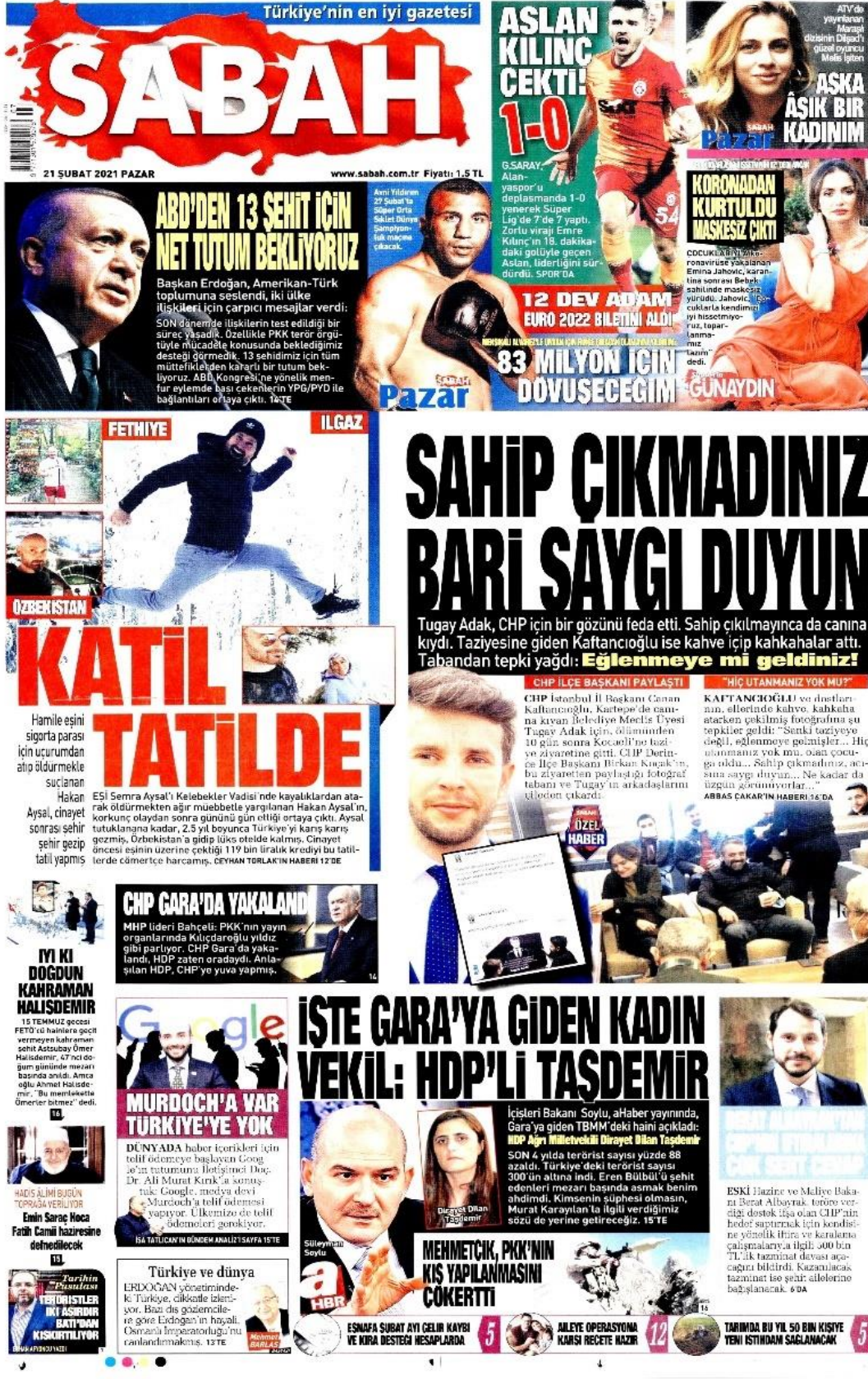
Şekil 41: Sahip çıkamadınız bari saygı duyurun / 21 Şubat 2021 / Sabah gazetesi sayfa 1