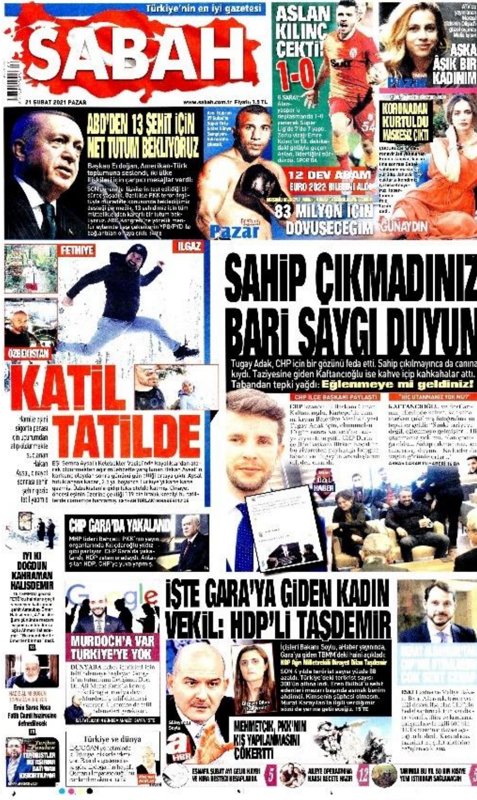
Şekil 48: CHP yüzünden bir gözünü feda etti sahip çıkmayınca canına kıydı / 21