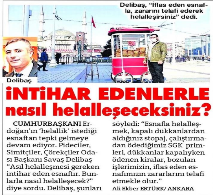
Şekil 68: İntihar edenlerle nasıl helalleşeceksiniz / 17 Mayıs 2021 / Sözcü gazetesi