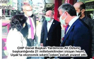
CHP Genel Başkan Yardımcısı Ali Öztunç başkanlığında 21 milletvekilinden oluşan heyet, Uşak'ta ekonomik sıkıntı çeken esnafı ziyaret etti.

Sektörü bitirme çabasına girdiğini anlatan İnanç Al ise "Kongreler devam ederken, otellerde eğlenceler devam ederken, bu kararın pandemiyle alakalı olmadığını gördük" diye konuştu.