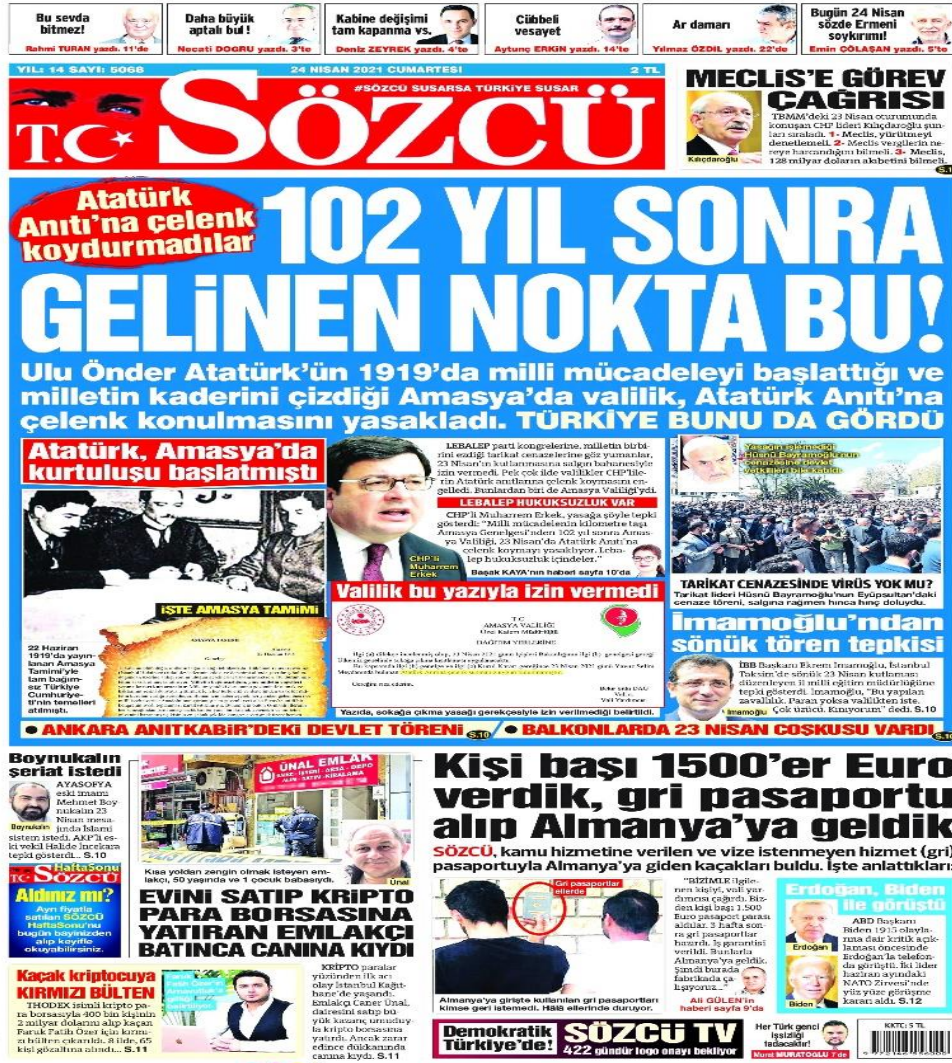
Şekil 11: Evini satıp kripto para borsasına yatıran emlakçı batınca canına kıydı / 24