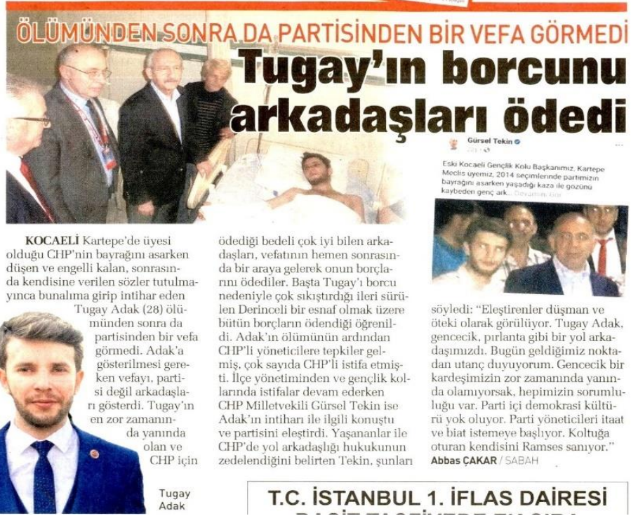
Şekil 45: Ölümünden sonra partisinden bir vefa görmedi / 14 Şubat 2021 / Sabah gazetesi sayfa 16