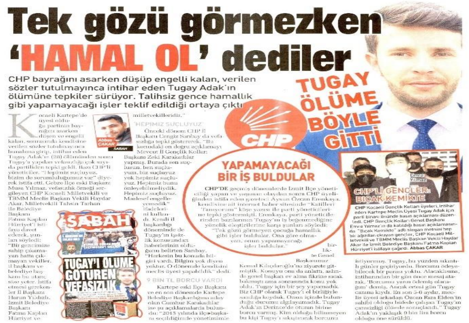
Şekil 44: Tek gözü görmeyenken hamal ol dediler / 12 Şubat 2021 / Sabah gazetesi sayfa