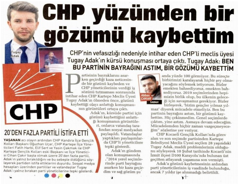
Şekil 46: CHP yüzünden bir gözümü kaybettim / 15 Şubat 2021 / Sabah gazetesi sayfa