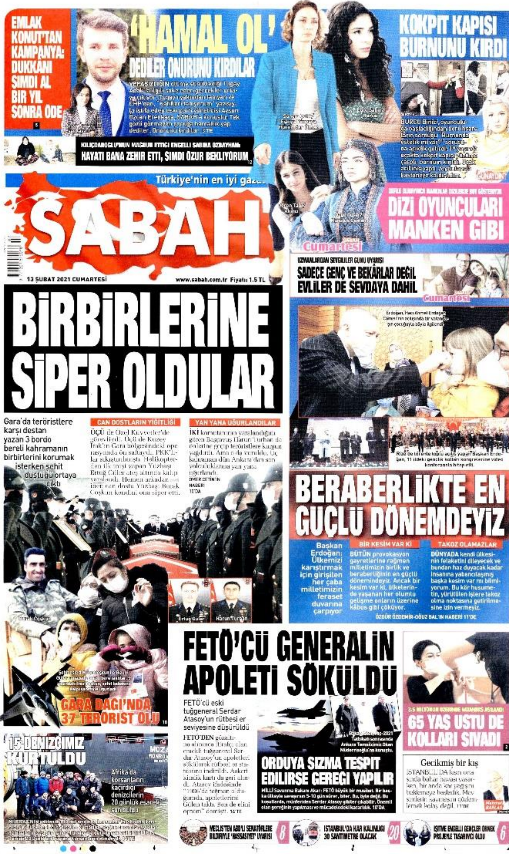
Şekil 38: Hamal ol dediler onurunu kırdılar / 13 Şubat 2021 / Sabah gazetesi sayfa 1