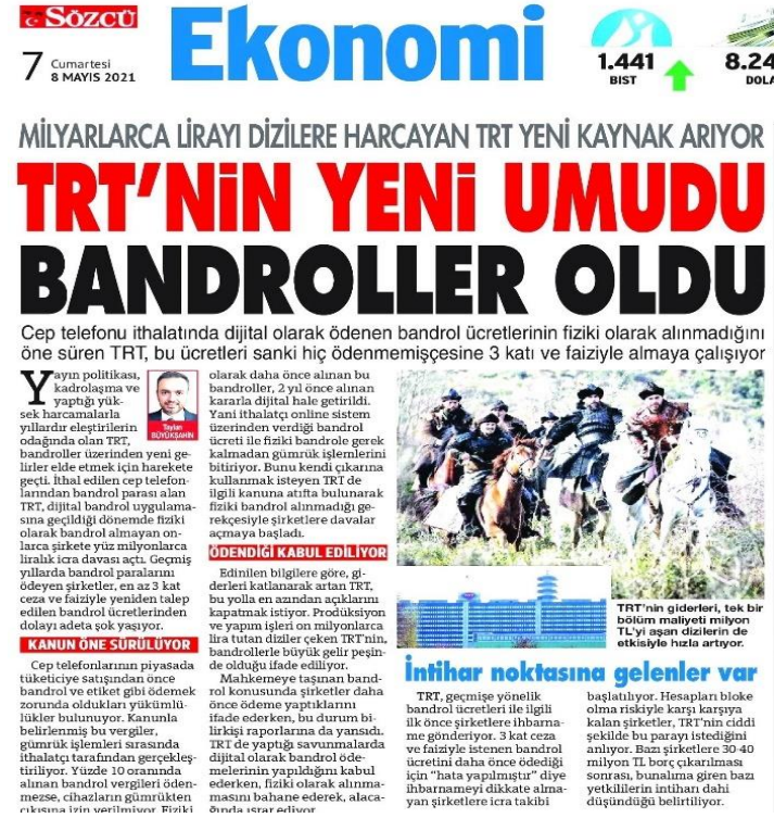
Şekil 66: İntihar noktasına gelenler var / 8 Mayıs 2021 / Sözcü gazetesi sayfa 7