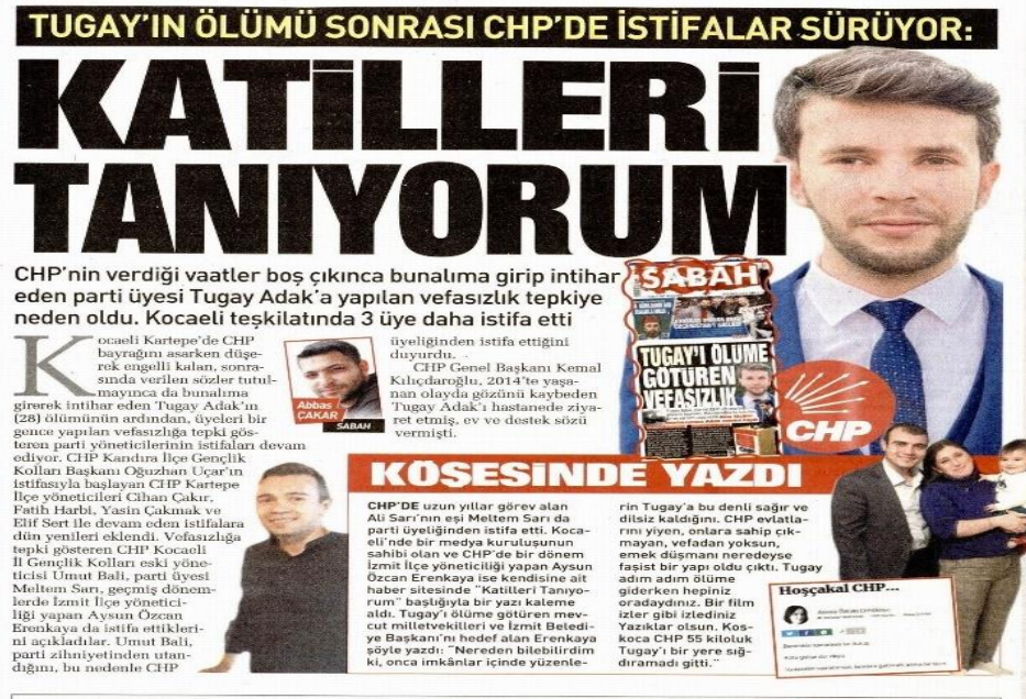
Şekil 43: Turgay'ın ölümü sonrası CHP'de istifalar sürüyor/ 12 Şubat 2021 / Sabah gazetesi sayfa 16

Sabah gazetesi intihar ederek yaşamına son veren CHP'li Belediye Meclis Üyesi T. A.'nın intihar olayını CHP ile bağdaştırmıştır. Muhalif parti için haberlerde ideolojik bakışın bir ürünü olarak şu başlıkları ve kelimeleri haberlerinde kullanılmıştır.