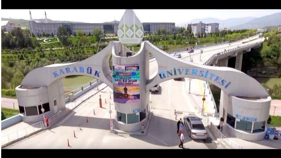
Fotoğraf 37: Karabük Üniversitesi girişinde yer alan köprünün gündüz görünüşü (Karabük Üniversitesi arşivi)