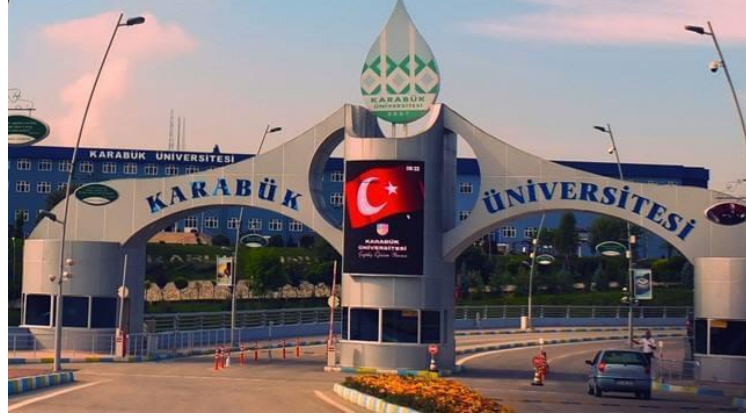
Fotoğraf 23: Karabük Üniversitesi'nin kurulduğu dönemlerde inşa edilen kampüs giriş kapısı