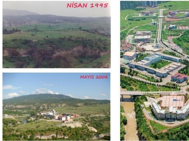
Fotoğraf 49: Karabük Üniversitesi'nin gelişimi

...Babaannem ve dedem genelde kış aylarını Karabük'te halamın yanında geçirdiği için biz de zaman zaman ailecek Karabük'e ziyarete gelirdik. O zamanlar amcamın bizi üniversiteye götürüp gezdirdiğini hatırlıyorum. Hatta birisinde üniversitenin ilk halinin ne olduğunu şimdi neler yaptığını anlatmıştı. Rektörlük yoktu, şimdiki Fen Fakültesi'nin yerinde rektörlük vardı. Hayvanat bahçesi kurulmuştu. Maymunlar, çeşit çeşit tavuklar, kuşlar, bir sürü hayvan vardı. Ağaçlar dikiliyordu. O zamanlar tam net farkında değildim ama şimdi düşündüğümde amcamın bize, neler yaptığını anlatırken sanki gözlerinin içi gülerdi. Şimdi geriye dönüp baktığımda üniversitenin nasıl değiştiğini daha net görüyorum. Hatta amcam neler yaptığını anlatırken bizi üniversitenin arazi arabasına bindirip şimdiki Asiye Hatun Yurdu'nun arka taraflarına götürmüştü. Üniversitenin arazisinin nereye kadar uzandığını ileride neler yapacağını anlatmıştı. Allah rahmet eylesin o zamanlar havaalanı yapacağım derdi, nasip olmadı. Aslında amcam kafasında üniversiteyi inşa etmiş, zamanla onu ilmek ilmek işliyordu. Belki de üniversitenin kaç yıl sonraki planı kafasında vardı. Eğer vekillikten sonraki dönem tekrar rektör olsaydı yapacaklarının yaptıklarından daha iyi olacağına emindim. Allah rahmet eylesin güzel işler bırakıp gitti... (Mert UYSAL)