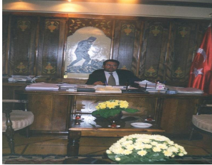
Fotoğraf 21: Safranbolu MYO müdürlüğü dönemine ait bir fotoğraf

...Müdürlük zamanından beri protokolle ilişkileri kuvvetli olan insandı. Odasını ziyaret edenlerin arasında kaymakam, vali, emniyet müdürleri olurdu. Aktif bürokrat bir kimliği vardı. Tüm kaymakam, vali, emniyet bize bağlıydı sanki bizimle çalışıyor gibilerdi... (K13)