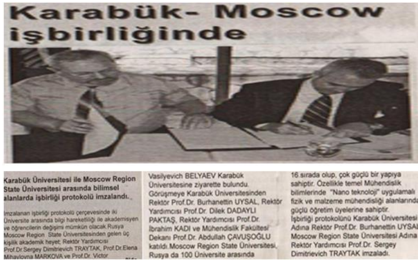
Görsel 7:

Karabük Üniversitesi ile Moscow Region State Üniversitesi arasında bilimsel alanlarda İş birliği Protokolü imzalandı (Batı Karadeniz Ekspres, 2009). Temel mühendislik bilimlerinde nano-teknolojisi uygulamalı fizik ve malzeme mühendisliği alanlarında güçlü bir yapıya sahip olan Moscow Region State, Rusya gibi büyük bir ülkede üniversiteler arasında 16.sırada yer alan bir üniversitedir. Günümüz dünyasının değişen ve gelişen teknolojisinde hayatın düşünce dünyasında bir dönüşüm gerçekleştirmek gerekmektedir. Bilim ve değişimin gerçekleşmesi ise Karabük Üniversitesi'nin göstermiş olduğu bu adım ile ülkede mevcut olacaktır (Uysal, 2021).