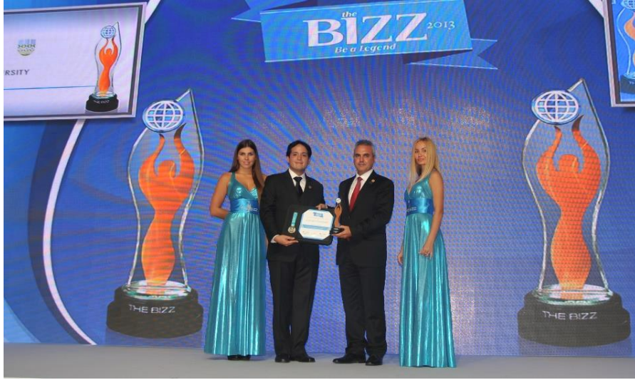
Fotoğraf 33: Dünya İşletmeler Konfederasyonu (WORLD COB) tarafından Karabük Üniversitesi'ne verilen 'BIZZ' ödülü

31 Mart 2014 tarihinde Almanya'nın Berlin kentinde 5 kıtadan gelen yenilenebilir enerji firmaları, çevre kuruluşları ve yeşil şirketlerinin katılımıyla gerçekleştirilen “Global Green Award and The Green Economy Forum”da, Dünya çapında şirketleri, küresel ve yeşil ekonomiye katkıları ve sürdürülebilirlik performansı açısından değerlendiren The Presidency of Association Otherways Management and Consulting France “Üstün Çevresel Başarıları ve Sürdürülebilir Uygulamalarından Dolayı” Karabük Üniversitesi'ne “Küresel Yeşil Ödülü” verilmiştir.