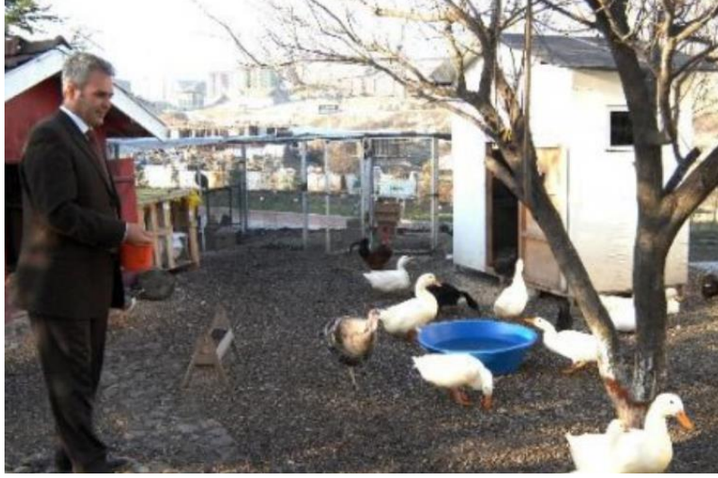
Fotoğraf 46: Üniversite içerisinde kurulan hayvanat bahçesinden bir fotoğraf

şehrin merkezinden bile insanlar geliyordu. Bir gün derste eşek anırması duymuştum. Burhanettin Hocamız Karabük Halkına üniversitemiz için elinizde hangi hayvan varsa başlayabilirsiniz dediğinde birisi de eşeğini bağışlamıştı. Bu da geriye kalan değişik bir anıdır... (K10)