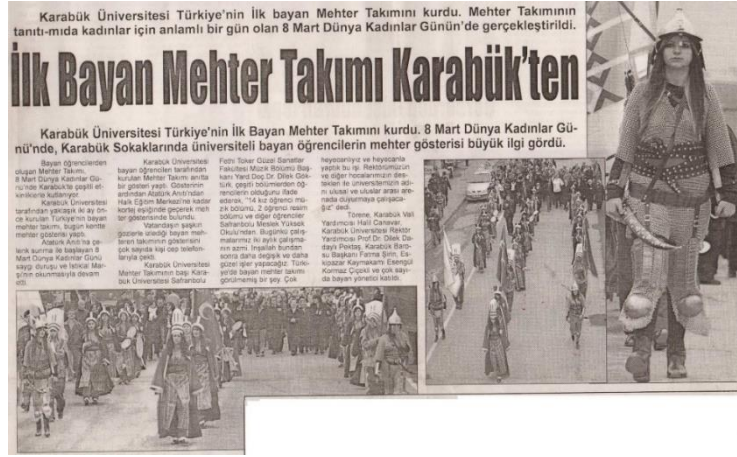
Görsel 11