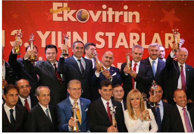
Fotoğraf 30: Ekovitrin 13.Yılın Starları ödül töreninden bir fotoğraf. Yıl:2014