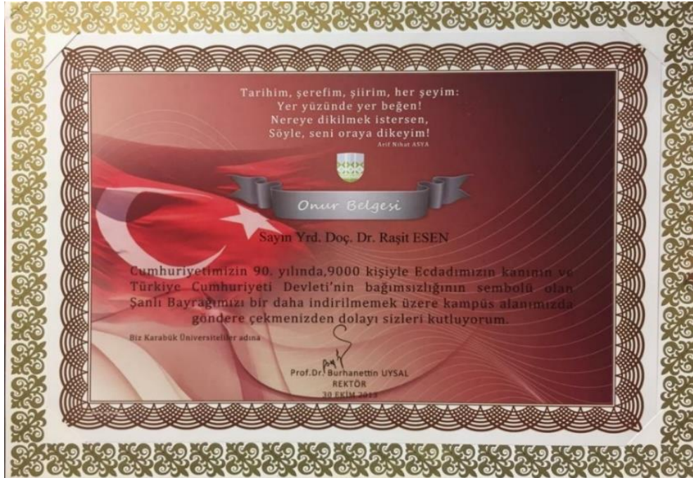
Fotoğraf 48: Bayrağımızın göndere çekilmesinin ardından verilmiş olan onur belgesi. Yıl: 2013