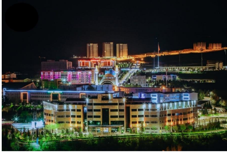
Fotoğraf 50: Karabük Üniversitesi'nin günümüze ait akşam çekilmiş fotoğrafı