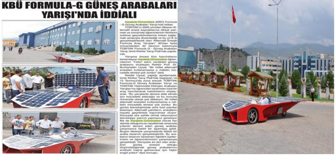
Görsel 8:

yaşına bastı ama uluslararası arenada kendini göstermeye başladı” ifadesini kullanmıştır. Güneş enerjisi ile çalışan araca ‘Safrancar-1’ ismi verilmiş ve o dönem 100.000 YTL’ye mal olduğu belirtilmiştir (Batı Karadeniz Ekspres, 2008).