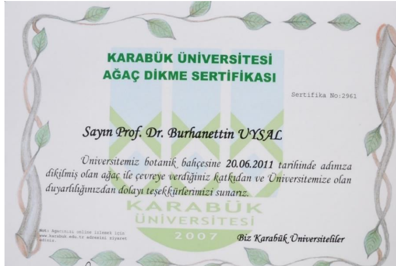
Fotoğraf 24: Ağaç dikildikten sonra verilen sertifikaya örnek bir fotoğraf

...Bu üniversiteye alınan ilk aletlerden biri de ağaç dikme makinesi idi. Olgunlaşmış temiz ağaçları yerinden hiç zarar vermeden söktürüp üniversiteye diktiriyordu. Pikniğe giderdik ağaçlara bakardı bu ağaç güzel diyerek o ağacı seçer üniversiteye diktirirdi. Yemyeşil bir alan oldu. Üniversiteye gelmiş önemli kişilerin, hocaların isimlerine özel ağaç diktirirdi. Herkesin ağacı vardı üniversitede... (K10)