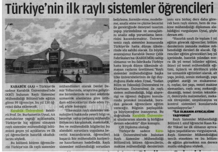
Görsel 6