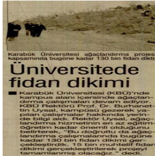
Görsel 5