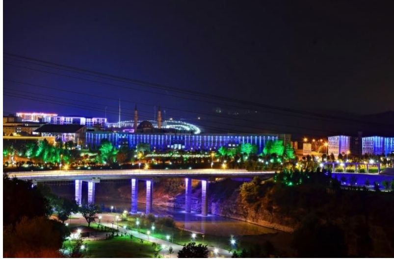
Fotoğraf 36: Karabük Üniversitesi girişinde yer alan köprünün akşam görünüşü