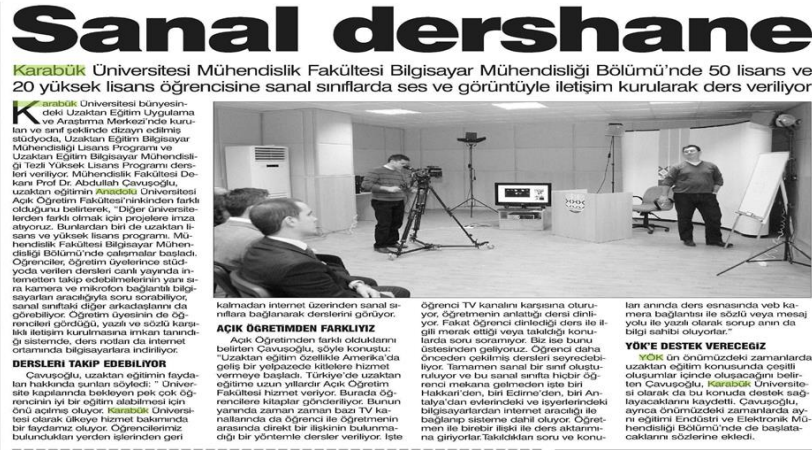
Görsel 9:

ve yaşam boyu sınırsız öğrenmenin kapılarını sonuna kadar açmayı istemiştir. UYSAL uzaktan eğitim hakkında; 'Bu hizmeti ulusal ve uluslararası boyuta ulaştırma amacındayız. Bu sistem ile üniversitemiz yüzlerce öğrenciye ulaşacaktır.' şeklinde ifadelerde bulunmuştur. Daha önce de belirtildiği gibi her şeyin ilkinin yapmayı istemiş ve Karabük Üniversitesi'nde, elektronik imza durumunu ilk başlatan üniversiteler arasında olmuştur. Bu bağlamda elektronik imza gelişmesi de yine KBÜ'nün mühendis akademisyenleri tarafından ilk yazılımı yapmaları ile birlikte olmuştur. Uzaktan eğitim sistemi ile Türkiye'de ilk defa Bilgisayar Mühendisliği, Endüstri Mühendisliği vb. alanlarda eğitim vermeye başlanmıştır (Günboyu, 2010).