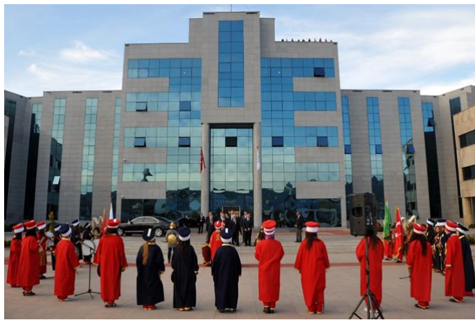
Fotoğraf 25: Karabük Üniversitesi ve ana mehteran takımı