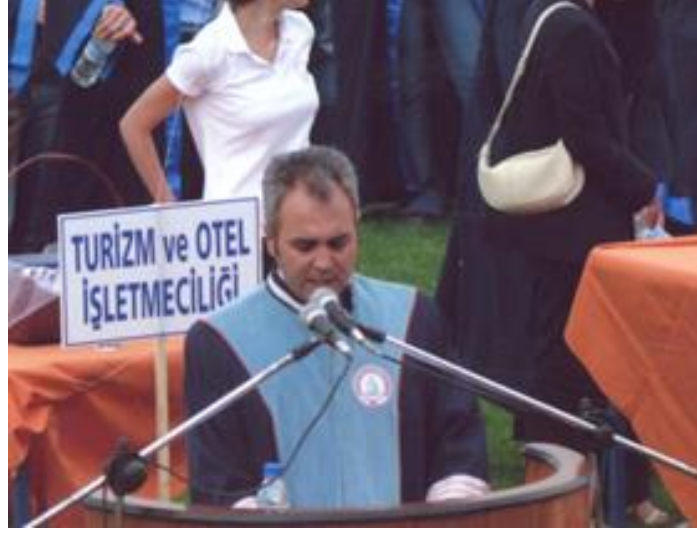
Fotoğraf 22: Rektör yardımcısı olduğu döneme ait bir mezuniyet konuşması

üniversitenin kurulmasının sadece bir sanayi kenti değil aynı zamanda Türkiye’den hatta dünyanın her yerinden öğrenci akışının olmasının şehre büyük katkı sağlayacağını öngörmüştür. Karabük şehrine geldiği günden itibaren sahiplenen ve gelişmesi için sürekli çalışan, Karabük Demir-Çelik Fabrikası’nın dışında üniversitenin de bir şehri geliştireceğini düşünmüş ve bu dönemlerde Karabük Üniversitesi’nin kurulmasında büyük bir alt yapı çalışması sürdürmüştür. KBÜ ile aynı zamanlarda kurulan 17 üniversite arasında akademik kadro ve alt yapısı bakımından tamam olan tek üniversitenin KBÜ olmasında UYSAL’ın büyük bir rolü vardır.