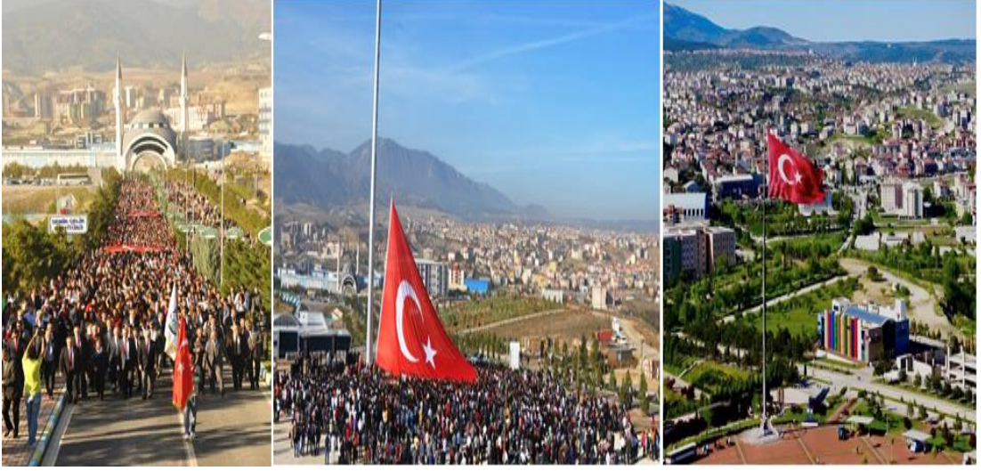
Fotoğraf 47: Bayrağımızın göndere çekilmesi için yapılmış olan kortej yürüyüşü ve tören Yıl: 2013

şehrin önde gelen bürokratları ile 2013 yılında Demir Çelik Kampüsü içerisinde kortej yürüyüşü ve törenin ardından bir daha indirilmemek üzere göndere çekilmiştir.