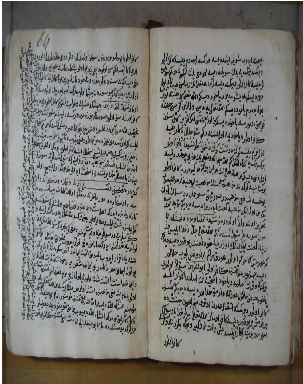
Şekil 3: Yusufaga Kütüphanesindeki Nüşadan örnek sayfa (Konya Karatay Yusufaga Kütüphanesi, 7072/2 numaralı demirbaşa kayıtlıdır.)