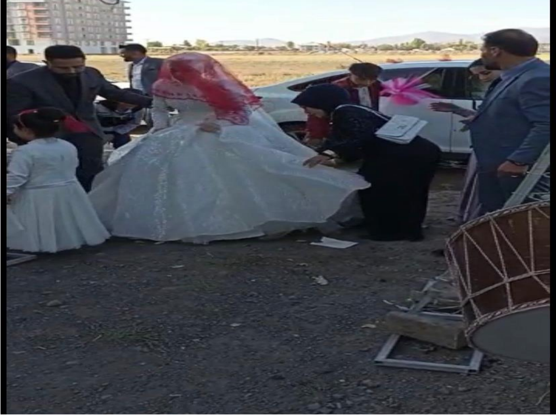
Resim 9: Gelin getirme (21.05.2022)