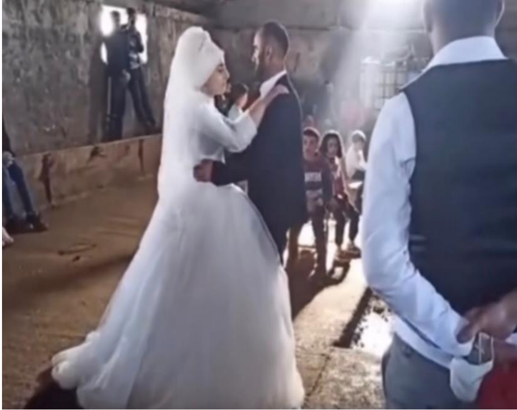
Resim 7: Ağrı'da ahırda yapılan bir düğün (01.11.2019)