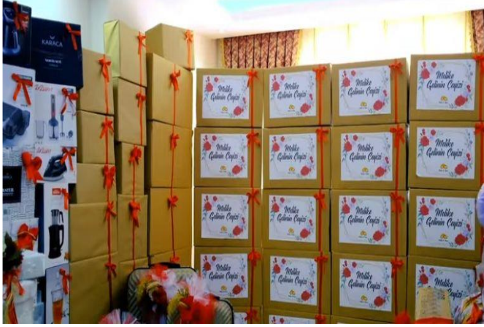
Resim 4: Çeyiz hazırlıkları (18.07.2023)