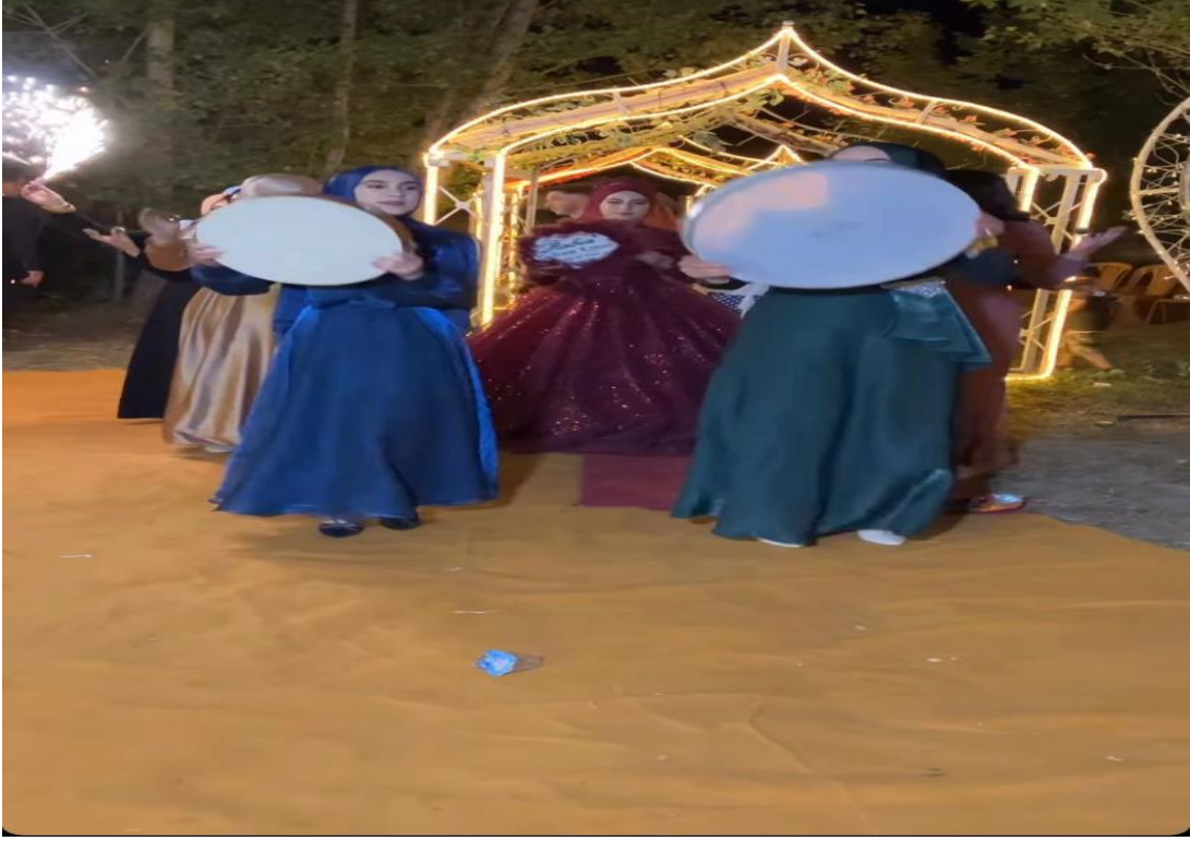
Resim 11: Ağrı'nın Diyaradin ilçesinde gelin kınasında çekilmiş bir fotoğraf (11.07.2023)

yapılmasında yengelerin çok önemli bir yeri vardır. Bu yengeler genellikle gelenek ve görenekleri çok iyi bilen bilgili kişilerdir (K.K9).