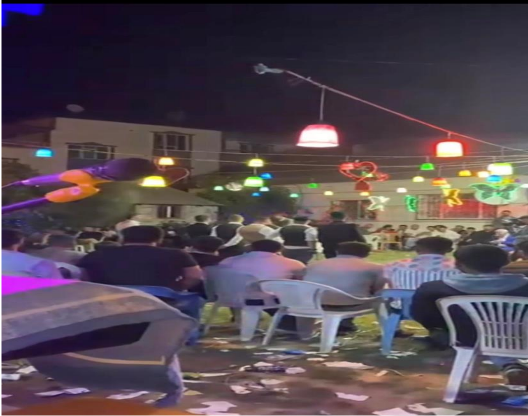
Resim 14: Ağrı'da damat kınasında damadın kuzenlerine ceza verilirken 805.08.2023)