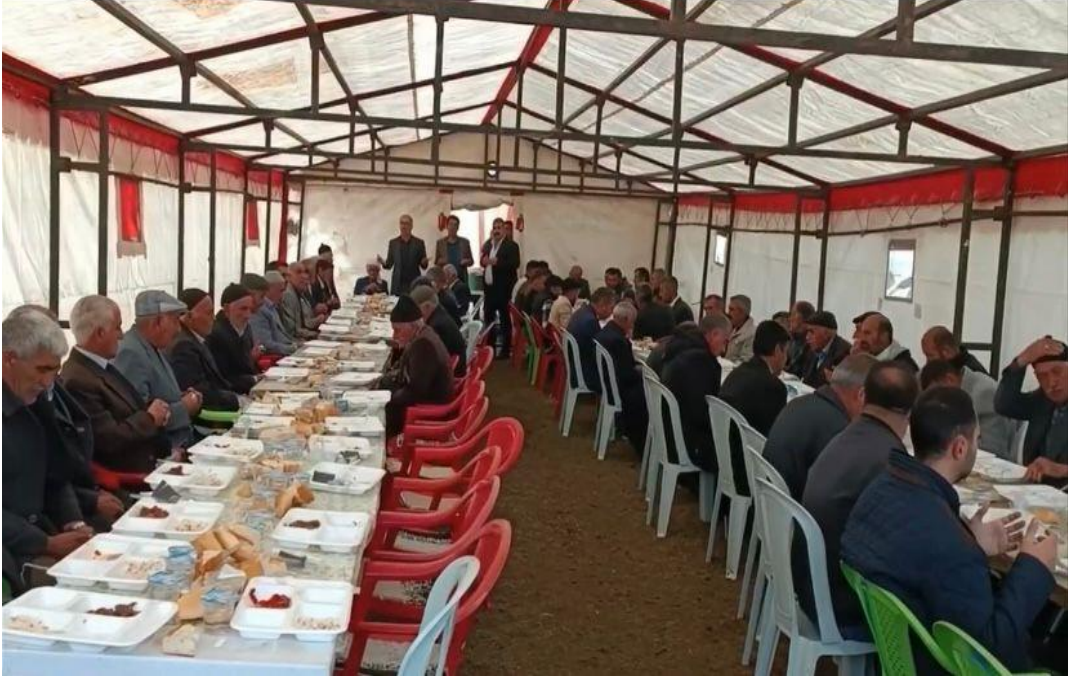
Resim 6: Düğünden önce kurulan çadırda dağıtılan öğle yemeği (10.05.2021)