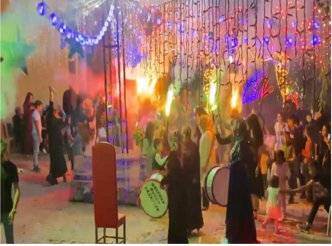
Resim 12: Ağrı'nın Patnos ilçesinde yapılan gelin kınası töreni (29.10.2022)