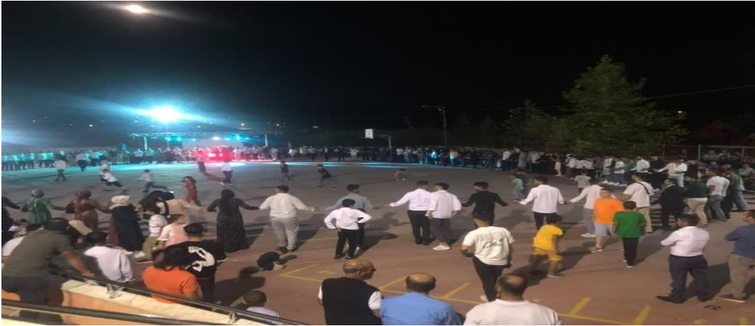
Resim 5: Okul bahçesinde yapılan bir düğün akşamı (09.09.2022)

Yörede yaşayan insanlar genellikle düğünlerini düğün salonlarında yapmaya pek sıcak bakmazlar. Bunun en büyük nedenlerinden biri düğün salonlarının küçük olması ya da misafirlerin kapalı bir alandan ziyade daha ferah ve daha büyük bir alanda olmak istemesidir. Öte yandan düğün sahipleri düğünlerinin evlerinin önündeki bahçede yapılmasının aileye itibar kazandığını da düşünürler (K.K9).