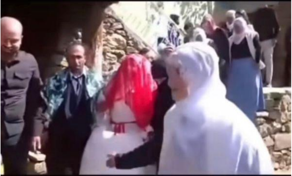
Resim 10: Gelin alma (04.04.2023)