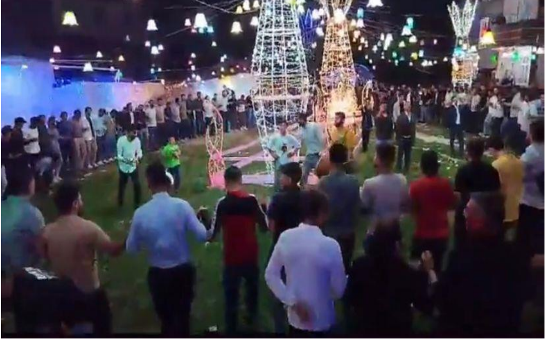
Resim 13: Ağrı'da çekilmiş bir damat kınası (19.07.2023)