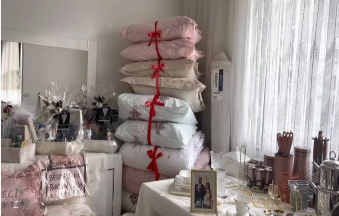
Resim 3: Çeyiz hazırlıkları (22.09.2022)

tarafının parayı vermesinden sonra anahtar bulunur ve kapı açılır. Kapı açıldıktan sonra ise gelin ve damat için hazırlanan küçük bir yastık gelin sandığının içine konulur ve yine sandığın açılıp içindeki yastığın damat tarafına teslim edilmesi için yine giriş kapısının anahtarında olduğu gibi para istenir. Belli bir miktarda para verildikten sonra sandık açılır ve içindeki yastık gösterilir. Sonrasında ise sandık içindeki yastıkla beraber damat evine götürölmek üzere çeyizin yüklendiđi araca yüklenilir. Hem kapının anahtarının bulunması için para verme hem de içindeki yastıkla beraber sandığın verilmesi bir gelenek haline geldiđi için kız tarafı çeyizin taşınacağı zaman damadın da taşıma ekibiyle gelmesini istenilir. Hatta öyle ki bu gelenek uygulanırken damat tarafı ile sandığı ya da yastığı veren kişi arasında çok sıkı bir pazarlık yapılır. Damat tarafı çeyizi arabaya yükledikten sonra damat ile gelinin düğün gününden sonra yaşayacakları eve götürölür ve eşyalar dikkatli bir şekilde arabadan indirilip eve taşınır. Taşınan bu çeyiz düğünden sonra gelin tarafından açılır ve kullanılmaya başlanılır (K.K8, K.K9, K.K10).