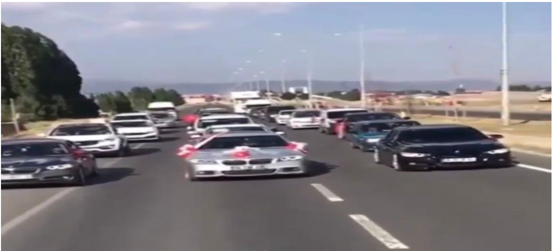
Resim 8: Düğün konvoyu (22.07.2018)

Damadın evine gelin getirildikten sonra misafirler, daha önce hazırlanan çadırlardaki sandalyelere otururlar. Misafirlere öğle yemeği dağıtmadan önce takı töreni başlar. Takı töreni kameraman tarafından kamerayla kayıt altına alınır veya damat tarafı takı atanların isimlerini küçük bir deftere yazarlar. Takı töreninin sonunda gelen takılar sayılır ve ne kadar takının atıldığı yüksek bir sesle misafirlere söylenilir. Takı töreninden sonra önce erkeklere sonrasında ise kadın ve çocuklara öğle yemeği dağıtılır. Yemek yiyen misafirlere bazılarını akşam düğüne gelmek şartıyla düğün yerinden ayrılırlar. Kimileri de yemekten sonra orkestranın çalmasıyla birlikte yöresel oyunları oynarlar (K.K8).