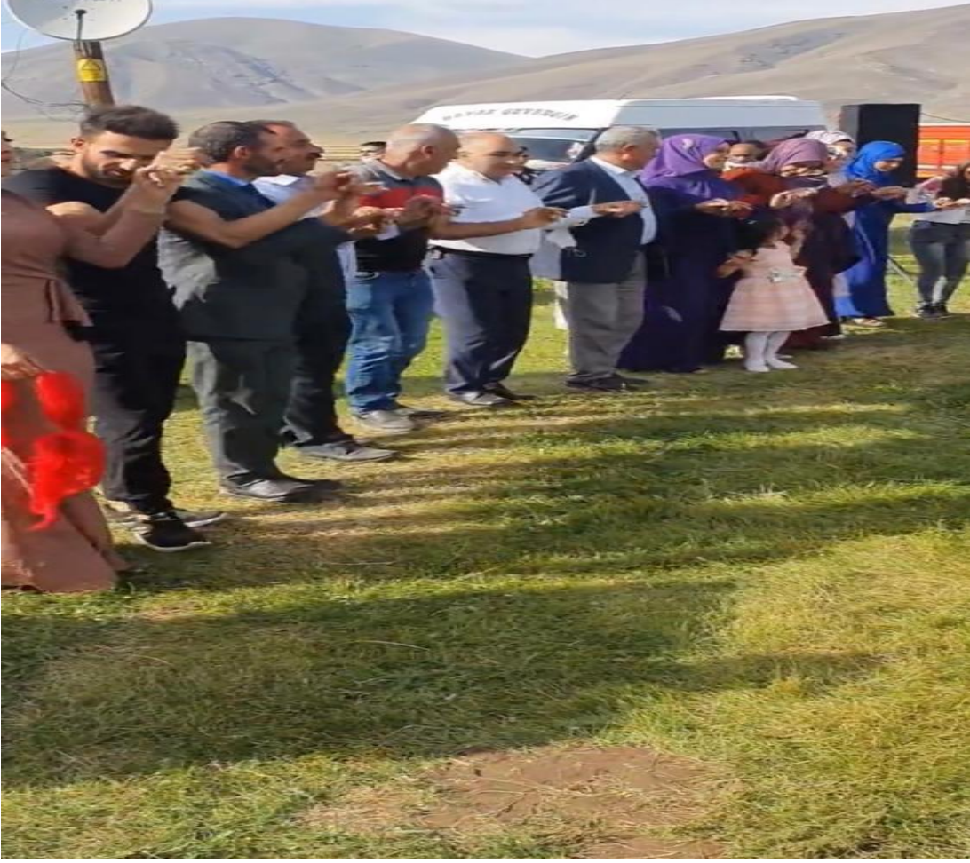
Resim 2: Haftalıkta çekilmiş bir fotoğraf (24.10.2022)