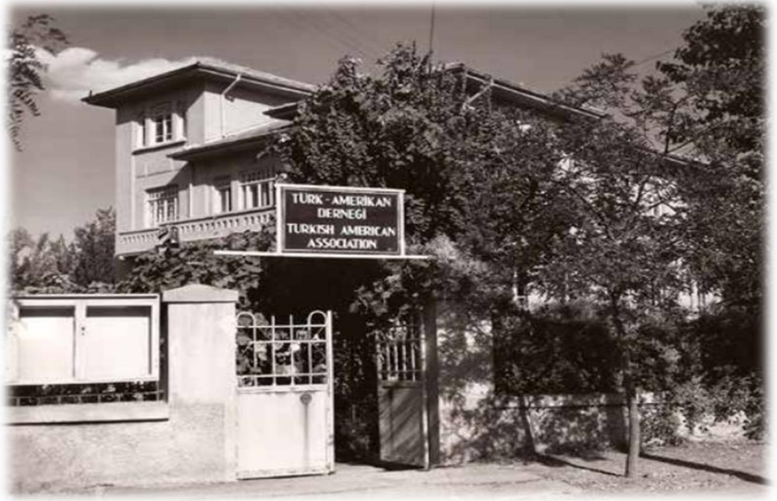
Şekil 1: Türk-Amerikan Derneği Binası.

Türkiye'nin ABD'deki ilk resmi lobicilik girişimi ise 1981 yılında olmuştur. Türkiye ABD'de profesyonel bir lobi şirketine para ödeyerek Türkiye lehine propagandalar yapılması için şirketle anlaşmıştır. 1982'de ise "Türk Çalışmaları Enstitüsü" adı ile Washington'da yeni bir lobici oluşum oluşturulmuştur. 97 Türk Çalışmaları Enstitüsü'nün etkinlik sahası eğitim ve kültür alanındadır. Kuruluşun ana amacı Türk-Amerikan halkının birbiri hakkındaki ön yargılarını kırmaktır. Bunu ise özellikle üniversitelerde verilen seminer, bildiri, sempozyum türündeki etkinliklerle gerçekleştirmektedir. 98