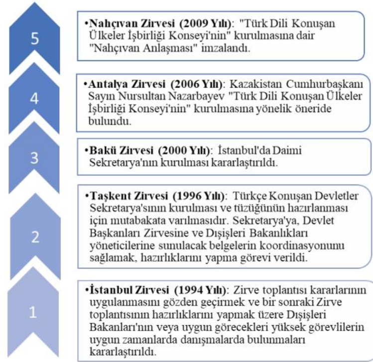
Şekil 3: Türk Devletleri Entegrasyonunun Kurumsallaşması ve Örgüte Dönüşme Süreci

Türk devletleri arasındaki entegrasyon sürecinin kurumsallaşarak örgüte dönüşme aşaması görselde (şekil 2 359 ) gözlemlenebilir.