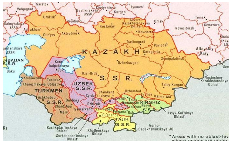
Şekil 1: Sovyetler Birliği'nin Orta Asya'daki cumhuriyetleri

Eylül 1924'te Türkistan parçalara bölünerek yerine Tacikistan Özerk Cumhuriyetini de içine alan Özbekistan Sovyet Sosyalist Cumhuriyeti, Türkmenistan SSC, Rusya'ya bağılı Kırgızistan Özerk Cumhuriyeti (bugünkü Kazakistan), Kara-Kırgızistan (bugünkü Kırgızistan) Özerk Cumhuriyeti ve yine Rusya'ya bağılı Karakalpakistan Özerk Bölgesi oluşturulmuştur. 1929 senesinde Tacikistan, Özbekistan'dan ayrılarak ayrı Sovyet Sosyalist Cumhuriyeti haline gelmiş, bunun yanında Kırgızistan'ın adı Kazakistan, Kara-Kırgızistan'ın adı ise Kırgızistan olarak değiştirilmiştir. Karakalpakistan Özerk Bölgesi 1932 yılında Rusya'ya bağılı özerk cumhuriyet haline gelmiş, 1936 yılında ise Özbekistan'a bağlanmıştır. 68 Böylece 1924'te başlayan sınır düzenlemeleri 1936'da tamamlanmış ve haritadaki (şekil 1) 69 görünümünü almıştır.