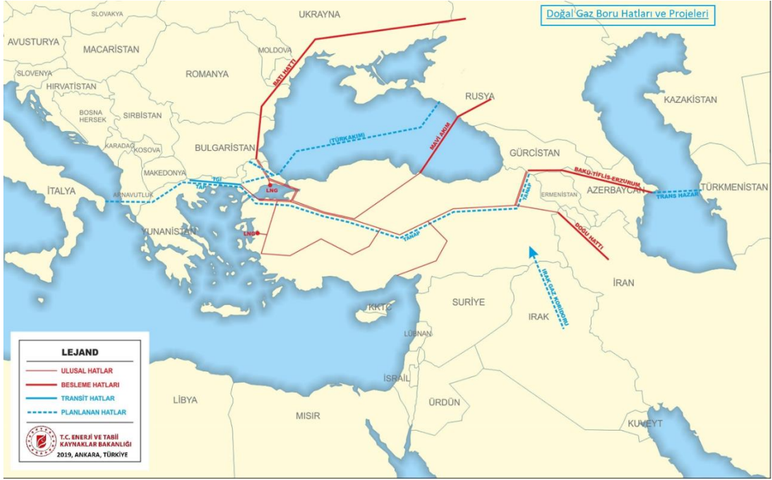
Şekil 3: Doğal gaz boru hatları ve projeleri 166

Karadeniz’e kıyıdaş olan ülkelerin doğal gaz rezervleri olsa bile dünyada kanıtlanmış doğal gaz rezervlerinin %18,1 kadarı (35 Trilyon metreküp) Rusya Federasyonu’na ait 167 olup kendisi küresel çapta önemli bir enerji üreten aktör konumunda yer almaktadır.