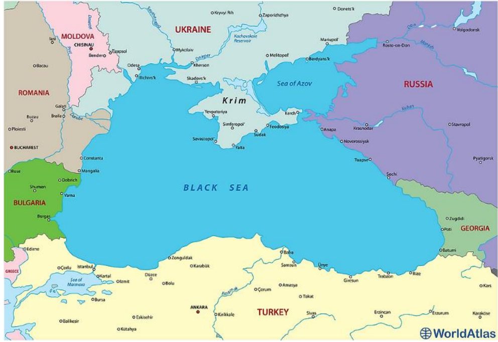
Şekil 2: Karadeniz 158

Karadeniz jeostratejik açıdan önemli bir yere sahip olup tarih içerisinde birçok mücadeleye konu olmuştur. Karadeniz havzası coğrafi konumu itibari ile kendi çevre ülkelerine pek çok fırsat sunarken diğer bir taraftan da birçok tehdit sunmaktadır. Bu tehditlerin en önemlilerinden biriside 1991 sonrasında Sovyet Sosyalist Cumhuriyetler Birliğinin dağılması sonrasında Karadeniz çevresinde ortaya çıkan yeni devletler ve devletlerin paylaşılan topraklar konusundaki anlaşmazlıklarından kaynaklanmaktadır. Bu üzerinde bir anlaşmaya varılamayan toprak sorunları ateşkesler ile dondurulsa bile günümüzde bu dondurulmuş çatışmaların buzu çözülmüştür. Yeniden ısınan ve buzlarını eriten bu çatışmalar Karadeniz'in suyunu ısıtmakta, bölgenin tansiyonunun yükselmesine sebebiyet vermektedir.