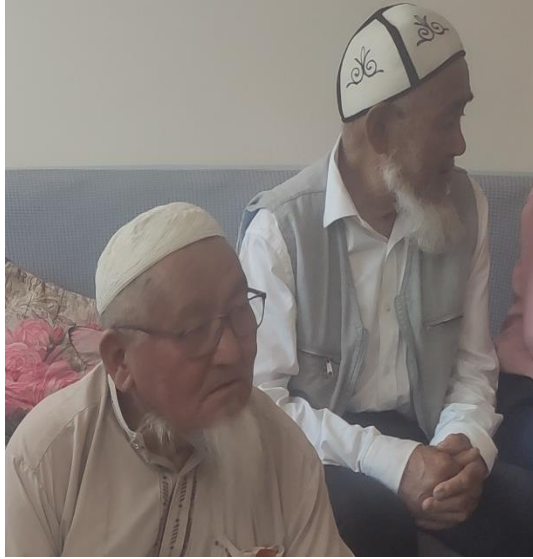
Şekil 81: Yaşlı erkeklerin kullandığı başlıklar

Ulupamir köyünde yaşayan Kırgız Türklerinde, köy halkı içinde düzenli olarak camiye gidip namaz kılanlara namazkul denilmektedir. Namazkul adıyla anılan kişiler