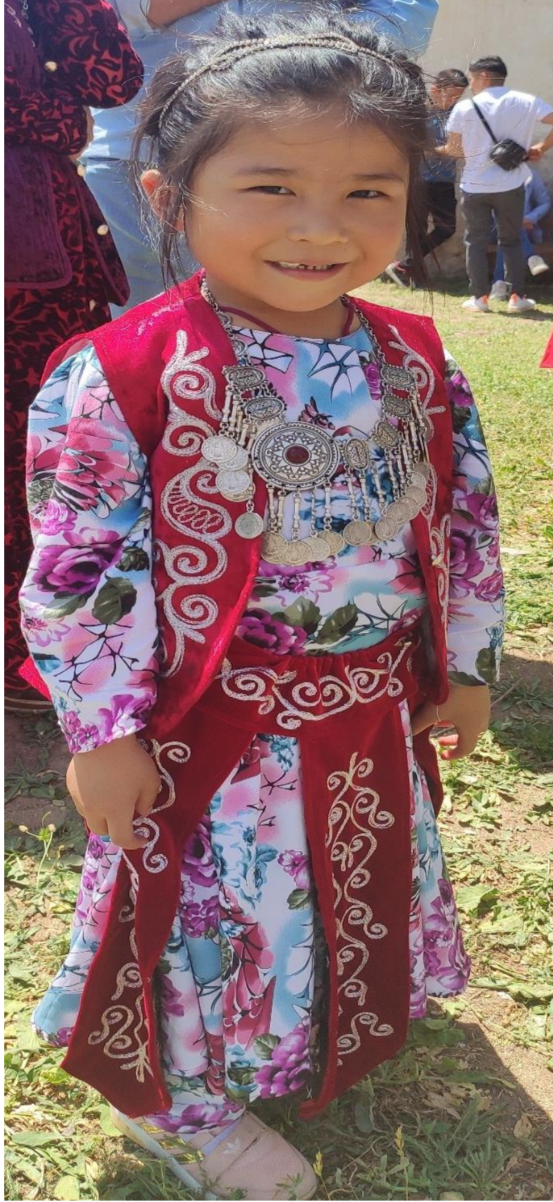
Şekil 95: Geleneksel giysiler ve takılarla bir kız çocuk