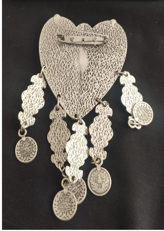
Şekil 19 : Taşlı, işlemeli gümüş elbise aksesuarı (arka)