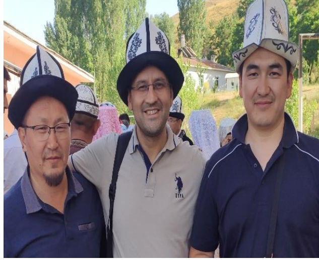
Şekil 78: Kalpak