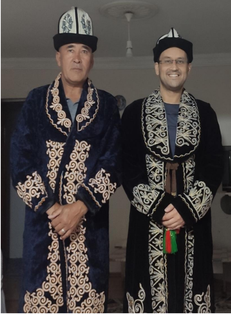
Şekil 84: Geleneksel erkek dış giysisi

Türkiye'ye ilk geldiğimizde Pamir'de giydiğimiz kıyafetleri giyiyorduk. Zamanla köyün mevsimleri de değişti. Ulupamir'e eskiden çok kar yağardı artık çok kar yağmıyor. Bundan dolayı çok soğuk olan Pamir'de giydiğimiz kıyafetleri burada yavaş yavaş bıraktık. (KK03)