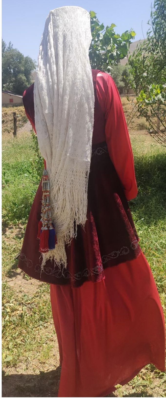
Şekil 69: Yenge giysisi (arka)