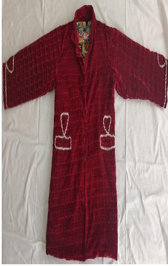
Şekil 52: Kezmur (ön)