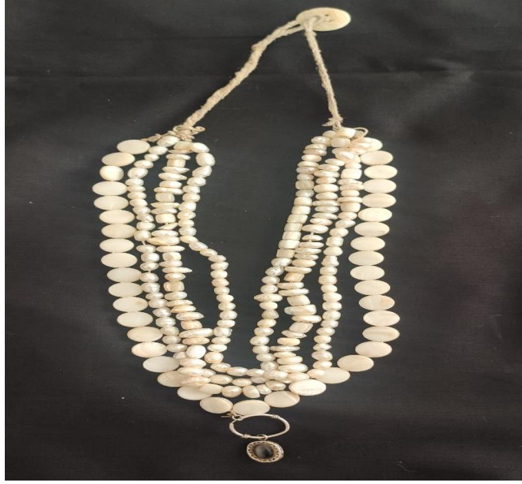
Şekil 30: Hakıg sedef gerdanlık