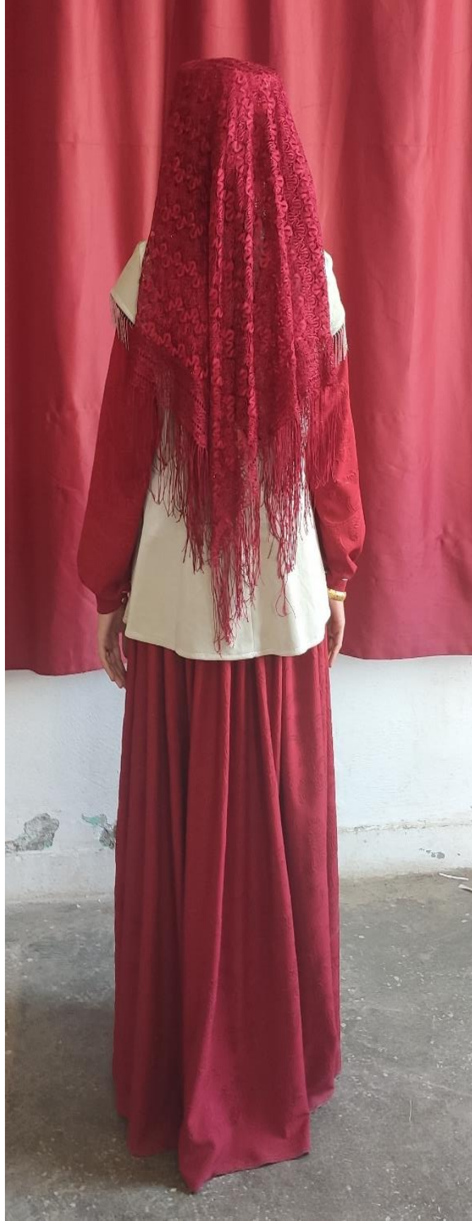
Şekil 59: Nişan giysisi (arka)