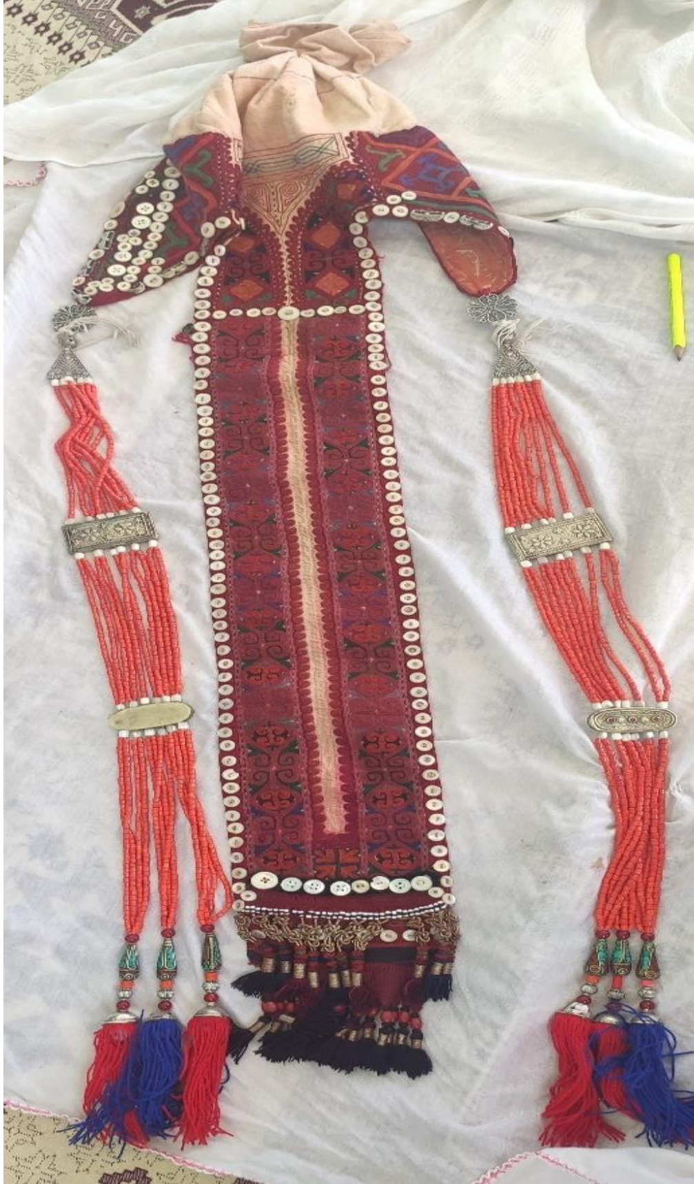
Şekil 40: Gelin başını oluşturan malzemelerden çaçek