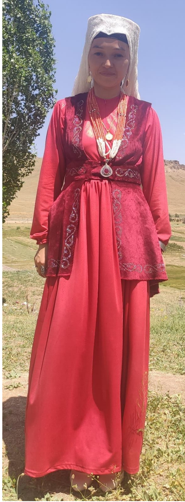
Şekil 68: Yenge giysisi (ön)