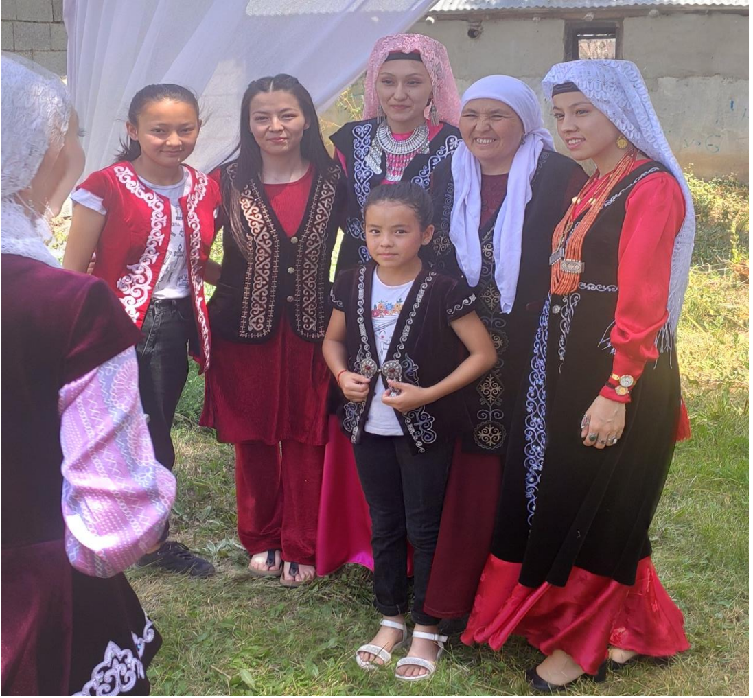
Şekil 14: Mesket giyen farklı yaşlarda kadınlar