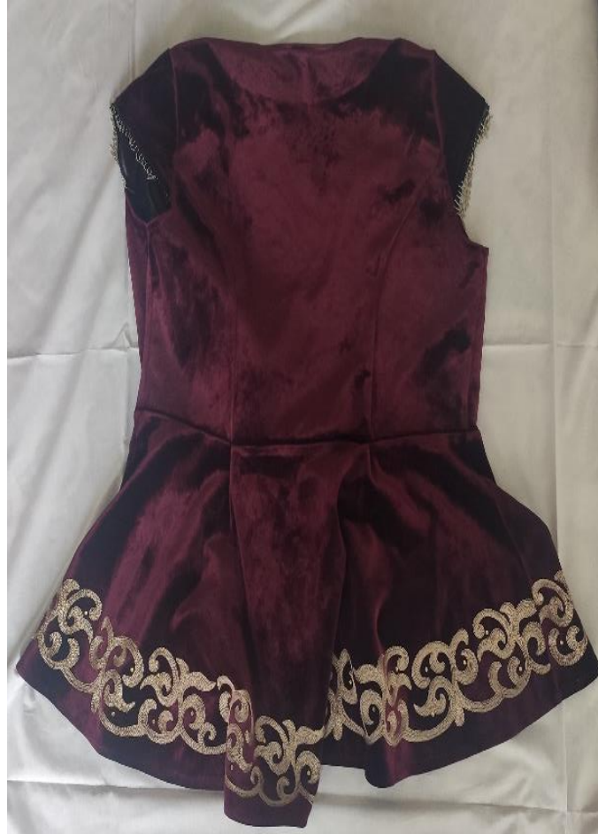
Şekil 44 Gelinlik kızlar için mesket (arka)

“Eskiden gelinler köynek giyerdi. Koçkorok motifi işlenir. Köyneğin üzerine gelin mesketi giyilir.” (KK02) Geçmişte gelinlerin köynek adlı boydan elbise giydikleri, boydan elbisenin üstüne giyilen mesketlerin gelinlik olarak kullanılınca daha özel olarak hazırlandığı belirlenmiştir. Mesketin uzun kollu, ceketi andıran şekline kazmur adı verilmektedir. İçine astar dikilen ve dize kadar uzanan dış giysiye kemsel denilmektedir. (Arıkoğlu, Alimova, Askarova, & Selçuk, 2018). Sözlükte kemsel, kemzel ve kezmir adlarıyla yer alan giysinin Ulupamir köyünde yaşayan Kırgız Türklerince halk ağzıyla kazmur denildiği görülmüştür. Zaman içinde gelinlerin giydiği köynek ve mesketin kumaşı ve renklerinde farklılıklar olsa da günümüzde kullanılan giysilerde Kırgız Türklerinin ve Pamir yaylasında yaşayan Kırgız Türklerinin giyim kuşam kültürünü yansıtan motifleri kullanılmaya devam etmektedir. Bu durum Ulupamir köyünde yaşayan ve Türkiye’ye kırk iki yıl önce göç eden kuşakla, Türkiye’de Ulupamir köyünde doğup büyüyen kuşağın kültürlerine sahip çıktıklarını göstermektedir.