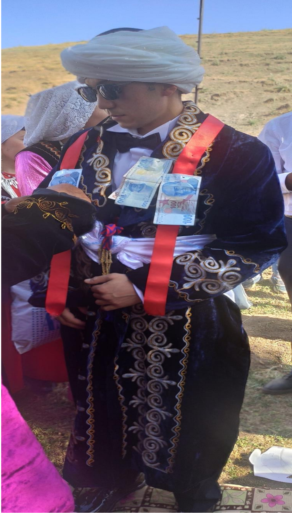
Şekil 87: Geleneksel kıyafetleri ile damat