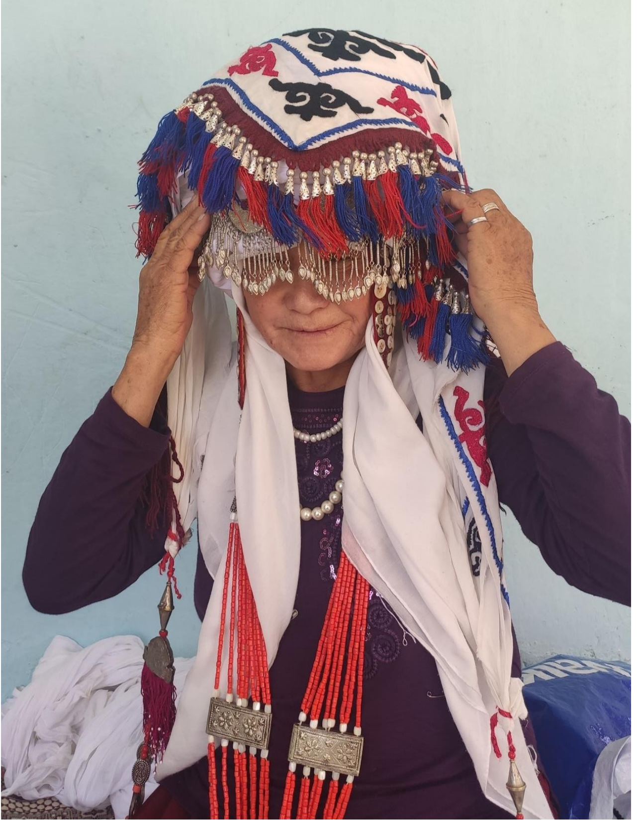
Şekil 37: Geleneksel gelin başı