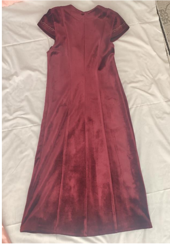
Şekil 65: Nişanda giyilen (arka)