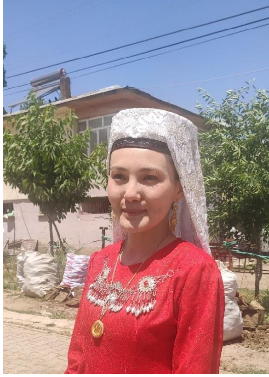
Şekil 6: Evli kadınların kullandığı başlık (ön)