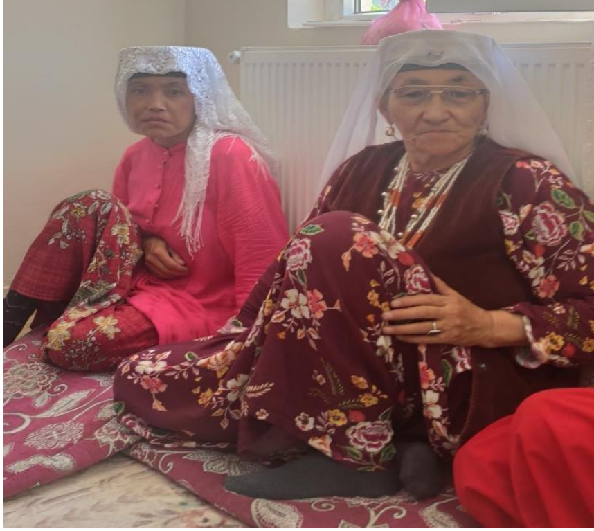
Şekil 8: Yaşı ilerlemiş kadınların başlığı

Pamir Kırgızlarına misafir olan gezgin B. Grombçevskiy “Kırgız kadınına rastladığı zaman onun türbanının yüksekliğine arka tarafındaki nakışına bakarak hangi boydan olduğunu hatasız söylemek mümkündür. Eğer kadınlar aynı boydan ise onların hepsinin başlıkları aynıdır.” diye yazmıştır. (Klavdia & Aydarberk, 2004, s. 13)