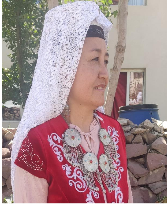
Şekil 35: Sılsıla takan evli kadın