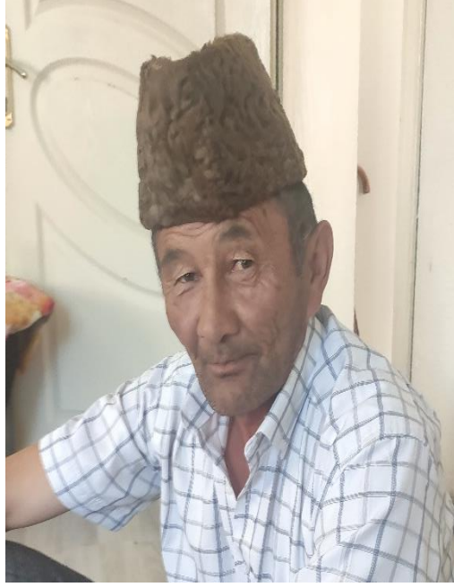
Şekil 80: Karzai tumag takan bir Ulupamirli

bir Afgan başlığı olan karzai tumag, Ulupamir köylülerinin Pamir yaylalarından beri kullandığı bir başlıktır.