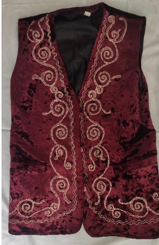
Şekil 55: Günümüzde gelinlerin giydiği mesket