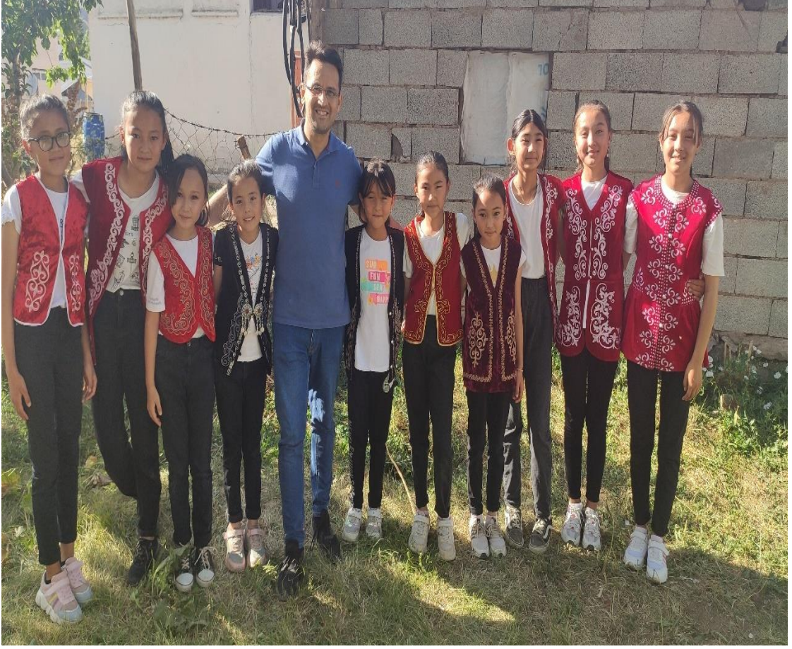
Şekil 96: Giydikleri mesketlerle geleneksel giyim kuşam kültürünü yaşatan kız çocukları

Kız çocuklarının motifler ve işlemlerle süslenmiş mesketler giymeleri, özellikle bayram, düğün vb. özel günlerde geleneksel takılar takmaları, erkek çocukların başlarına taktıkları kalpaklarla geleneksel giyim kuşam kültürünü yetişkinler kadar önemsedikleri ve yaşatmak istedikleri görülmüştür.