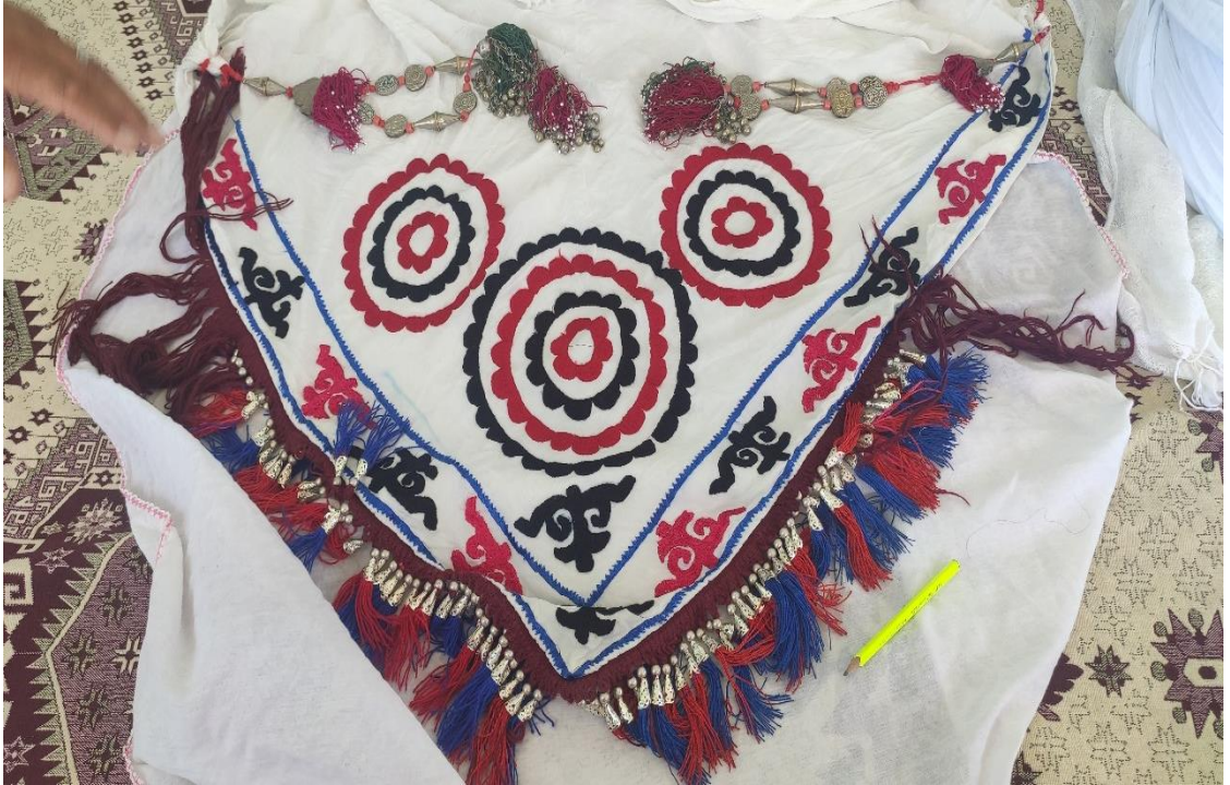
Şekil 36: Duriya, gelin başını oluşturan malzemeler

Ulupamir köyünde yaşayan Kırgız Türklerinde gelin, kendini başlığıyla göstermektedir. Zahmetli birkaç işleme takılabilen geleneksel gelin başı, duriya, sılsıla, çaçkep, çaçbak, kalak, pütü gibi malzemelerden ve aksesuarlardan oluşmaktadır. El işlemeli büyük başörtüsüne duriya denilmektedir. Duriyanın uçlarında kırmızı yeşil iplerle süslenmiş, gümüş işlemlerin olduğu aksesuara Ulupamir köyünde colguç adı verilmektedir. Her birinin üzerinde dört mavi ve ortalarında kırmızı taş olan dört yuvarlak el işlemesi gümüş takıya sılsıla denilmektedir. Saçlara takılan uzun aksesuara da çaçbak denilmektedir. Miğfer biçiminde bir şapkayı andıran çaçkep, başı sıkıcı kavrayarak saçları kapatmak için kullanılmaktadır. Çaçkep, başın yanında kulaklıkları olarak dikilmekte, uzun kulaklık bölümlerinin ucunda sagak adlı aksesuarlar bulunmaktadır. “Benim taktığım gelin başında duriya, sılsıla, cackep, cacbak, kalak, pütü var. Bunlar en az 100 yıllık. Çok eski.” (KK08) Gelin başının geleneksel giyim kuşam kültürünün önemli bir ögesi olduğu ve halen kullanıldığı tespit edilmiştir. Fotoğraflardaki gelin başı örtülerinin ve kullanılan takıların en az 100 yıllık olduğu ve Pamir yaylasında kullanıldığı gibi Ulupamir köyünde de kullanıldığı kaynak kişi tarafından belirtilmiştir.