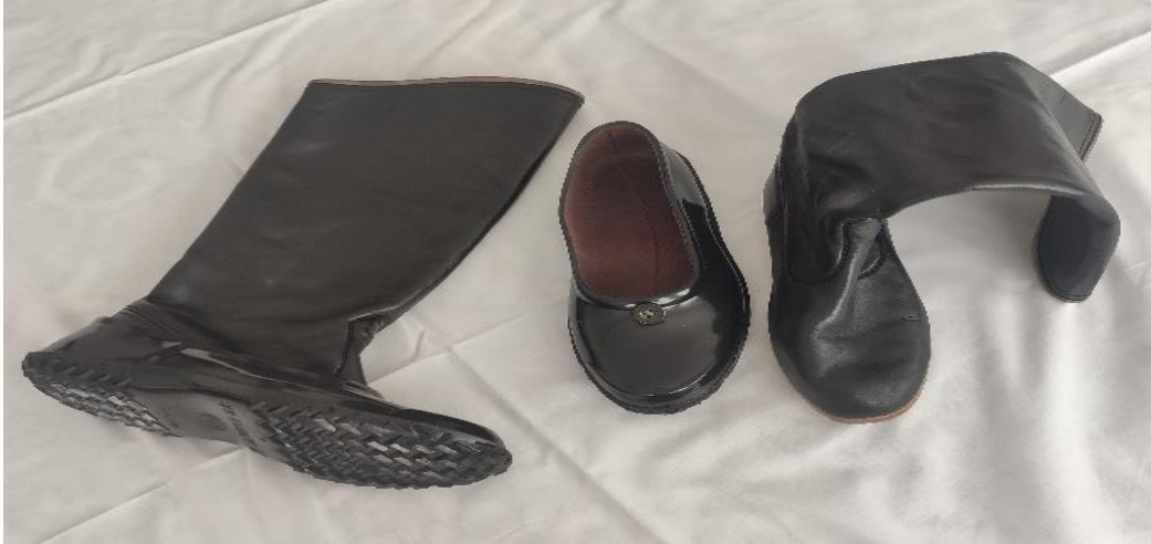
Şekil 86: Çizme