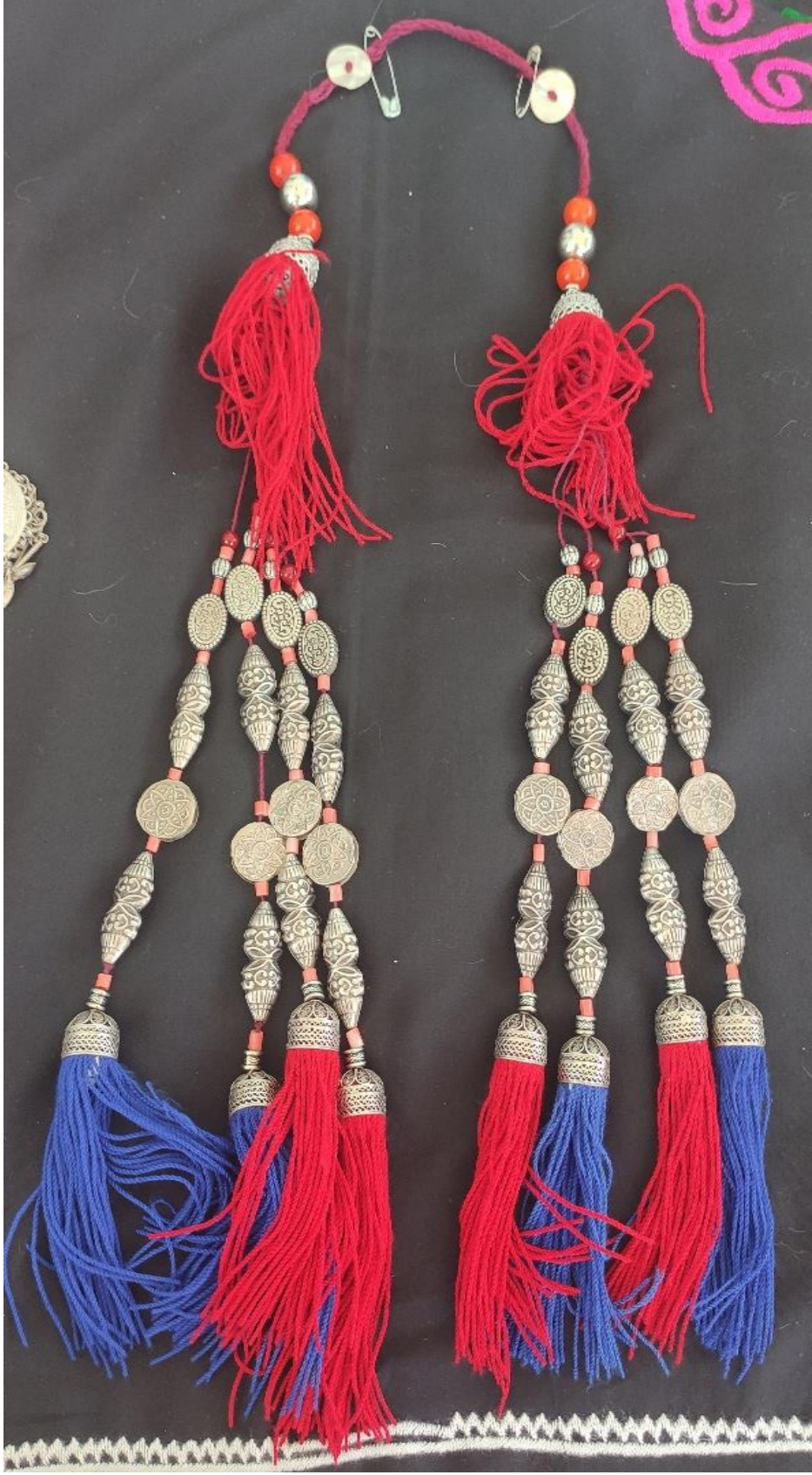
Şekil 41: Gelin saçına takılan aksesuar çaçbak