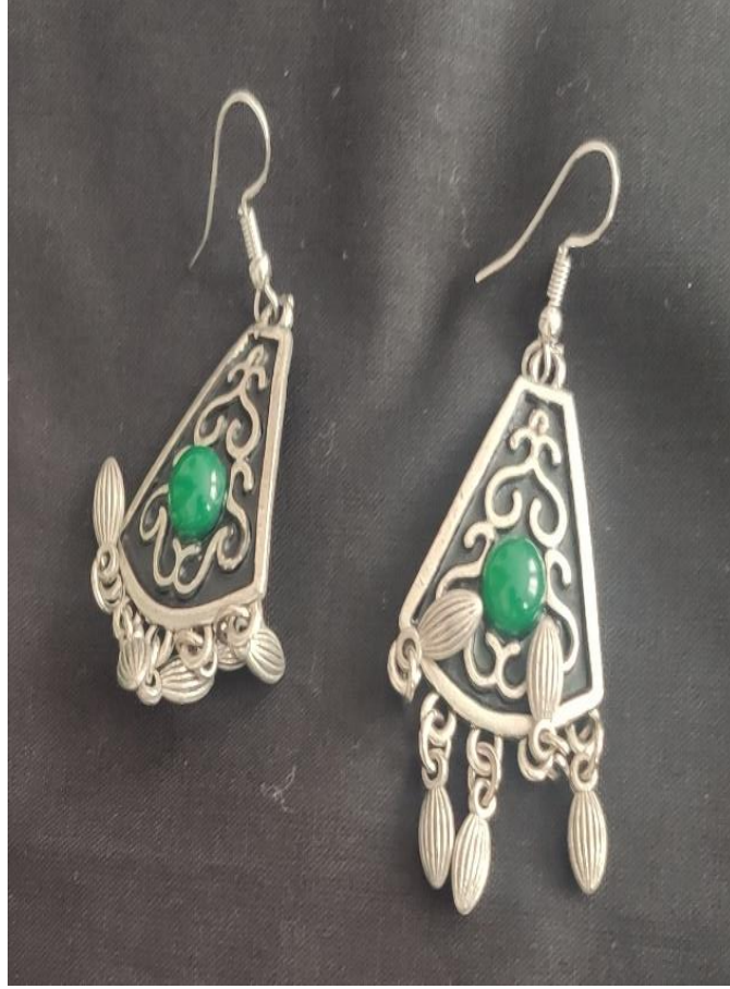
Şekil 32: Yeşil taşlı işlemeli küpe