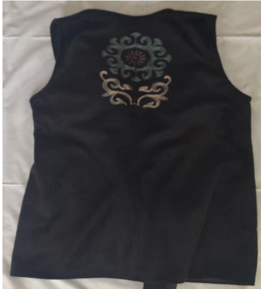
Şekil 57: Kaynanaların giydiği mesket (arka)