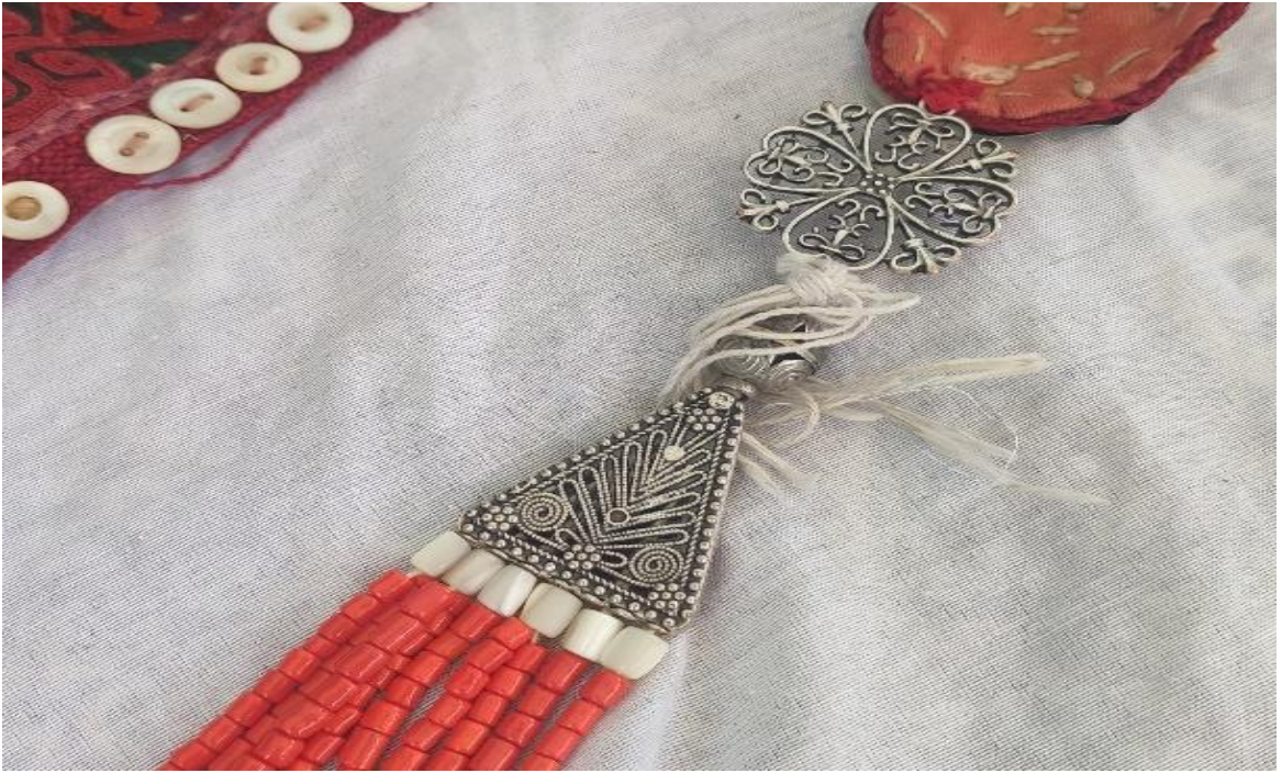
Şekil 43: Çaçkep'in aksesuarlarından püçü