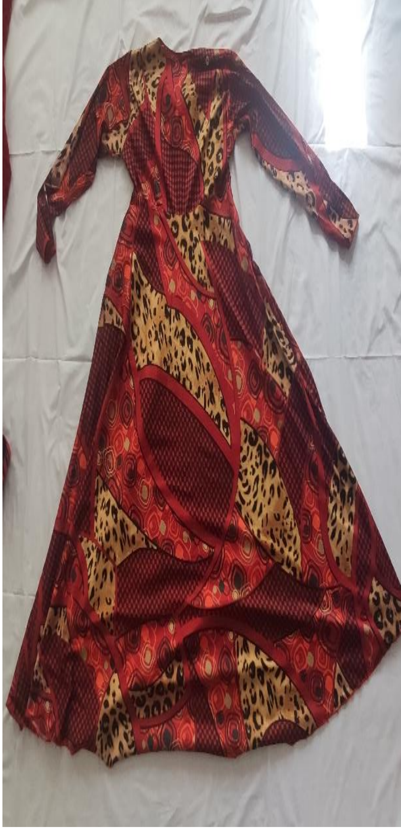
Şekil 49: Gelinlerin giydiği köynek (arka)