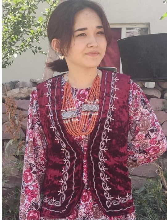
Şekil 22: Genç bir kızda geleneksel aksesuar