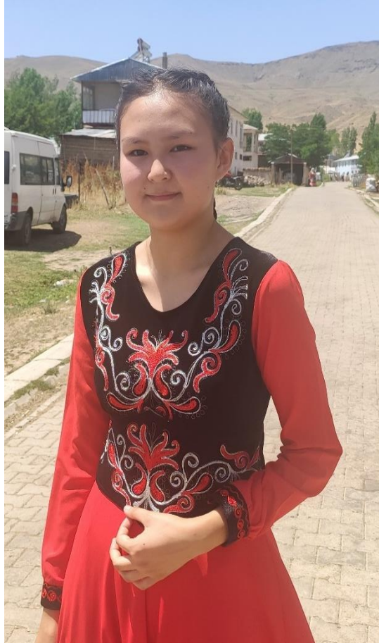
Şekil 9: Motif işlemeli boydan elbise

Bir bayan elbise diktireceği zaman elbiseyi kendine göre ayarlayıp gelir. Elbiselerin üzerine özellikle işlemeli giysiler giyilir. O işlemeli ceketlerde kumaş seçilirken elbiseye uygun, işlemeyi gösterecek şekilde seçilir. O ceketin adı mesket denir. Kolsuzdur. Dışı bir metre kadife kumaştandır, içi de bir metre keten kumaştandır dikilir. Astar olarak keten kullanılır. Yaka bölümü düz olur. Eskiden yakalar ceket gibi kıvrılırdı, şimdi artık düz dikiliyor. Eskiden ceket gibi olur, üzerinde süslü düğmeleri olurdu şimdi düğmeler kalktı. Yakalar v yaka şeklinde düz. Sadeleşti. Düz bir elbise isterseniz iki buçuk, etekleri bol isterse üç, daha şatafatlı olsun dersanız dört metre kumaş kullanılır. Kişinin isteğine göre en fazla dört metre. İnce kumaşların içine astar dikilir ama daha kalın gösterişli kumaşlar kullanılır. Gençler daha çok işleme ve süs kullanır. İşlemelerde ve süslemelerde bize özel şekiller kullanılır. Örneğin koçkorok ve tespayık derler. Kollara, yaka kısmından aşağı doğru yapılır. Gelin olacak kızlar, nişanlı kızlar, yeni gelinler ve genç kızlar süslemeye daha çok önem verir, daha çok kullanırlar. Şimdilerde kıyafetlerin üzerine işlemeli kemerler takarlar, eskiden pek yoktu. İşlemelerde nakış olan da var, kumaş olarak yapıştırılan da var. (KK02)