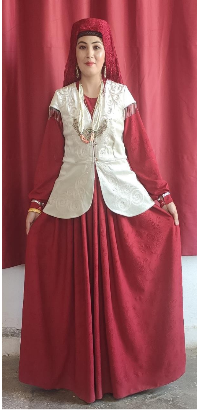
Şekil 58: Nişan giysisi (ön)

Ulupamir köyünde yaşayan Kırgız Türklerinde nişanda kızların, geleneksel giyim kuşam kültürünü yansıtan boydan elbise giydiği, şapag taktığı, kültüre özgü takı ve aksesuarlar kullandığı, mesket giydiği saptanmıştır.