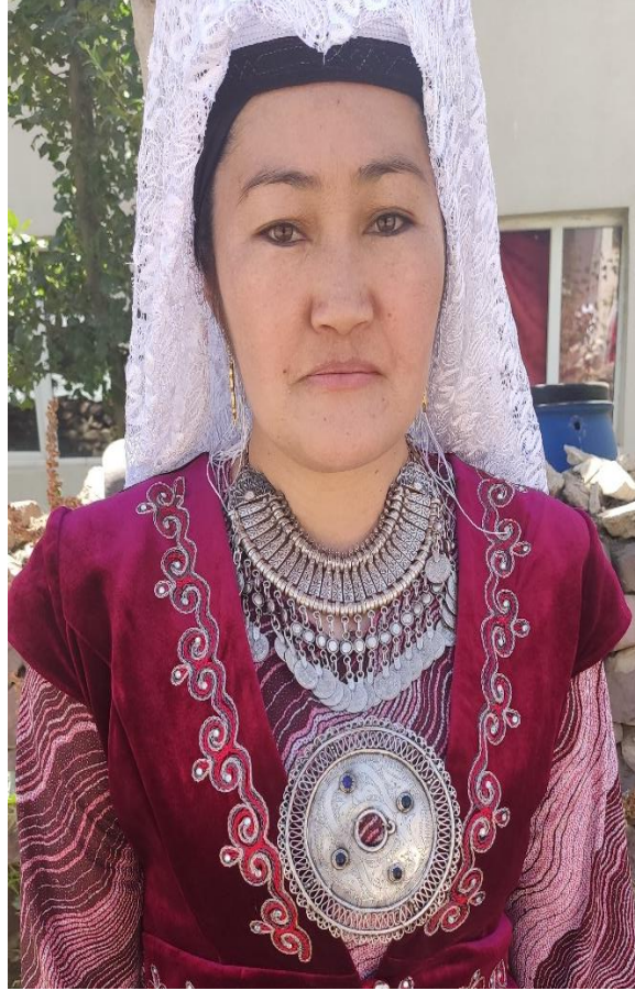
Şekil 34: Gerdanlık ve elbiseye takılan aksesuar