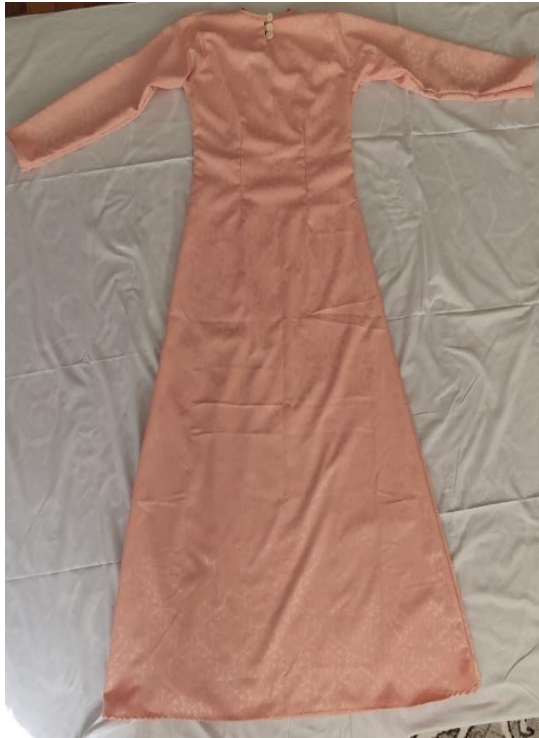
Şekil 61: Nişan boydan elbise (arka)