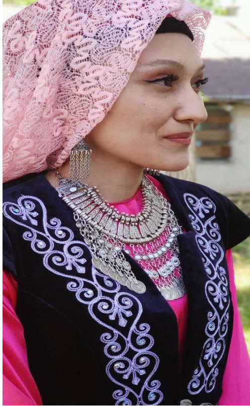
Şekil 25: Gümüş gerdanlık takan nişanlı kız