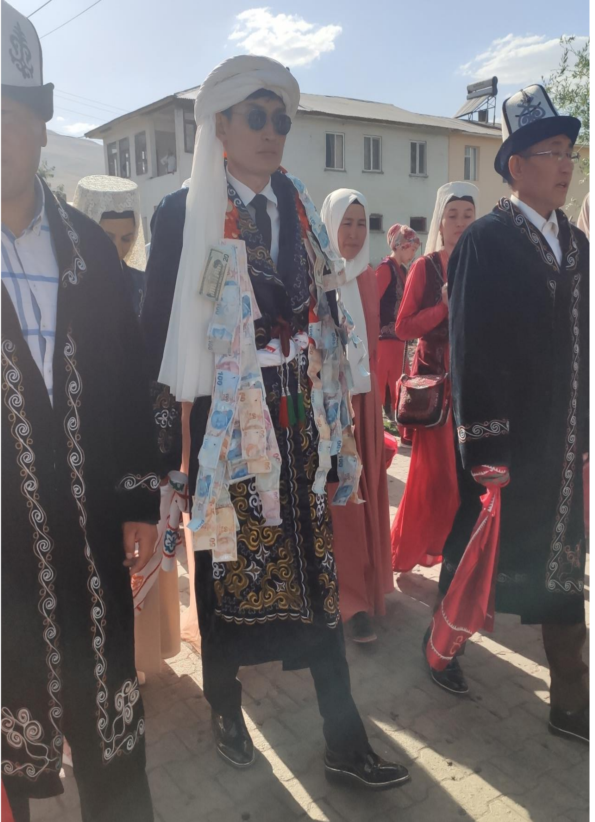
Şekil 92: Damatla birlikte yürüyen sağdıçlar