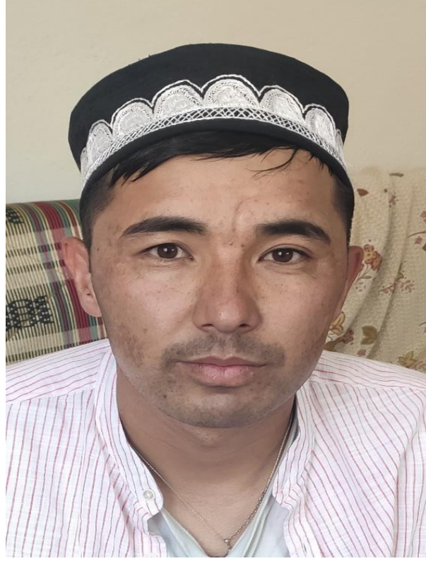
Şekil 90: Yeni damat ve başlığı