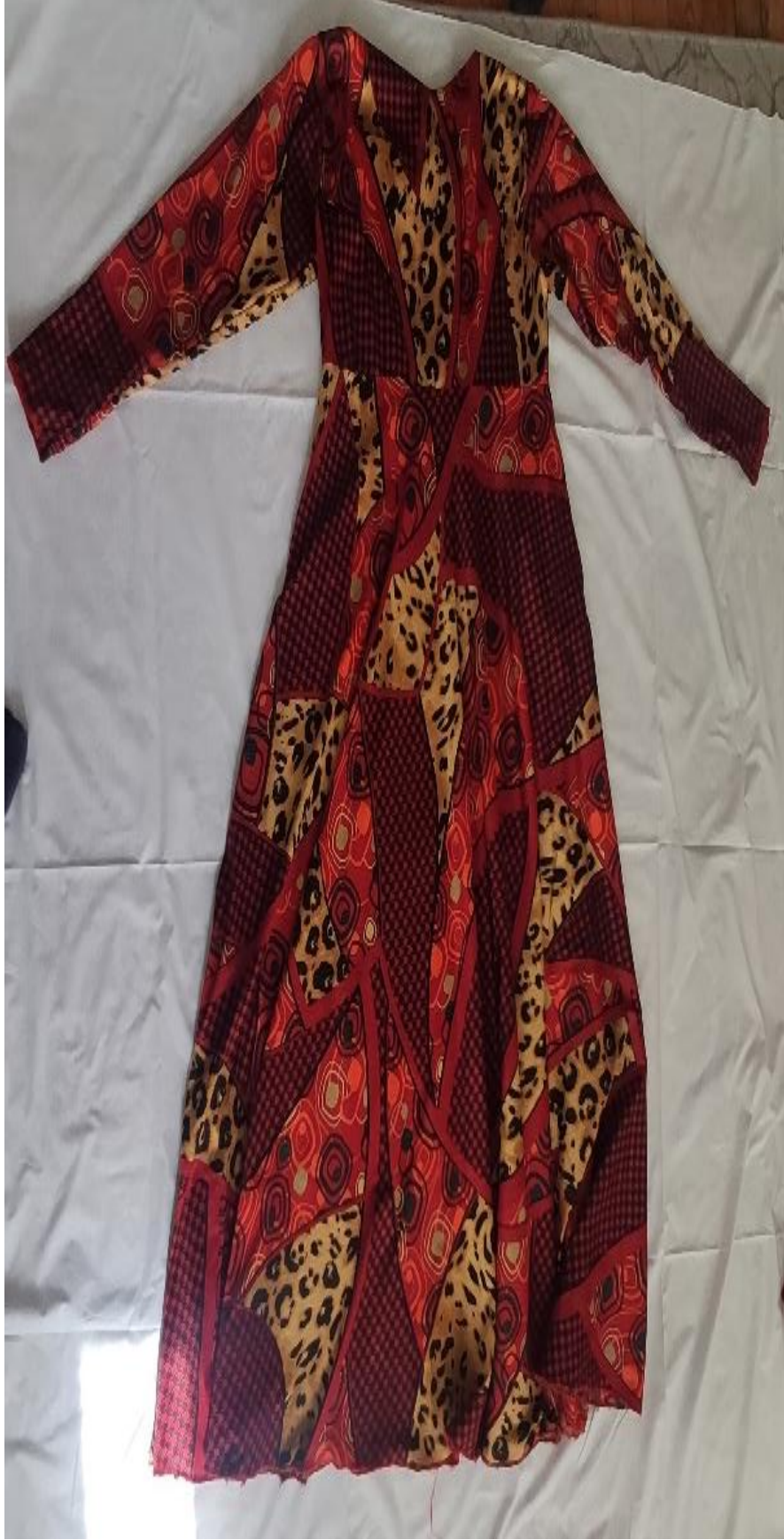
Şekil 48: Gelinlerin giydiği köynek