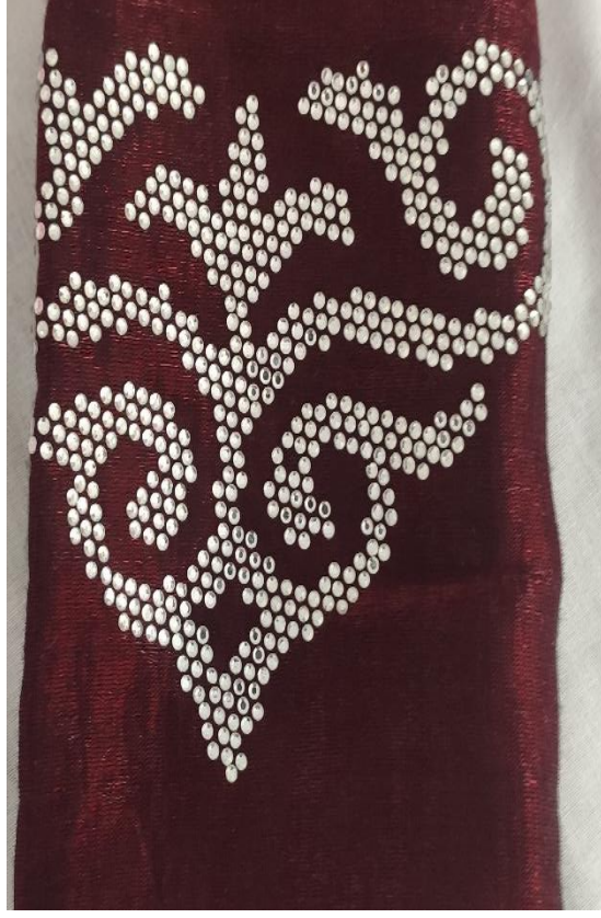
Şekil 73: Gelinlik giysinin kolundaki motif işleme