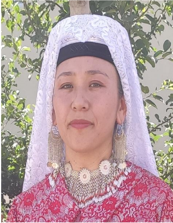
Şekil 29: Gümüş küpeler ve gümüş gerdanlık