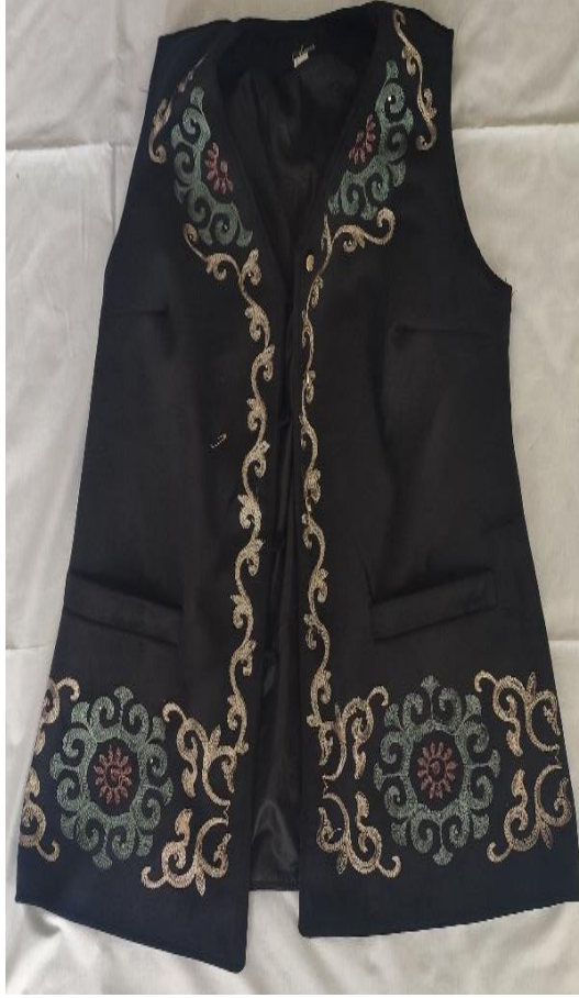
Şekil 56: Kaynanaların giydiği mesket (ön)