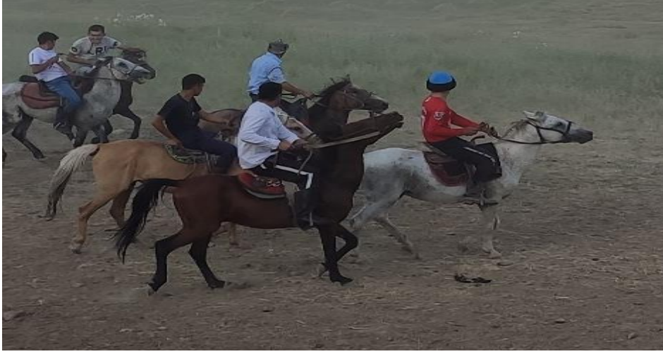
Şekil 85: Kökbörü oyunu sırasında at üstünde geleneksel çizmeleri ile Ulupamir köylüleri

“At üstüneyken çizmeler giyeriz.” (KK03) Ulupamir köyünde yaşayan Kırgız Türklerinde erkeklerin, ayak giyimi konusunda geleneksel giyim kuşam kültürüne uygun giyinmedikleri belirlenmiştir. Yalnızca at binmek için giydikleri çizmelerin, Pamir yaylasından beri kullanılan bir giyim kuşam ögesi olduğu görülmüştür.