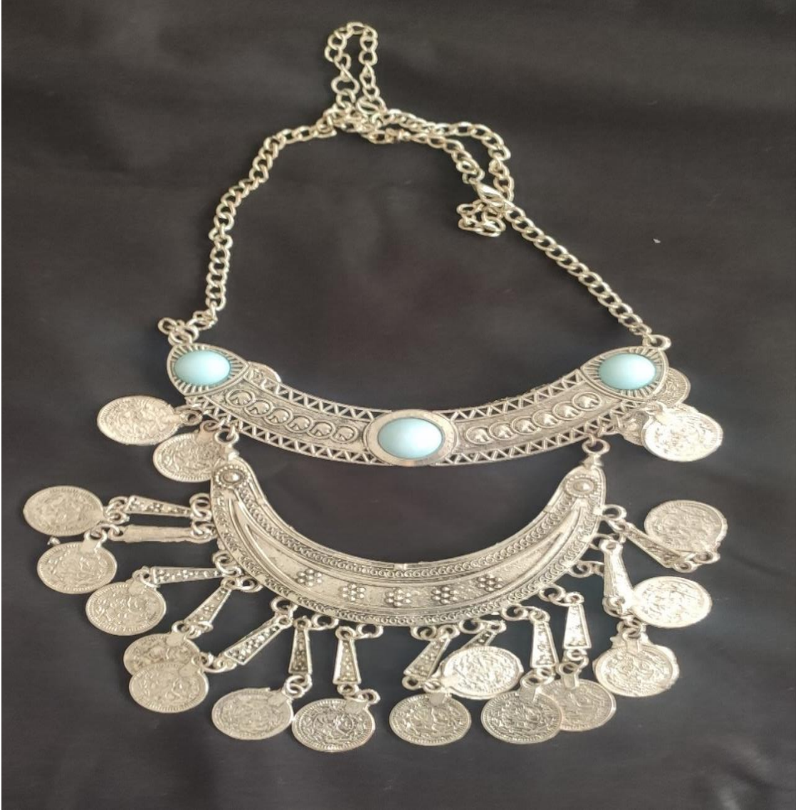
Şekil 17: Gümüş gerdanlık