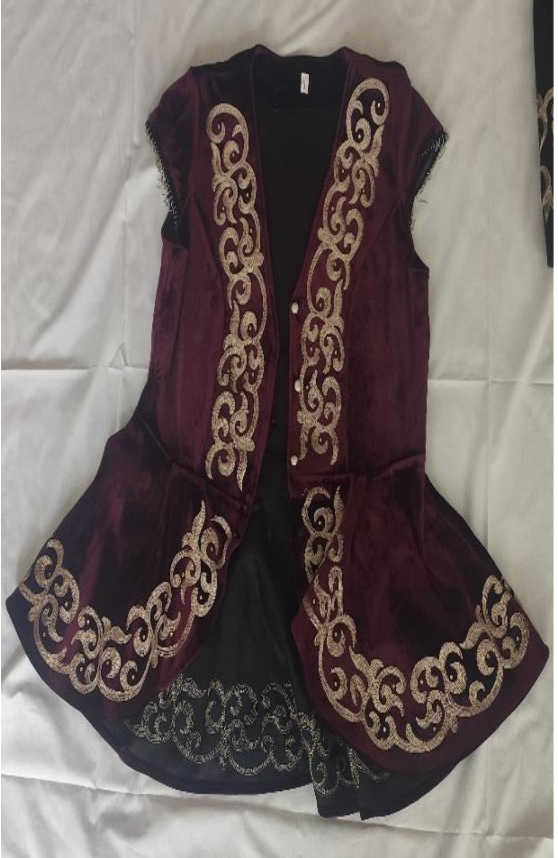
Şekil 45: Gelinlik kızlar için mesket (ön)