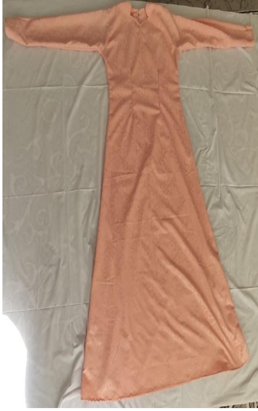
Şekil 60: Nişan boydan elbise (ön)