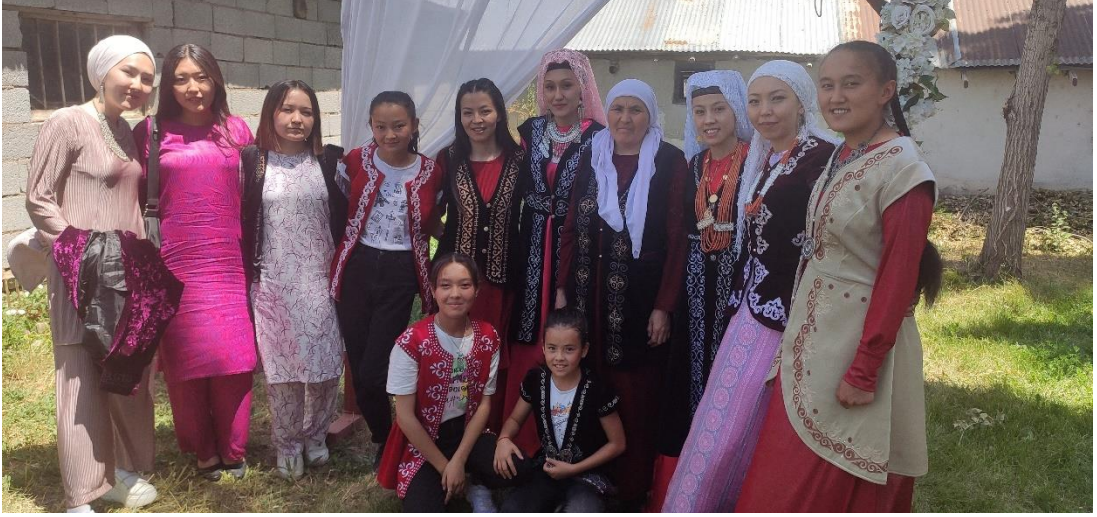
Şekil 13: Boydan elbise ve mesket giyen farklı yaşlardaki kadınlar