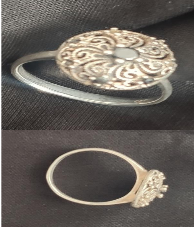
Şekil 33: İşlemeli gümüş yüzük