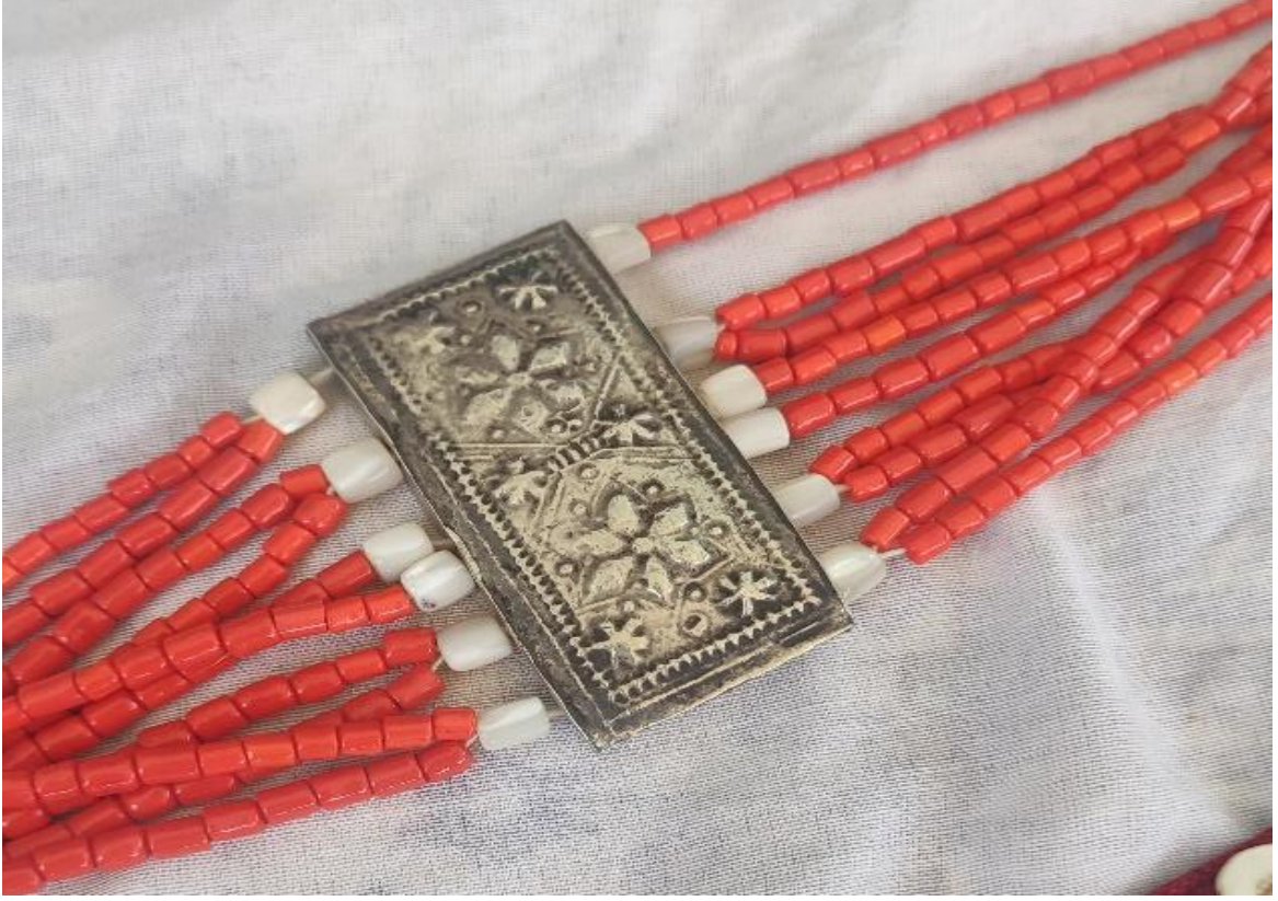
Şekil 42: Çaçkep'in aksesuarlarından püçü