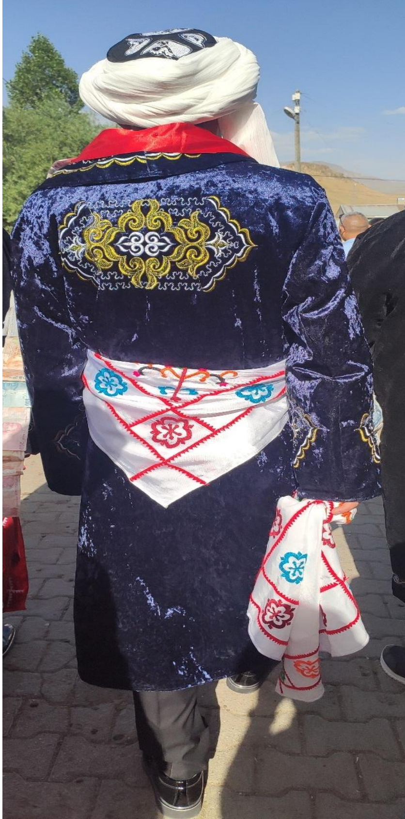
Şekil 88: Damat giyimi