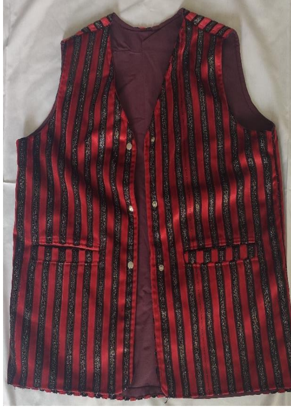
Şekil 46: 1990'lı yıllarda kullanılan gelinlik mesket (ön)