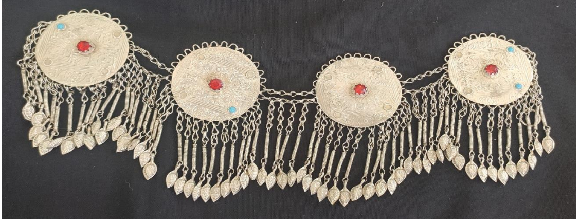
Şekil 16: Sılsıla