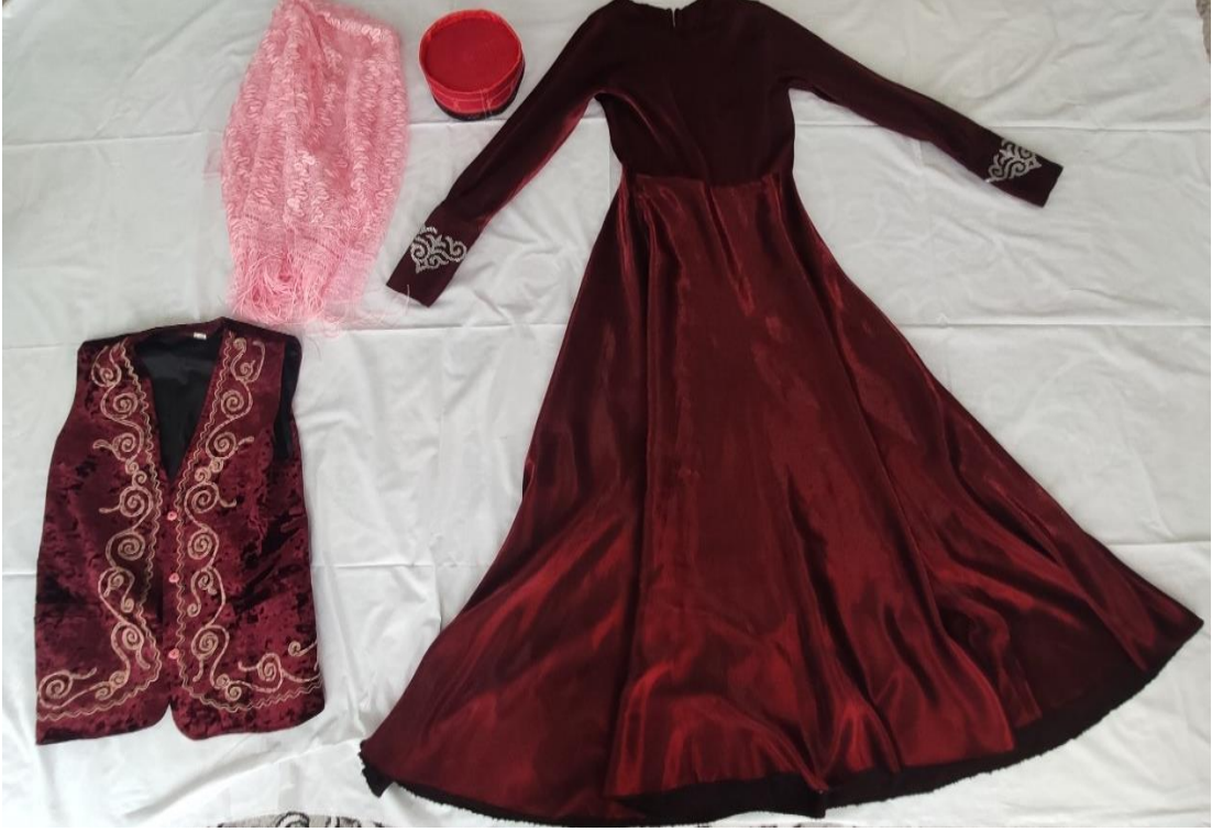
Şekil 54: Günümüzde kullanılan gelinlik