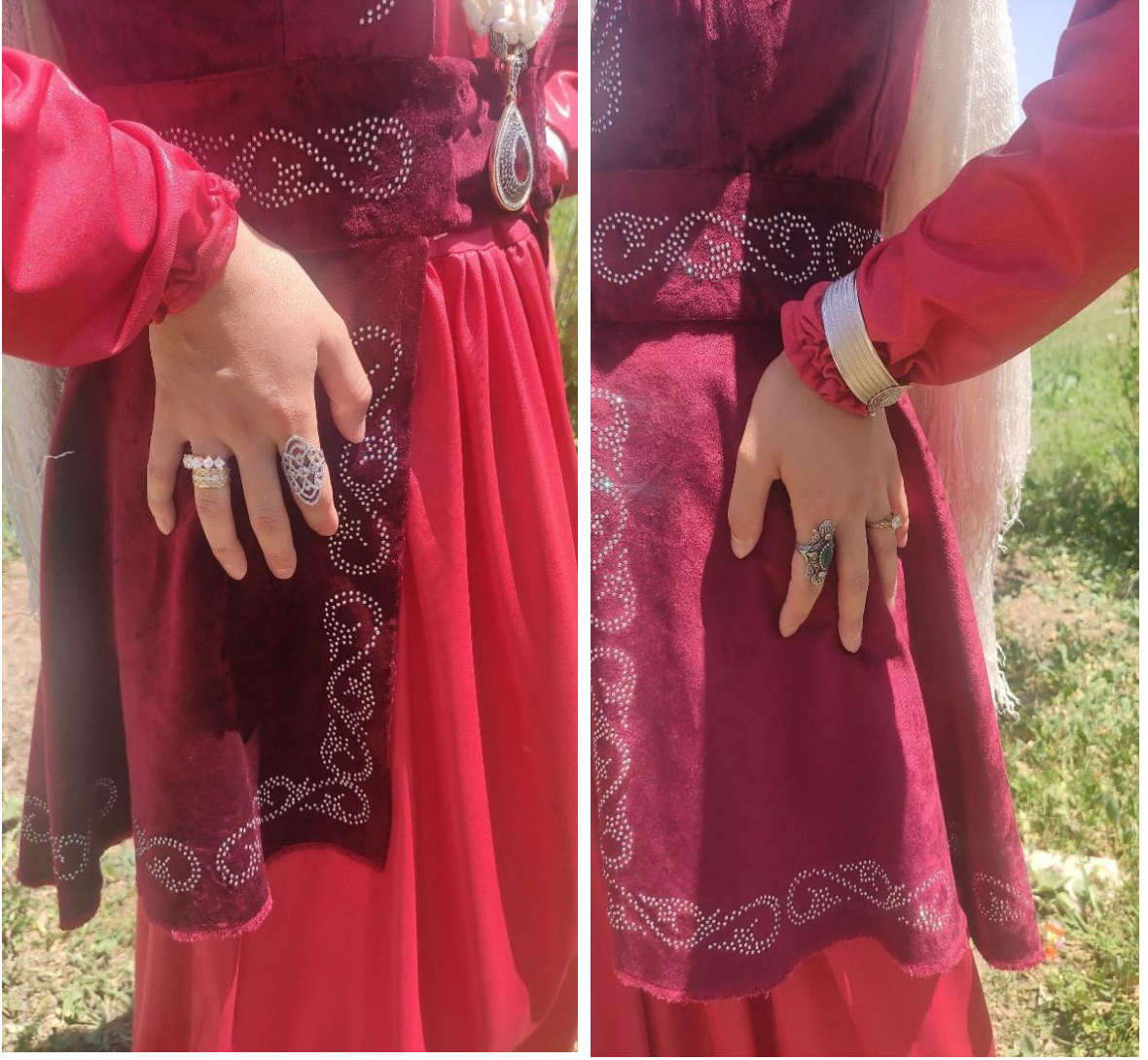
Şekil 70: Yenge (yüzükler ve aksesuarlar)