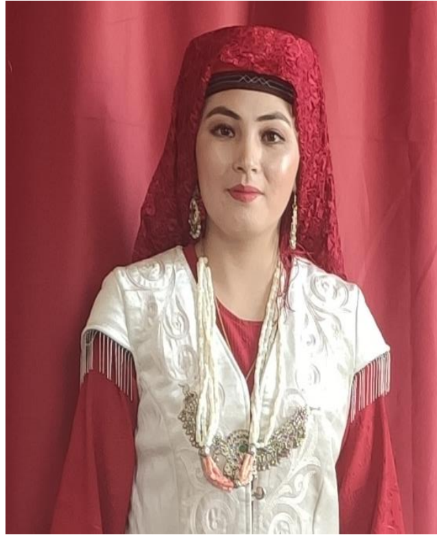
Şekil 21: Nişan töreninde takılarıyla bir genç kız