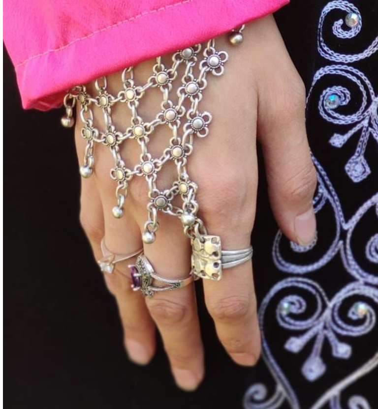
Şekil 27: Yüzükler ve ele takılan aksesuarlar