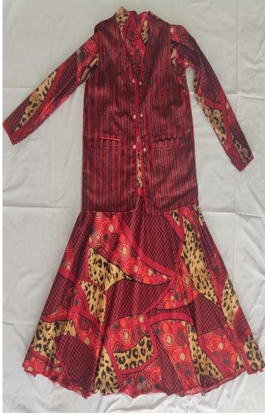
Şekil 50: Mesket ve eski gelin köyneği