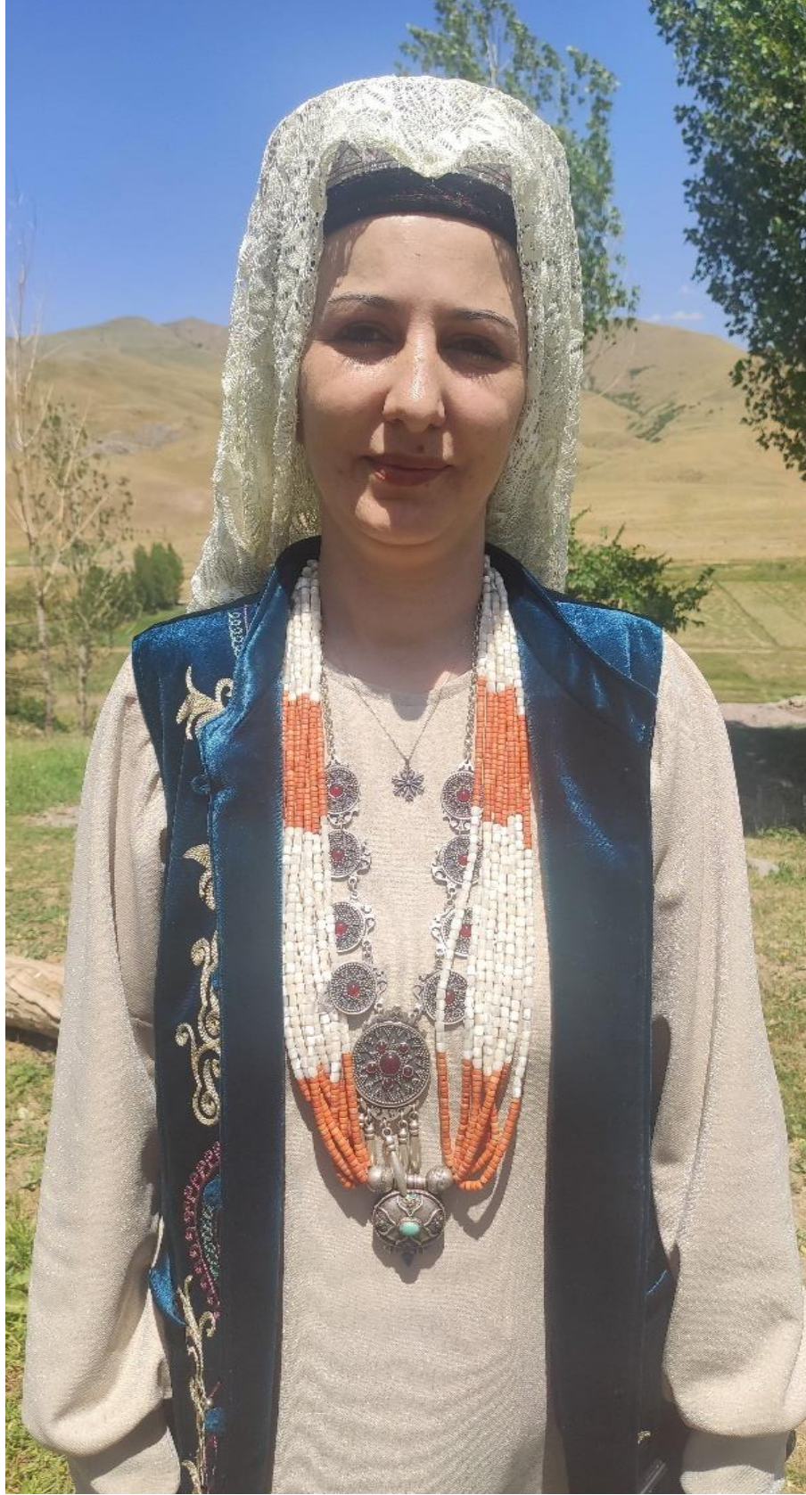
Şekil 67: Yenge (şapag, mesket, gümüş takılar, boncuklu sedef kolye)