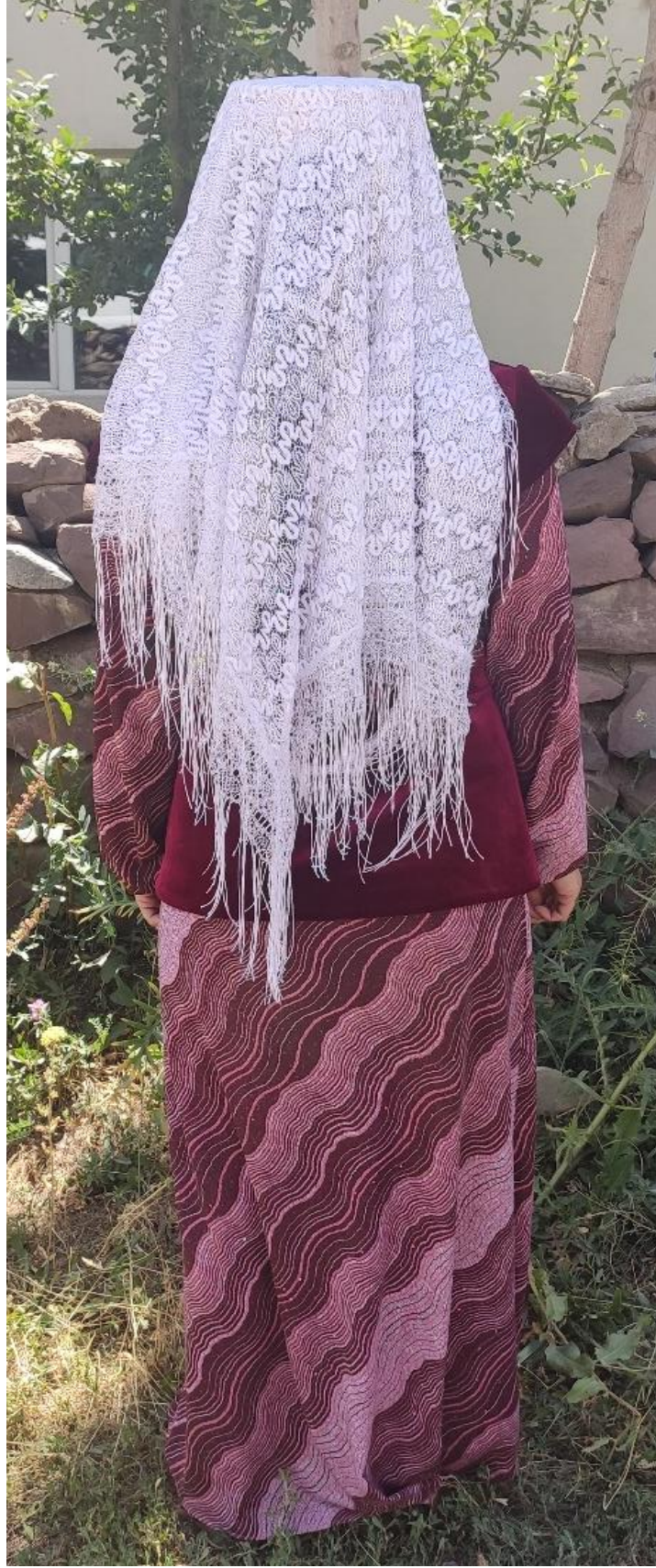
Şekil 12: Mesket giyen bir kadın (arka)