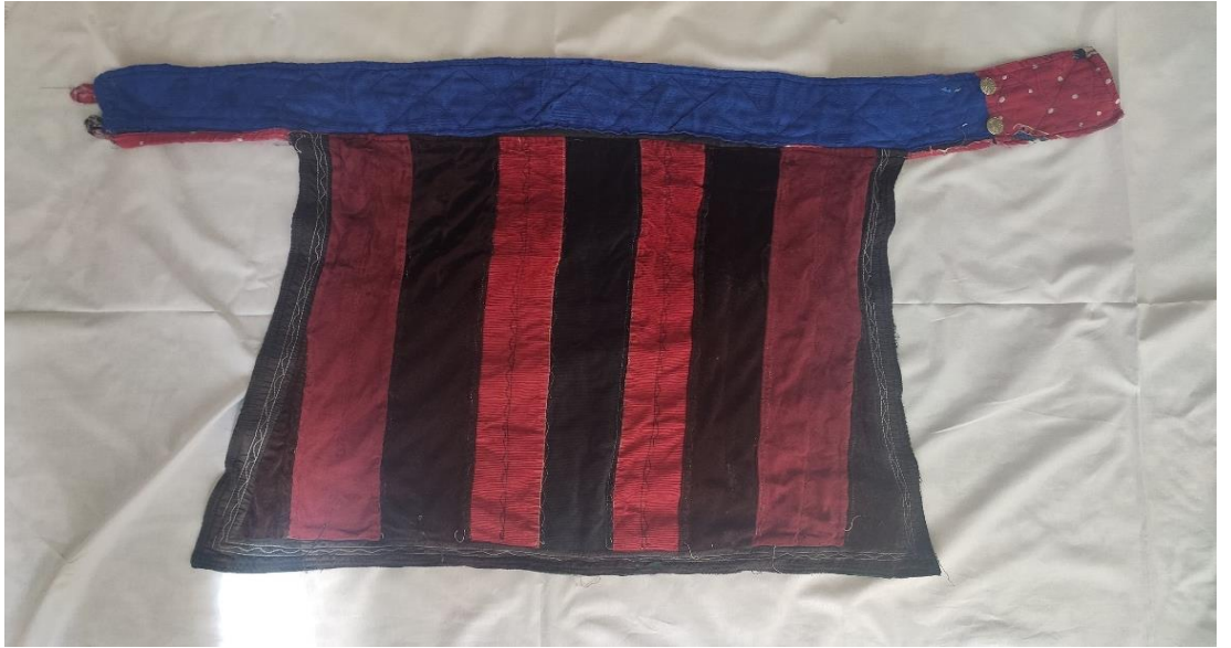
Şekil 15: Beldemçi

Beldemçinin, Kırgız Türklerinin geleneksel giyim kuşam öğelerinin biri olduğu görülmektedir. “Eski zamanlarda bu elbise türünü askerlerin vücudun alt kısmını korumak için giydiğine dair görüşler mevcuttur. (...) Manas Destanında beldemçi isminde bir kuşak hakkında satırlar bulunmaktadır.” (Klavdia & Aydarberk, 2004, s. 12) Afganistan’ın Pamir yaylasından göç eden Ulupamir köyünde yaşayan yaşlı kadınların geleneksel giyim kuşam kültür ögesi beldemçiyi kullanarak geleneği sürdürdükleri görülmektedir.