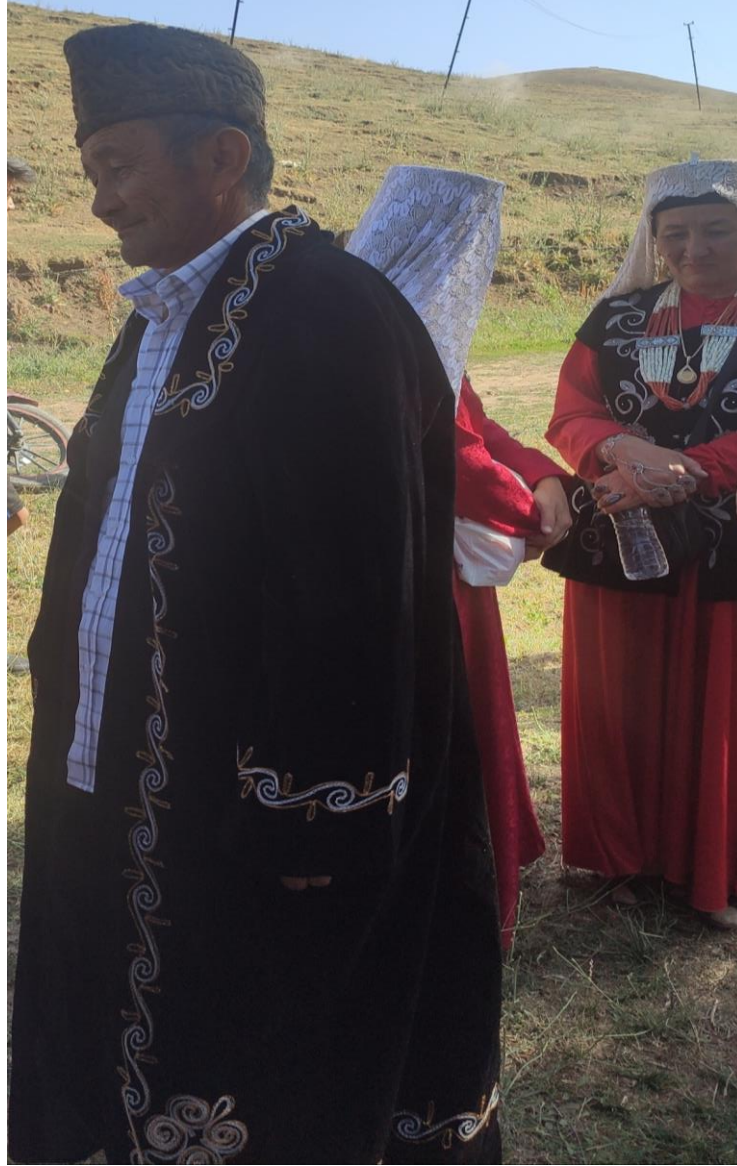
Şekil 93: Başında karzai tumag ve işlemeli çapanı ile bir sağdıç