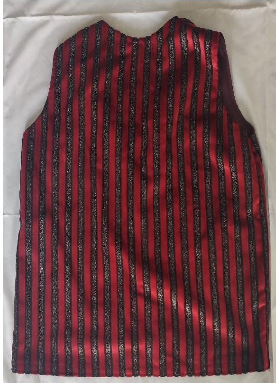
Şekil 47: 1990'lı yıllarda kullanılan gelinlik mesket (arka)