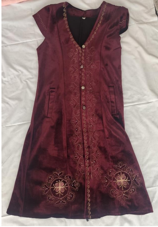
Şekil 64: Nişanda giyilen (ön)