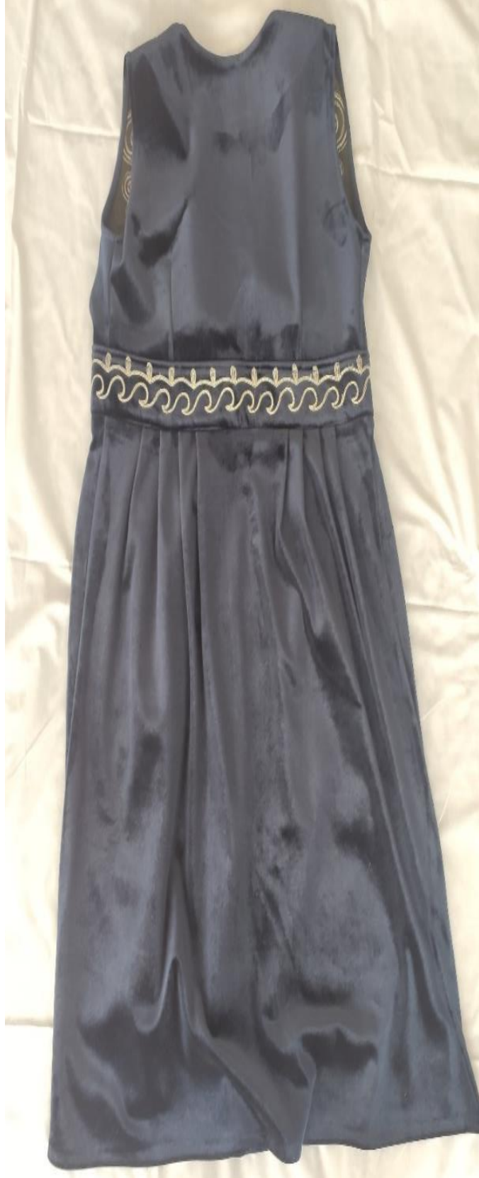
Şekil 63: Nişanda giyilen mesket (arka)