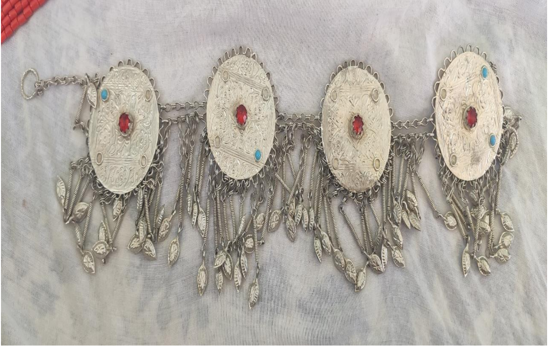
Şekil 39: Sılsıla, gelin başı için