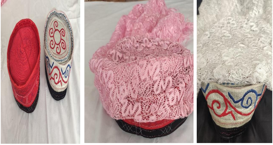
Şekil 4: Kadın başlığı “şapag”