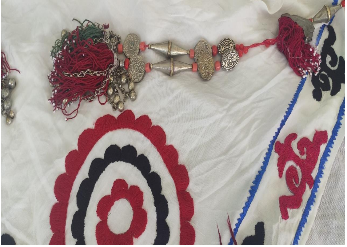
Şekil 38: Colguç, duriyanın ucundaki aksesuar