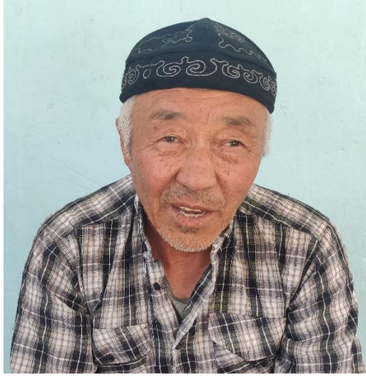
Şekil 82: Namazkulların taktıkları takke

başlarına takke niyetine Kırgız Türklerine özgü motif ve nakışlarla işlenmiş bir başlık kullanmaktadırlar.