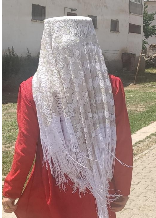
Şekil 7: Evli kadınların kullandığı başlık (arka)