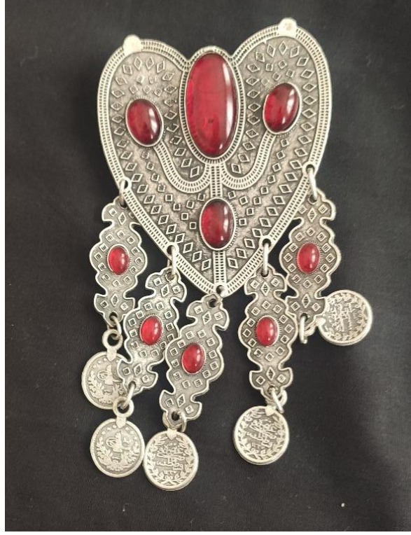
Şekil 18 : Taşlı, işlemeli gümüş elbise aksesuarı (ön)