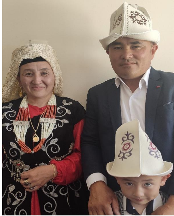
Şekil 79: Üzerinde motifler olan kalpak takan baba ve çocuğu

“Karzai tumag denir Kırgızca. Bu Afganistan'a özgü bir şapaktır. Pamir yaylasından beri kullanılır. Oradan getirdiğimiz bir başlık. Özel günlerde kullanılır. Afgan başlığıdır. Tetiri (ters) başlık, iki tarafı da kullanıldığından bu ad verilmiştir.” (KK03) Deriden yapılan başlığa tumag denilmektedir. Karzai tumag adlı başlık, Ulupamir köyünde yaşayan Kırgız Türkleri tarafından halen kullanılmaktadır. Aslında