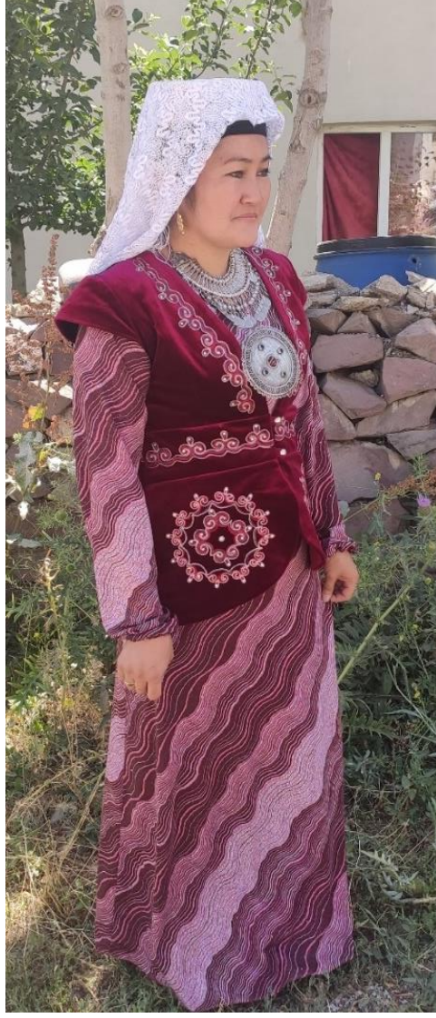
Şekil 10: Boydan elbise ve mesket giyen bir kadın

Uluşpamir köyünde yaşıyan Kırgız Türkleri, geleneksel giyim kuşam kültürünün bir parçası olan motifleri ve mesket adlı ceketi bırakmadıkları görülmektedir. Yaşlara göre motiflerin sayısı, motiflerin işleme yöntemleri, elbiselerin yaka dikimi yıllar içinde deęişse de bir kültür olarak kullanılmaya devam etmektedir. Uluşpamir köylüleri özel günlerde ve günlük hayatta bu geleneksel giyim kuşam ögesini bırakmamışlardır.