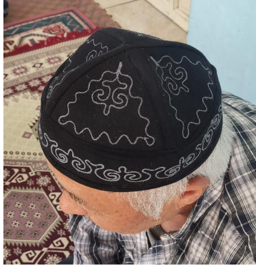
Şekil 83: Motif işlenmiş bir takke

Ulupamir köyünde yaşayan Kırgız Türklerinde erkek başlıklarının Ulupamir köyünün geleneksel giyim kuşam geleneğini yansıttığı görülmüştür. Günlük yaşamda Ulupamir köyünde yaşayan erkeklerin, geleneksel giyim kuşam kültür öğelerinden sadece başlıkları kullandıkları tespit edilmiştir.