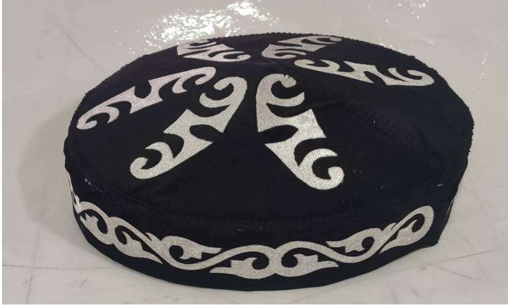
Şekil 89: Damat başlığı

Ulupamir köyünde yaşayan Kırgız Türklerinde düğün yapan, yeni damat olan kişiler düğünde damat olduklarını gösteren giyim kuşam kültürü öğelerini üzerinde taşımanın yanında düğünden sonra da damat olduklarını gösteren başlıklar giymektedirler. Bu damat başlıkları, kız tarafı akrabalarınca el işçiliği ile nakışlar ve motiflerle süslenmekte ve damat için özel olarak hazırlanmaktadır. “Gelinin annesi izin verene kadar damat bu başlığı başından çıkaramaz.” (KK03) Kendisi için özel olarak hazırlanan başlığı takan damat, düğünden sonra kız tarafına olan saygısından dolayı başlığını hiç çıkarmamaktadır. Gelinin annesi yani kaynanası izin verene kadar damat başlıklarının aylarca hatta yıllarca damadın başında durduğu görülmüştür.