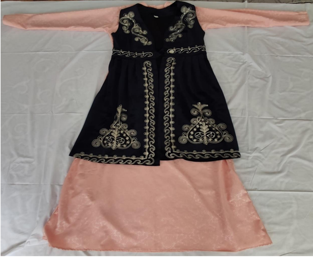
Şekil 66: Nişan elbisesi ve mesket