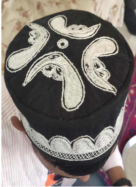
Şekil 91: Damat başlığı ve el işleme motifleri