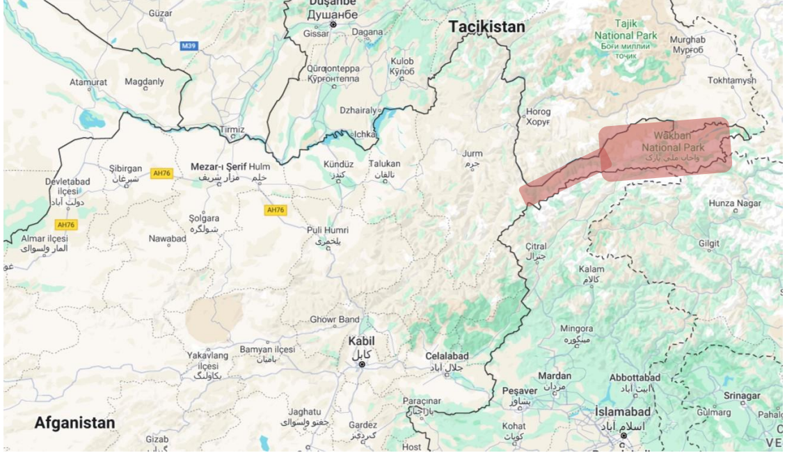
Şekil 1 : Pamir yaylaları 71°-76° doğu boylamları ve 37°-40° kuzey enlemleri Google Maps

“Pamir, büyük bölümü Tacikistan ve Kırgızistan’da, daha küçük bölümü Çin ve Afganistan’da kalan; Orta Asya’nın Türk ve Türk olmayan halkları tarafından meskûn edilen dağlık bir bölgedir.” (Bapaeva, 2015, s. 57) Haritada Wakhan Koridoru olarak adlandırılan Pamir Dağları; Himalayalar, Hindukuş ve Tanrı dağlarının kesiştiği noktada yer almaktadır. “Afgan Pamir’i veya Wakhan koridoru olarak bilinen bölge Afganistan’ın doğusuna doğru uzanmaktadır.” (Doğan, 2019, s. 24) Pamir coğrafyası yüksek zirveler, geniş yaylalar ve derin vadilerle çevreli bulunmaktadır. “Pamir, 7 bin metrelik yüksekliğe sahip birden fazla dağı içeren bir bölgenin adıdır. Asya’daki yüksek dağların bir arada toplandığı 'Asya'nın Damı' ve 'Dağların Atası' olarak adlandırılan bir yerleşim bölgesindedir.” (Baran, 2014, s. 44)