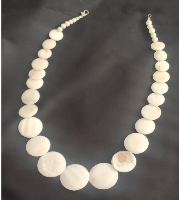
Şekil 31: Hakıg gerdanlık