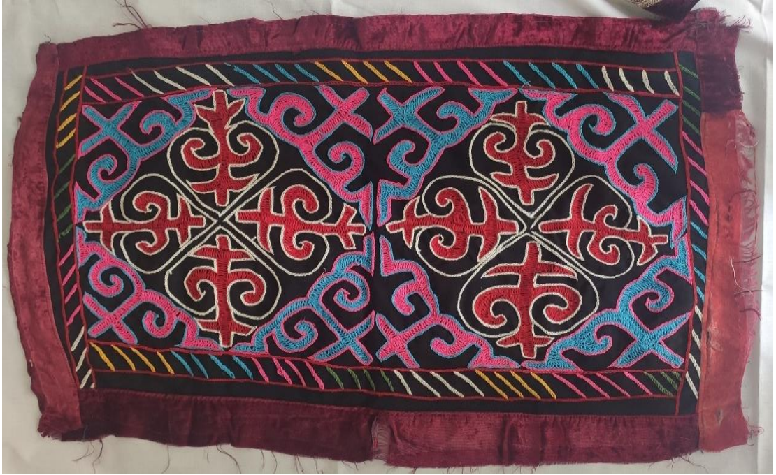
Şekil 74: Motiflerle süslenmiş giyim kuşam ögesi