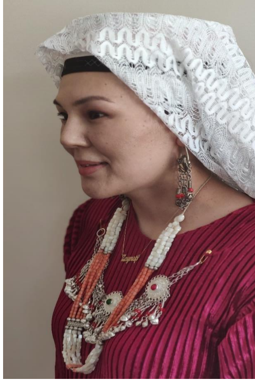
Şekil 24: Sılsıla, küpe ve sedefli boncuklu kolye takan bir kadın