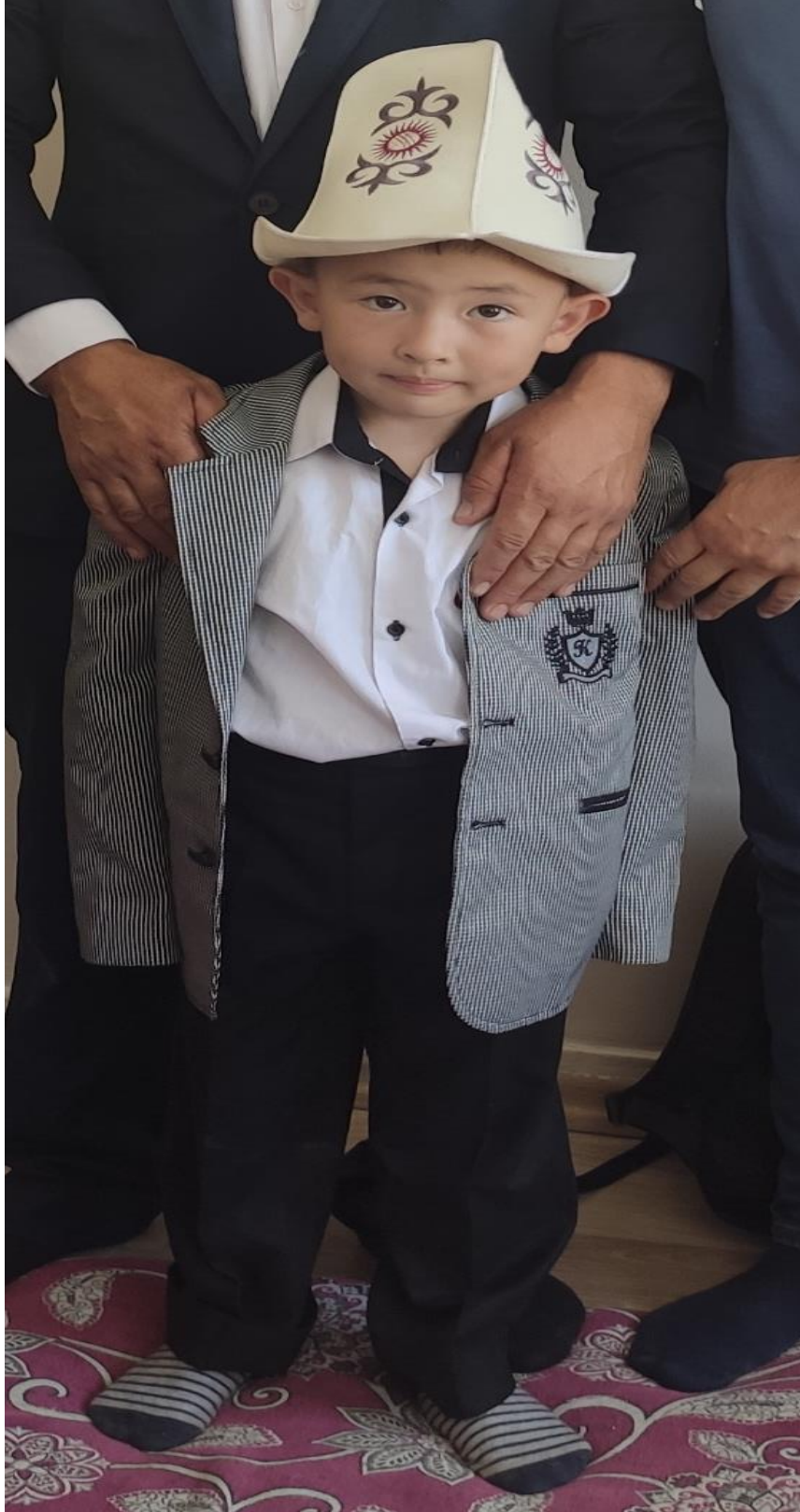
Şekil 94: Geleneksel başlığıyla bir erkek çocuk