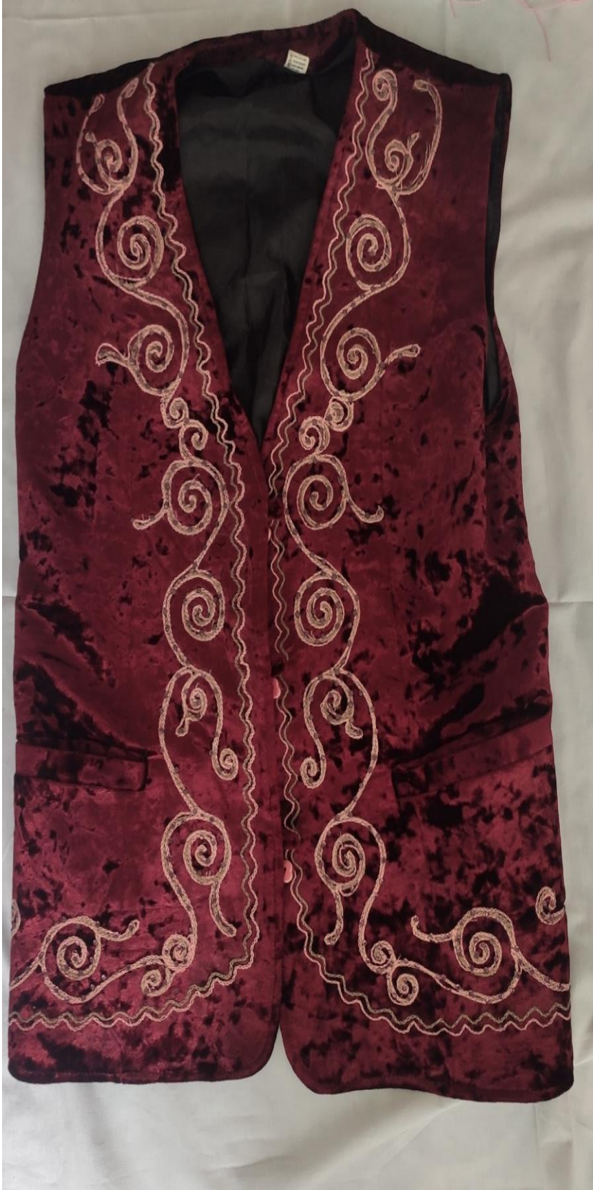
Şekil 75: Gelin mesketi üzerindeki motifler