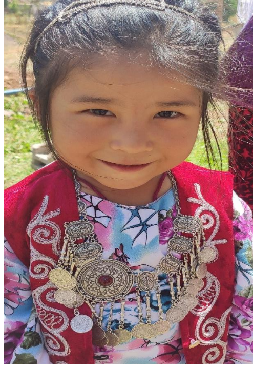
Şekil 23: Küçük bir çocukta geleneksel takılar