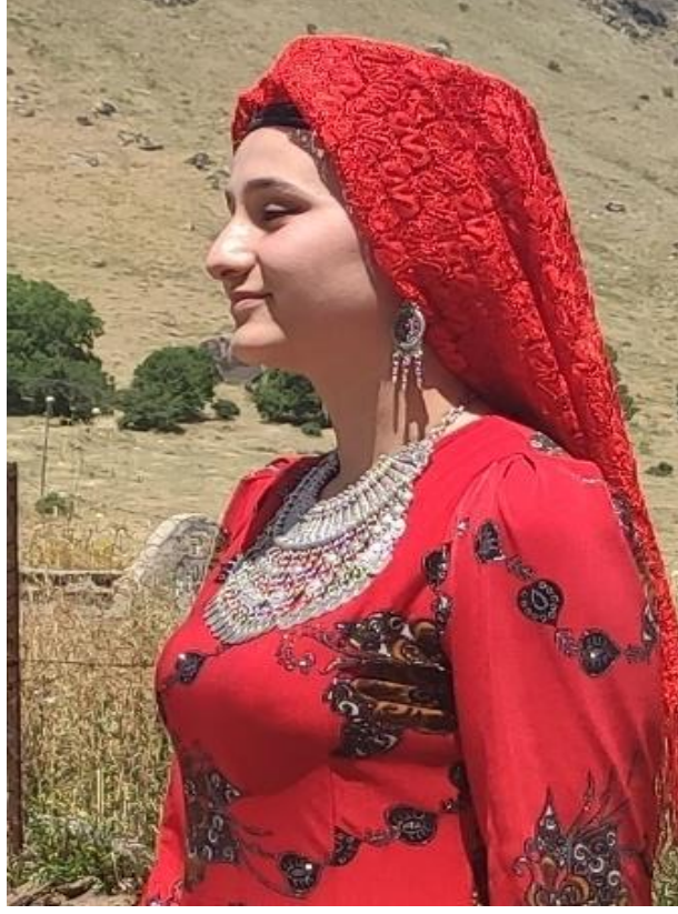
Şekil 20: Gümüş küpe ve gerdanlık takan genç kız