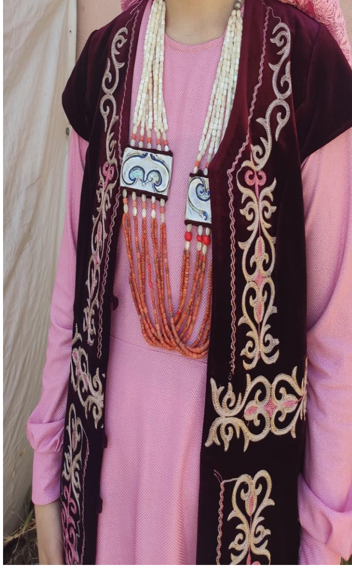
Şekil 72: Mesket üzerindeki geleneksel motifler