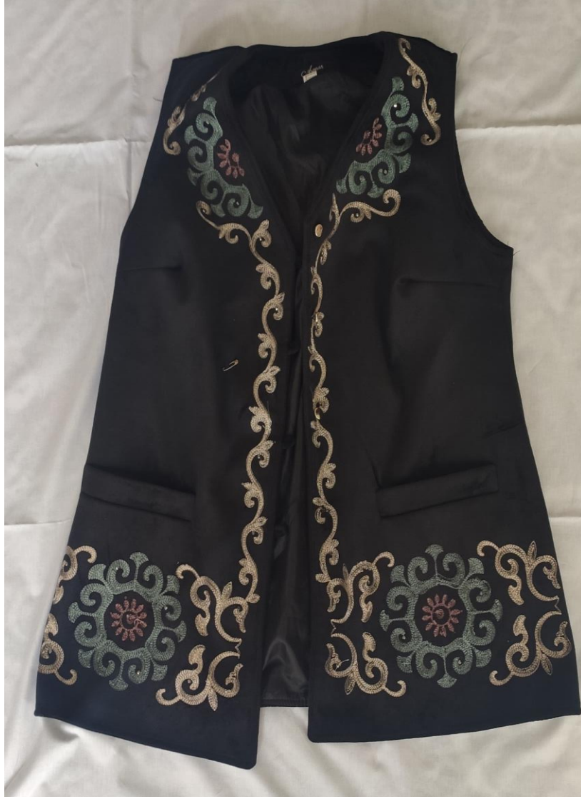
Şekil 76 Gelin mesketi ve geleneksel motifler