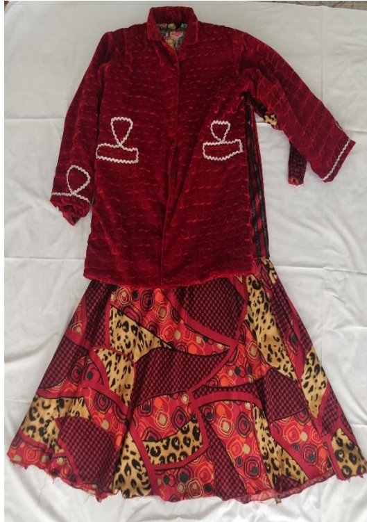
Şekil 51: Kezmur ve eski gelin köyneği