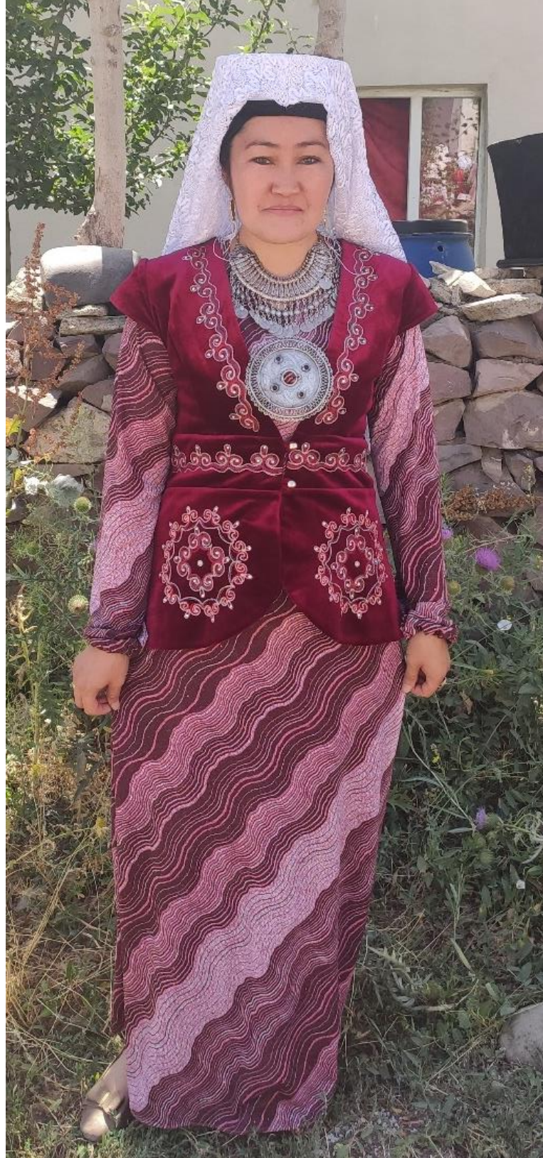
Şekil 11: Mesket giyen bir kadın (ön)