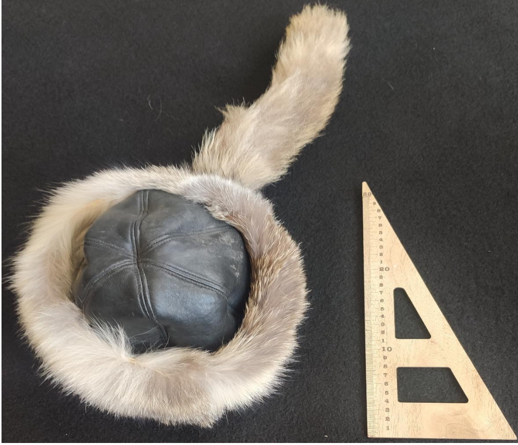
Şekil 77: Tebetey adlı başlık örneđi

olarak geçmektedir. (Arıkođlu, Alimova, Askarova, & Selçuk, 2018) Ulupamir köyünde yapılan araştırma sırasında tebetey takan bir kişiye rastlanılmamıştır. Bunda araştırmanın yaz aylarında yapılmasının etkisi olduğu düşünölmektedir.