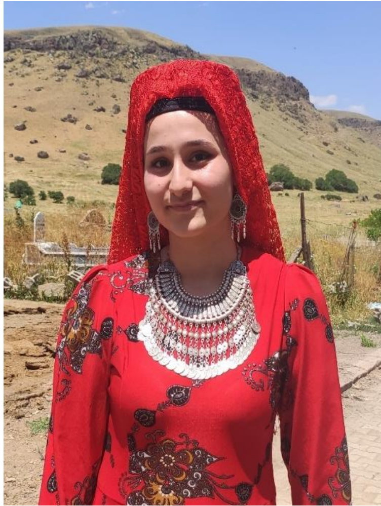
Şekil 5: Genç kız başlığı