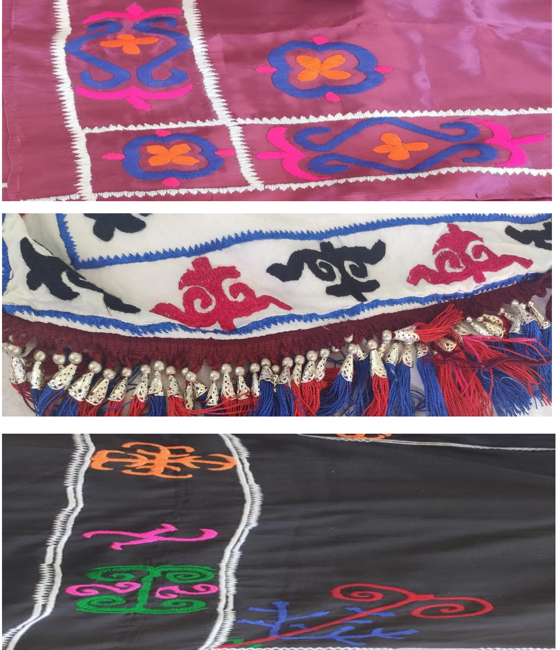
Şekil 71: : Motif ve işlemlerle süslenmiş giyim kuşam öğeleri

Kollara, yaka kısmından aşağı doğru yapılır.” (KK02) Ulupamir köyünde yaşayan Kırgız Türklerinde motif ve işleme olarak daha çok koçkorok ve tespayık kullanıldığı tespit edilmiştir.