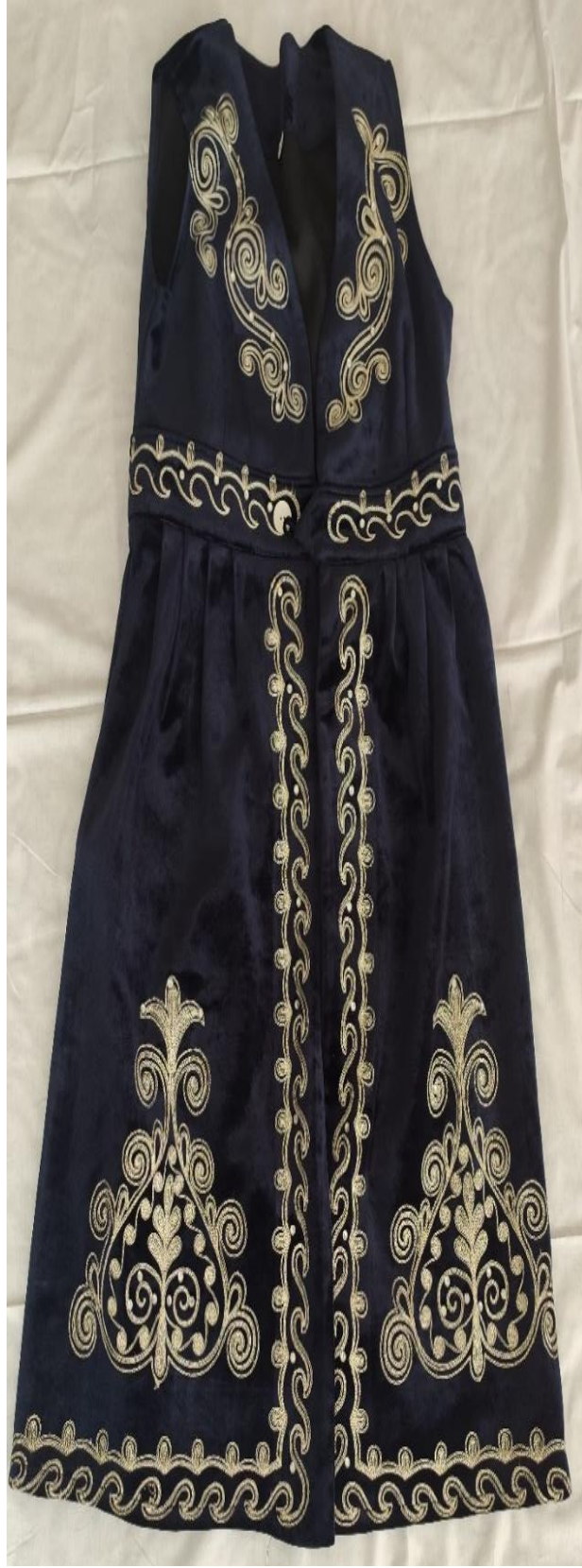
Şekil 62: Nişanda giyilen mesket (ön)