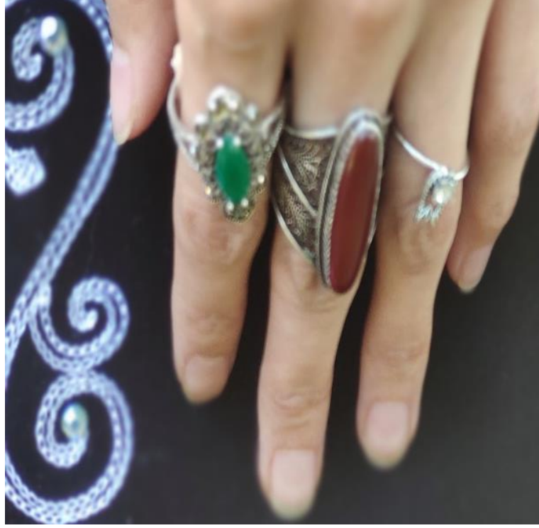
Şekil 26: Yüzükler