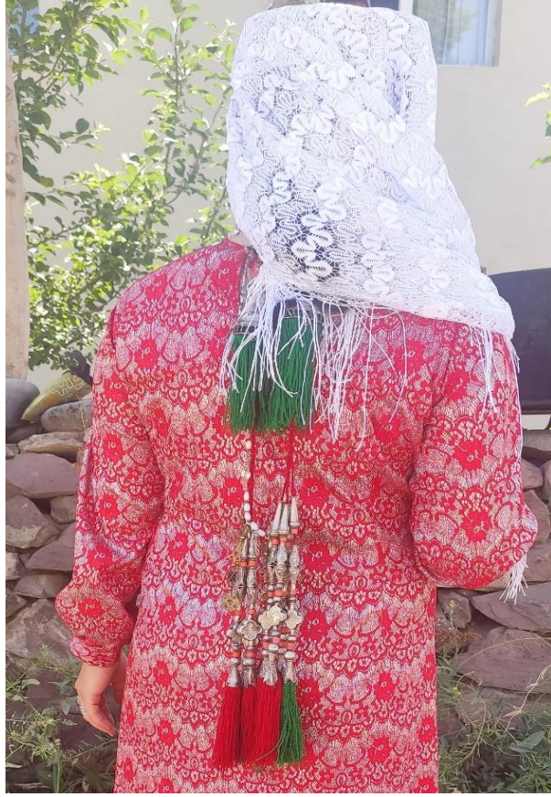
Şekil 28: Saça takılan aksesuar çaçbak