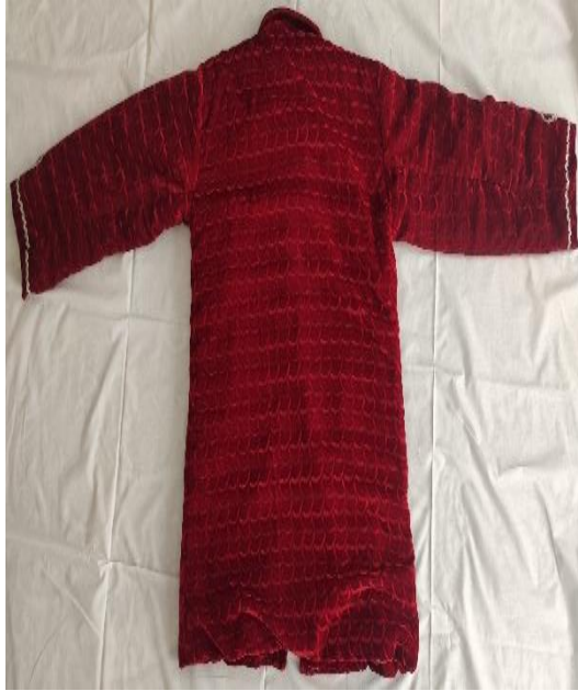
Şekil 53: Kezmur (arka)