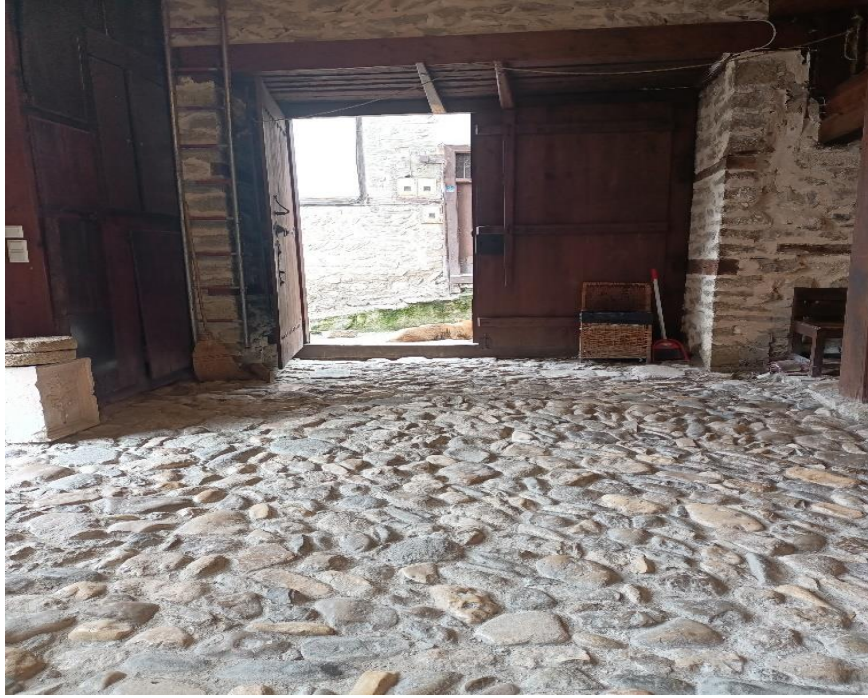
Görsel 17: Taşlık

Gün İçinde kadınlar komşularla birbirlerine gidip gelirler. Bu esnada ikramlık olarak sulu yayın yapıp kurutulmuş yiyeceklerden ikramda bulunulurdu (Katılımcı 10).