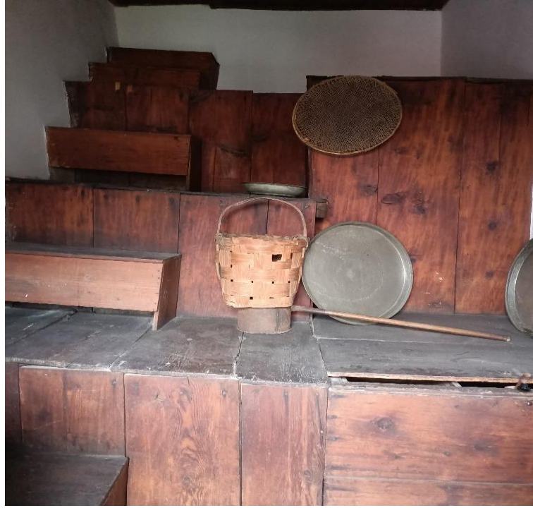
Görsel 10: Kiler

İkinci kata çıktığımda yine herkesin bütün aile fertlerinin ayrı ayrı odaları vardı ve her odanın işlevi kendi içinde bir bütündü. Başodaya (misafir odası) çok fazla girilmez kullanılmaz ve hazırda bekletilirdi. Her oda kendi içinde işlevsel bütünlüğe sahip olduğu için, oda uyuma, aynı zamanda oturma, banyo yapma ve yemek yapma gibi ihtiyaçların karşılandığı bir yerdi (Katılımcı 14).