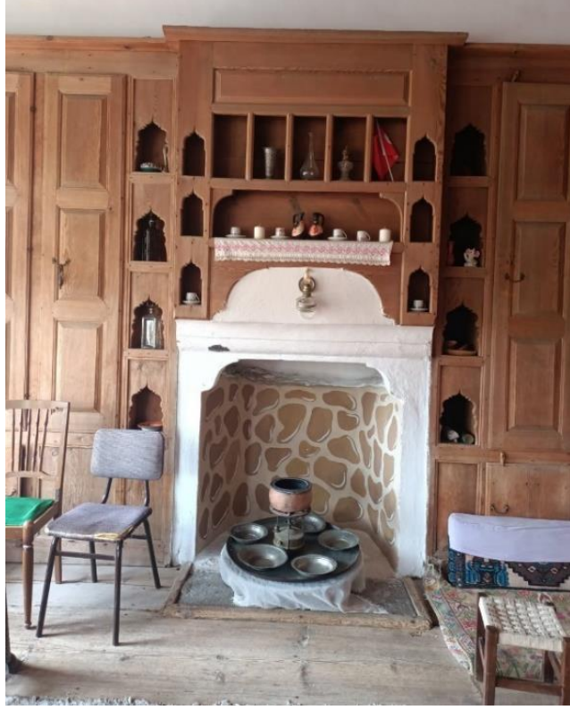
Görsel 3: Ocak