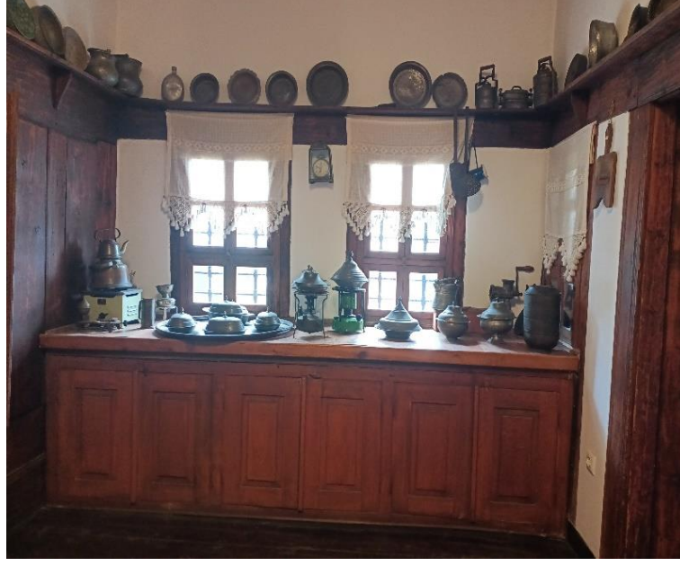
Görsel 9: Mutfak