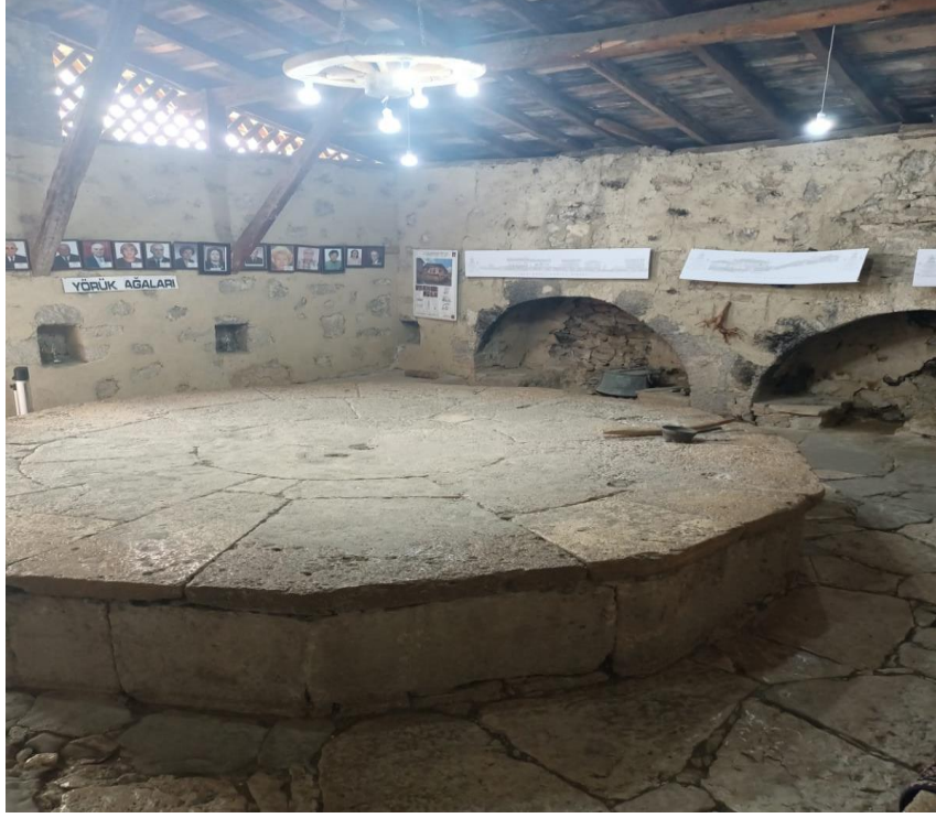
Görsel 15: Çamaşırhane

Konak içindeki her bir küçük aile için ayrılmış yüklüğü ve her türlü ihtiyacı karşılayacak odalar da gün içinde yemek hazırlama, dikiş dikme, gergef işleme, yeme, uyuma gibi rutin işler yapılırdı. Konağın giriş kısmında, taşlık veya hayat denilen alanda ocak yakılabilirdi. Bu ocakta pekmez, salça, bulgur yapılırdı. Özellikle kışlık erzak hazırlıkları bu alanda yapılırdı. Konakların temizliği çok zor olduğu için haftada bir veya on beş günde bir konağın temizliği yapılırdı. Eşyalar çardağa çıkartılarak Tavanların örümceklerinin temizliği ile başlayıp döşeme, tahtaların fırçalanması gibi detaylı olarak bütün odalar temizlenirdi. Tahtalar fırçalandıktan sonra nemlenmiş tahtanın kokusu evin tertemiz olduğunun kanıtı sayılırdı (Katılımcı 3).