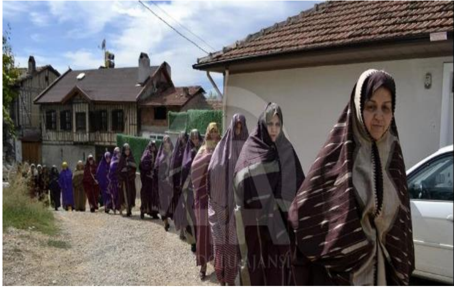
Görsel 21. Düğün evine geçiş

Gelinin annesi tarafından gelin almasının olduğu gün, birisi gelin için birisi de Sağdıç için iki tepsi baklava hazırlatılır. Baklavalara eşekler ya da katırlar üzerinde yerleştirilen cibinliklerle taşınmıştır. Gelin de kırmızı veya ipekten yapılmış, dört köşesine çubuklar geçirilmiş olan iki köşesinden gelinin tarafından, iki köşesinden damadın tarafından çocukların tuttuğu cibinliğe girer. Gelin ile aşçı da bu cibinliğe girerek geline aile hayatı hakkında bilgilendirmeler yapmaktadır (Sarıtunç, 2022, 141)