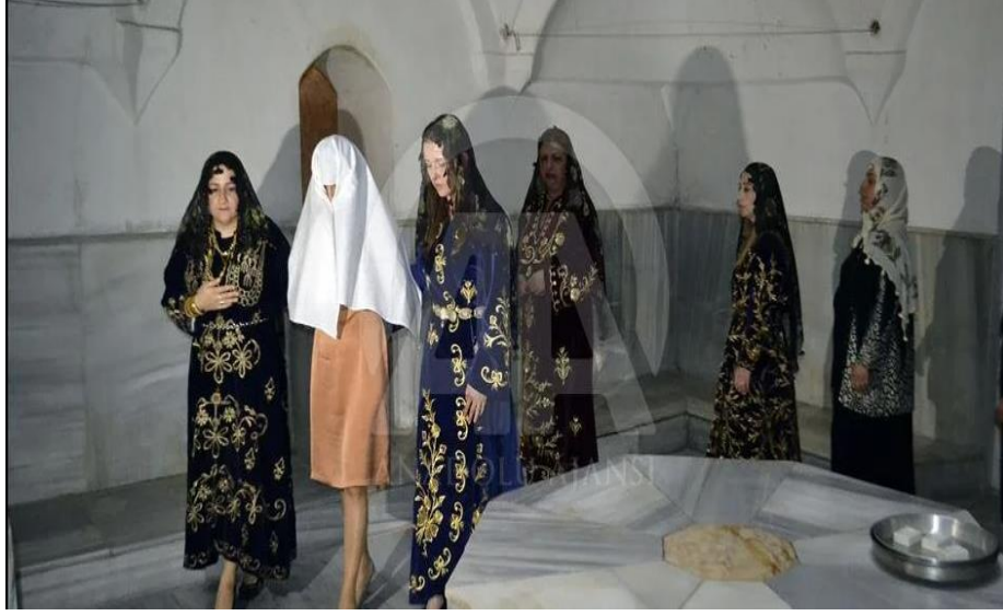
Görsel 20: Hamamda düğün günü