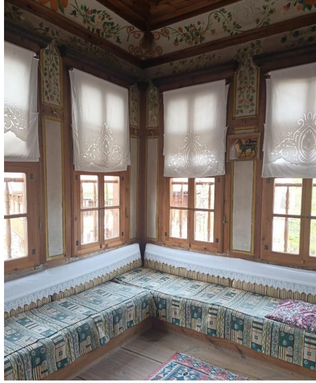
Görsel 5: Barok ve Rokoko süslemeleri

Sipahiođlu konak sahibi Katılımcı 3, konaklardaki odaların yazlık ve kışlık olarak planlandığını, yazlık odaların çok sayıda pencereyle köşelerde olduğunu, kışlık odaların ise pencere sayısının az bununla beraber tavanlarının alçak olduğunu ifade ediyor. Konaktaki ısınmayı kolaylaştırdığı için bu şekilde yapılmış. Tüm konaklarda evlerin giriş kapısı taşlıđa çıkar, Yörük köylüleri buna “eyvan” deniyordu. Bu yapıların merkezi ögesini eyvanlar oluşturuyordu. Sofaların dış yüzey cephe uzantıları hem içeri ışık girmesini sağlarlar hem de içerdeki sedirler de oturularak sohbet benzeri toplumsal işlevler için kullanılırdı. Konakların oda cepheleri mevsim geçişlerine göre ayarlanmış olduğu için günün farklı saatlerinde farklı cephelerde oturma gerçekleştirilebilirdi. Yapıların alt tarafı kâgir evin temelini oluşturup hayvan barinaklarının ve tahıl ambarlarının olduğu kısımlardı. Üst tarafları ahşap çatıklı olup çıkma ve cumba mimari öğeleriyle de tasarımda farklılıklar olurdu. Yörük köyünün bazı konaklarında çatı katında konumlandırılmış bütün köyü görebilecek bir görüş alanına sahip odaları vardı. Evlerde Ahır kokusunu önlemek içinde evin taban kısmı saman ve çamurla kaplanıp sonra tahta serilmiştir.