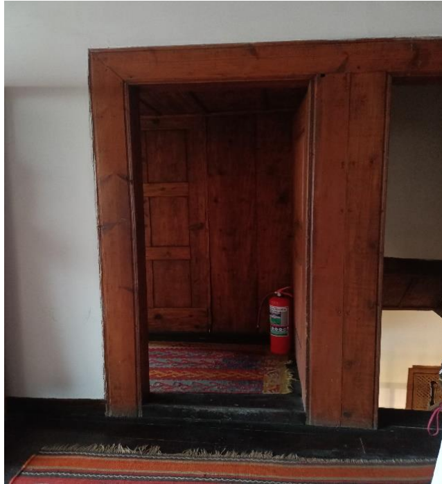
Görsel 4: Oda kapı girişi