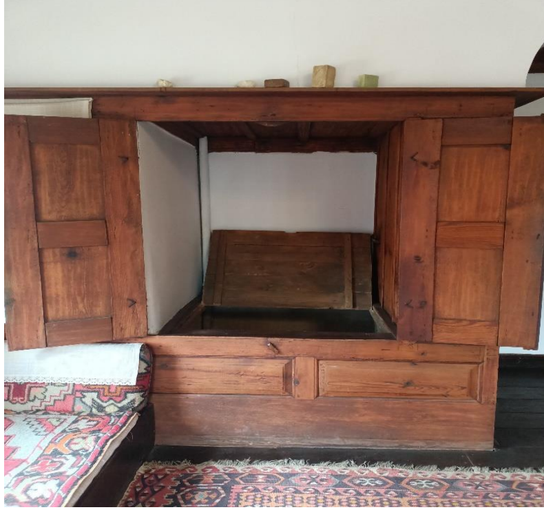
Görsel 16: Yüklük-Gusülhane