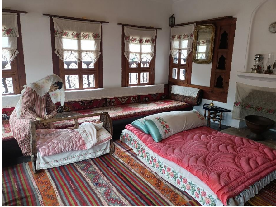
Görsel 19: Gelin odası

Türk toplumunda ve Osmanlı döneminde doğum, kadının yeri, yeni evinde itibar görmesi ve katıldığı aileye çocuk kazandırıp ailenin soyunun devam etmesini sağlamakla mümkündü. Hamile kadının çocuk sahibi olması ile gelişen adetler kadar hamile kadın içinde önem arz eden töre ve törenler söz konusudur. Tecrübesi ile işlerinin ehli kabul edilen ebeler doğumları evde yaptırırlardı. Ebeler “ebe ana” olarak bayramlarda ilk ziyaret edilen önemli şahsiyetlerin başında gelirlerdi. Doğum gerçekleşikten sonra bebek ilk babaya gösterilir. Bebek kız ise kulağı delinir ve doğumdan üç gün sonra bebeğe ad koyma töreni yapılır. Belirlenen ad, babası veya herhangi bir aile büyüğü tarafından bebeğin kulağına üç defa söylenip hafif bir sesle ezan okunur. Safranbolu Yörük Köyü’nde de çocuklara konulan isimler, Geleneklere töreye uygun olmalıdır. Doğumun 7., 22. ve 40. günü çocuk yıkanır. Çocuğun kırkı çıkmadan lohusa evinden başka bir yere ateş verilmez (Katılımcı 3).