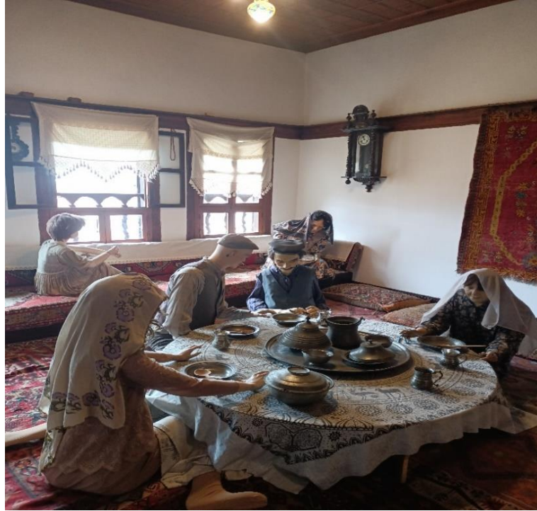
Görsel 8: Çardak