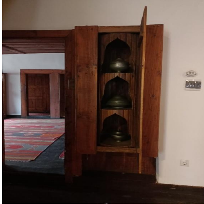
Görsel 14: Dönme Dolap