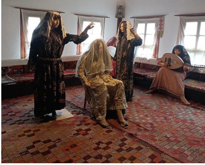
Görsel 21: Haremde kına gecesi