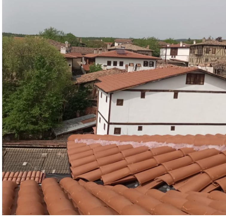
Görsel 6: Yörük köyü çatı katı odaları

Eşi ile evlendiklerinde bir süre konakta yaşadıklarını ama kış şartlarının konaklarda çok zorlu olmasından dolayı ve aile de yaşayan kişi sayısının az olması bakımından daha küçük bir evde yaşama isteği ağır basardı (Katılımcı 5).