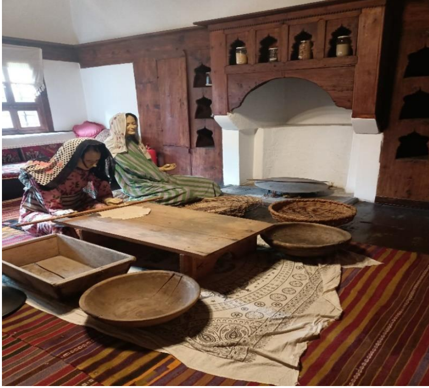
Görsel 7: Ocak (Aşhane)