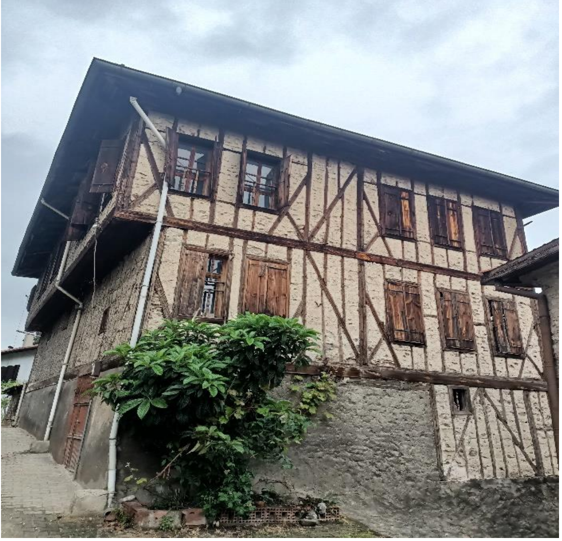
Görsel 12: Yeydana Sistemi

Safranbolu mimarisi oluşturulurken 1924 yılına kadar konakların taş işçiliğini Rumlar, ahşap işçiliğini Türkler yapmıştı. Her kat ahşap direklerle dik ve çapraz olarak giydirme usulü ile desteklenmişti. Yeydana sistemle çapraz ahşapların arası çamur ve taşla doldurulmuştu. Bu sistemin çivilemeden ziyade giydirme özelliği ile depreme karşı dayanıklılık sergiliyor olmasıydı (Katılımcı 8).