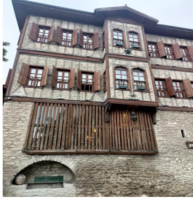
Görsel 13: Daraba Sistemi