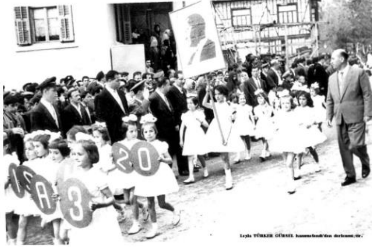
Görsel 22: 23 Nisan Ulusal Egemenlik ve Çocuk Bayramı Kutlamaları