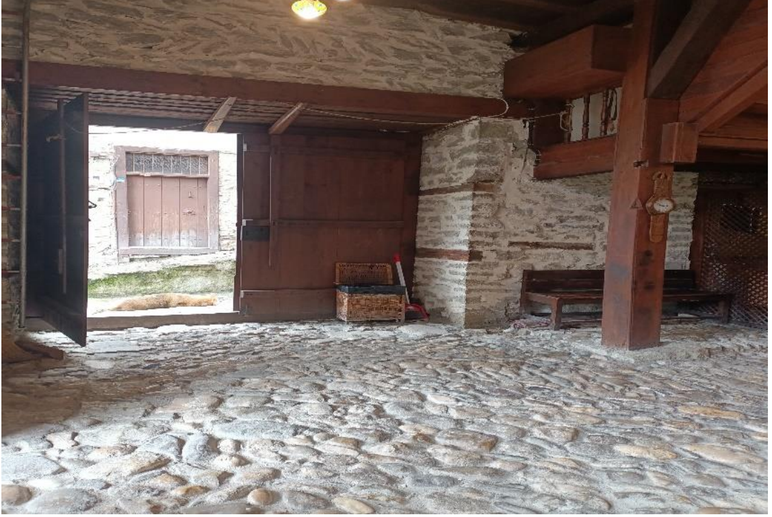
Görsel 2: Cümle kapısı

Odalarn köşeli olmasının sebebi, kapı açıldığında oda içinin mahremiyetinin görünmemesidir. Merdivenle bir kat çıkıldığında sofa, mutfak, kiler kısımları görülürdü. Çardaktan odalara geçiş yapılırdı. Her odanın kendi içinde hem ocağı, gömme dolabı, nişleri, yüklüğü, gusülhanesi ve yataklığı bulunurdu. Çardak alanı kışlık yapılan yiyeceklerin kurutulması, tarhanaların yapılması bazı sebzelerin kurutulması bu kapalı alanda yapılırdı. Çıkmalı alan yani sofalar kapısızdı ve orada küçük bir sedir vardı. Sofalar bütün odaların açıldığı ortak mekânlardı. Kalabalık toplantılar ya da börek baklava gibi hamur açmalı yemekler sofa da yapılırdı. Pencereler daha çok çıkmalarda ve sofalarda olurdu. Hiçbir Konak diğer konağın görüntüsünü, manzarasını kesmez ve konaktan dışarıya baktığı zaman da diğer konağın mahremiyetini göremeyecek şekilde inşa edilirdi (Katılımcı 3).