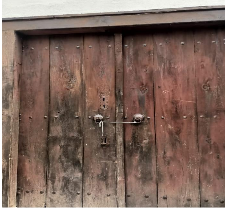
Görsel 23: Konak giriş kapısı

tutamak gül lap ya da çekecek denilen kapı halkaları ve tokmaklar vardır. Tokmağın kalın sesine göre, evin beyi çağrılır. İnce ses tokmağı vurulduğunda da evin hanımı kapıya bakması gerekir mesajı verilir. Her evin kapısında halkalar vardır ve halkalarda ipler vardır. Ve halkadan halkaya ip germe olayı vardır. Buradaki anlam eğer ip aşağıya doğruysa ev halkı evdedir. İp bir halkadan diğer halkaya sadece geçirilmişse çok az bir işim var hemen döneceğim mesaja taşır. Eğer ipler sıkı sıkıya bağlanıp kilit takılmışsa ve pencere kapakları da kapalı ise ben uzun süreli evde yokum mesajı verir (Katılımcı 3).