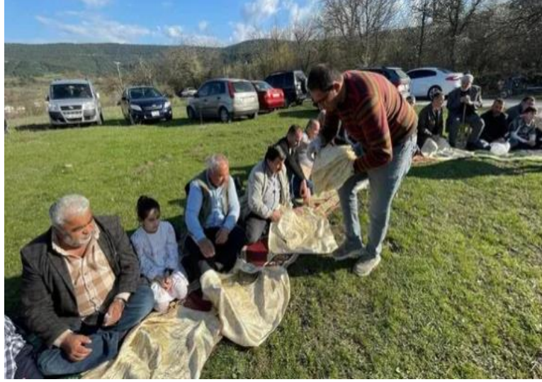
Görsel 18: Zırat Geleneği

Safranbolu'da bayramlar arife günü başlardı. Arife gününü şöyle bir manası vardır. Bayram gelmeden yakınları vefat eden kişilerin mezarlığı ziyaretiyle başlar, orada okumalar yapılır vefat eden kişinin hayrı için mezarlığa ziyarete gelen insanlara ikramlar dağıtılırdı. Ertesi gün bayram namazı kılınıp cami dışına çıkılarak ilk bayramlaşma cami içindeki cemaatle yapılır sonra cemaat dağılarak, bayram evlerde hane halkıyla bayramlaşarak başlardı (Katılımcı 11).