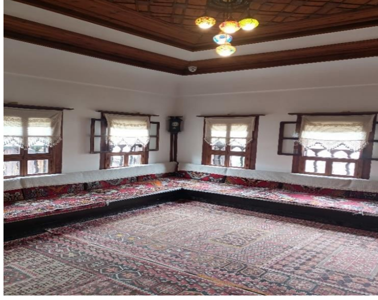
Görsel 11: Bařoda

Safranbolu eski yařamını ve insanın yařamı aslında bir okul nitelięi tařırdı. "Evlerin her bir odası bir insanın meřakkatli yařam hikâyesini anlatır. Doęumundan ölümine kadar Çocuklarımın torunlarımın o yařama řahit olmasını o evlerde kısa süreli de olsa yařamalarını o havayı solumalarını istiyorum, çünkü bu çocuklarımıza bırakılacak en büyük miras" ve ekliyor "evleri bir insan gibi görüyor anılarla var olan, yařayan, nefes alan bir varlıktır" diye dile getiriyor (Katılımcı 14).