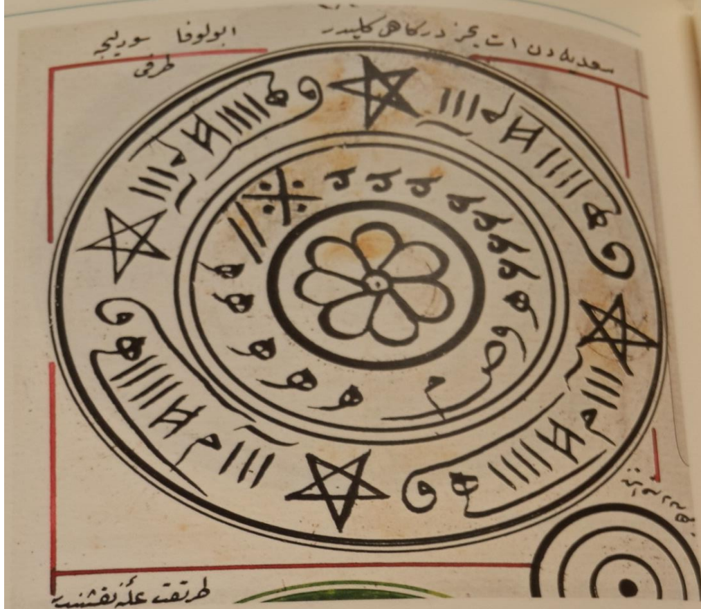
57- Sadiye Etyemez Dergâhı gülü (Mecmûa)