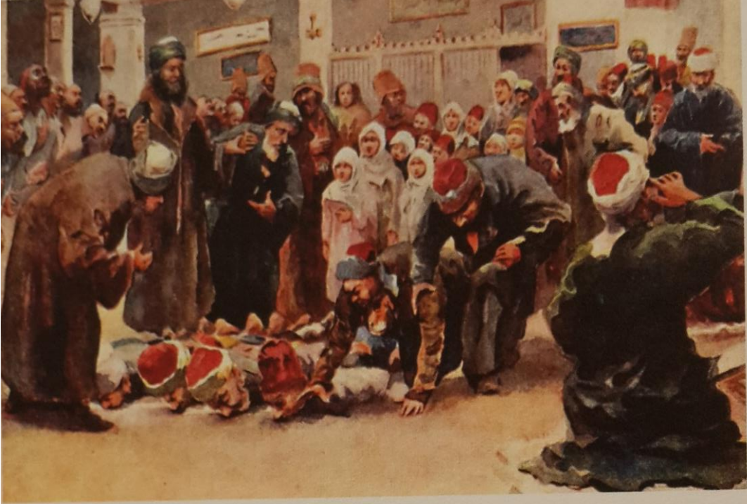
7- Devsiye Âyini

Sa'dî dervişleri, tarikatın merkezi olan Şam'da, Emeviye Camii'nde Cuma namazından sonra ayin yaparlardı. İstanbul'da Ayasofya Camii'nde ise özellikle Kadir geceleri Sa'dî ayini yapılırdı. Ayasofya Camii'ndeki büyük levhalardan Hz. Ali'nin adının yazılı olduğu levhanın altındaki yer Sa'dî tekkesi mensuplarına aitti.