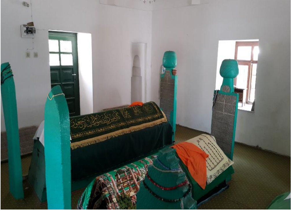
Süleyman Rüşdî'nin Kabri