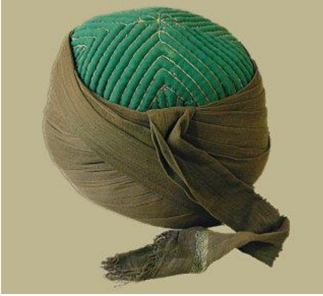
Uşşâkî Tâcî (TDV İslâm Ansiklopedisi, cild: XLII, İstanbul 2012, s. 232.)